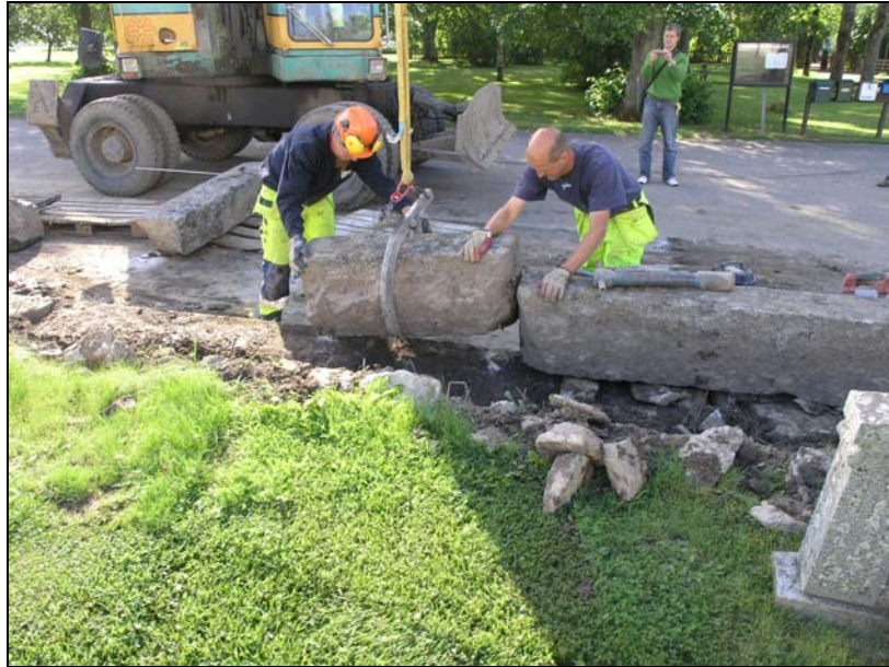
Figur 5. Inpassning av stenblocken på den södra muren.