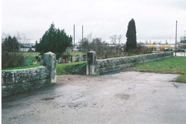
Figur 12. Stolpar och mur på östra sidan av kyrkan efter omläggning.