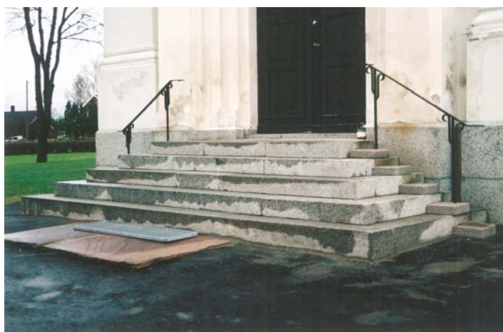
Figur 11. Trappan efter omlägningen