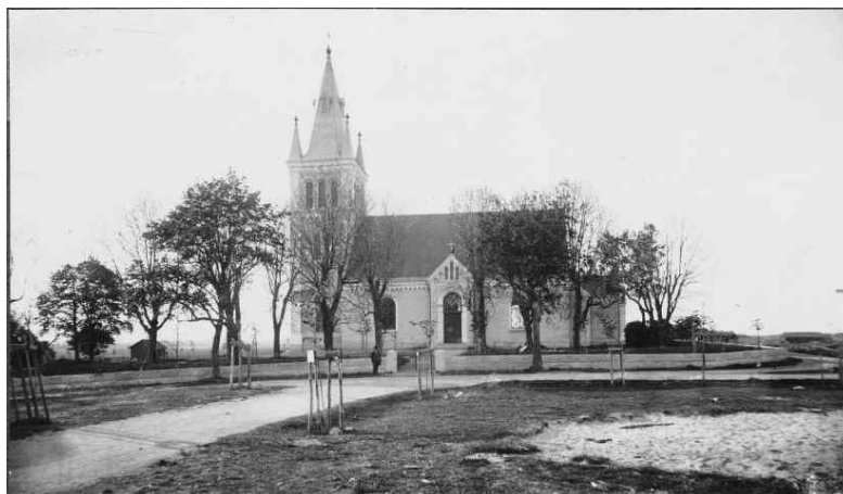
Norrby kyrka omkring sekelskiftet 1900.

Kulturmiljövård Mälardalen nr: 06041 Länsstyrelsen dnr: 433-13085-03 Fastighetsbeteckning: Sala Norrby Prästgård 1:2 Landskap: Uppland Län: Västmanlands län Socken: Norrby Kommun: Sala Ägare-beställare: Sala kyrkliga samfällighet Entreprenör: Allan Erikssons Mark AB Joakim Falk Fabriksg. 16 733 39 Sala Antikvarisk kontroll: Stiftelsen Kulturmiljövård Mälardalen Helén Sjökvist Stora gatan 41 722 12 Västerås