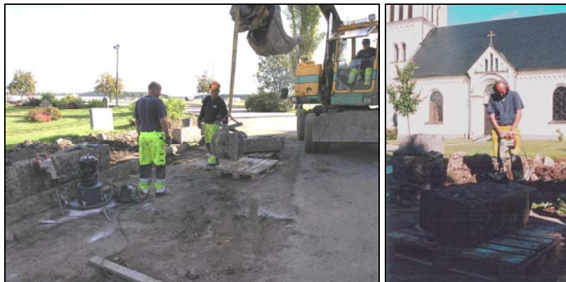
Figur 7. Arbete med stenläggning.