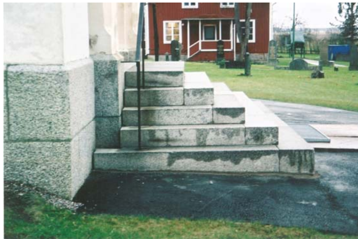
Figur 10. Trappan efter omläggning