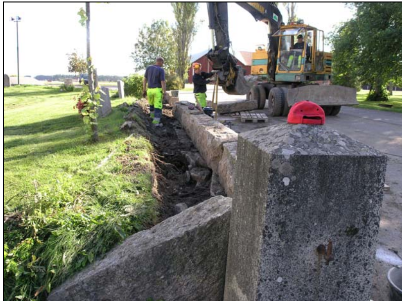
Figur 6. Baksidan av stenvallen utgrävd.