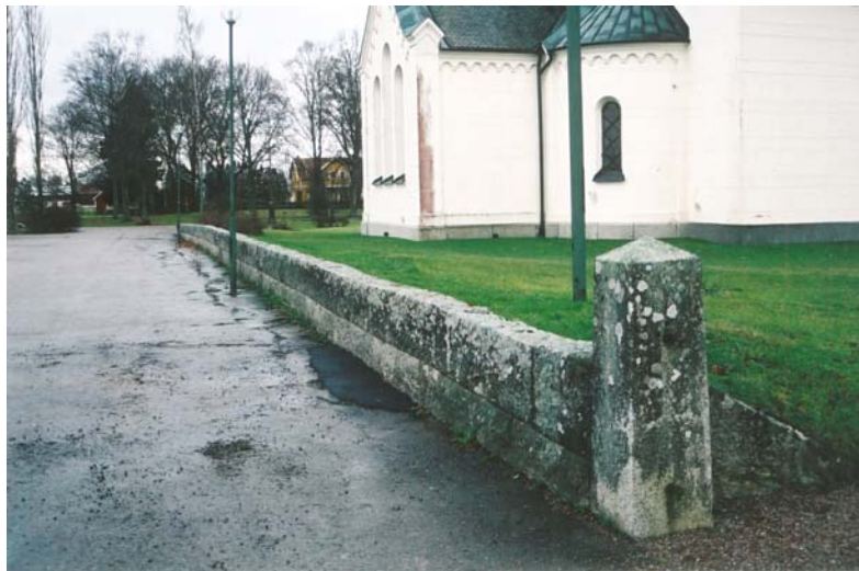
Figur 13. Muren på östra sidan efter omläggning.