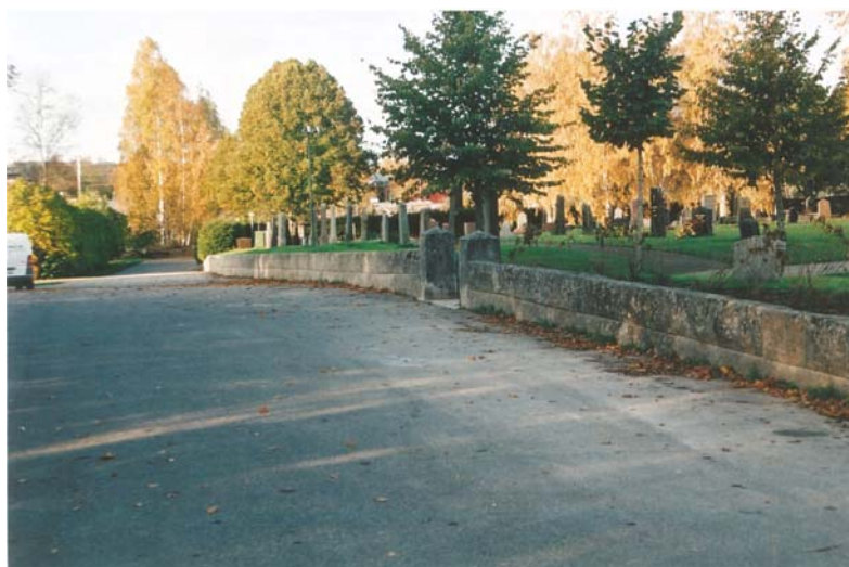
Figur 14. Muren på södra sidan efter omläggning