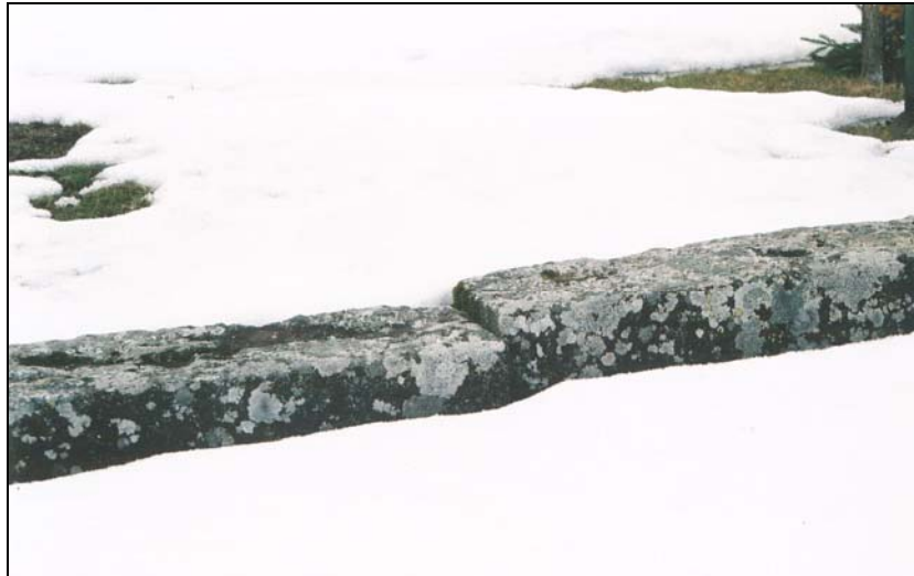
Figur 4. Detalj av östra muren före omläggning.