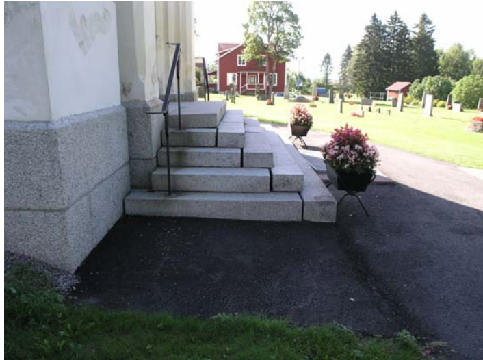
Figur 9. Trappan före omlägningen.