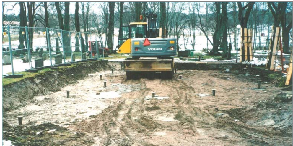
Figur 2. Undersökningsområdet från norr efter schaktning.

Den antikvariska kontrollen vid schaktningarna för bisättningshuset och avloppstanken gav ett negativt resultat. På platsen fanns inga spår efter S:t Olofskyrkan. Inte heller påträffades några lämningar efter gravar, till exempel omgrävda sådana, vilket var lite förvånande. På platsen fanns sedan tidigare en, nu riven, bisättningsbyggnad som förmodligen är orsaken till att inga gravrester kunde iakttas.