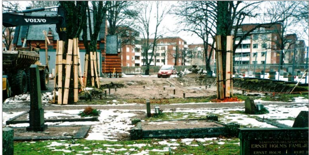
Figur 1. Undersökningsområdet från söder efter schaktning.