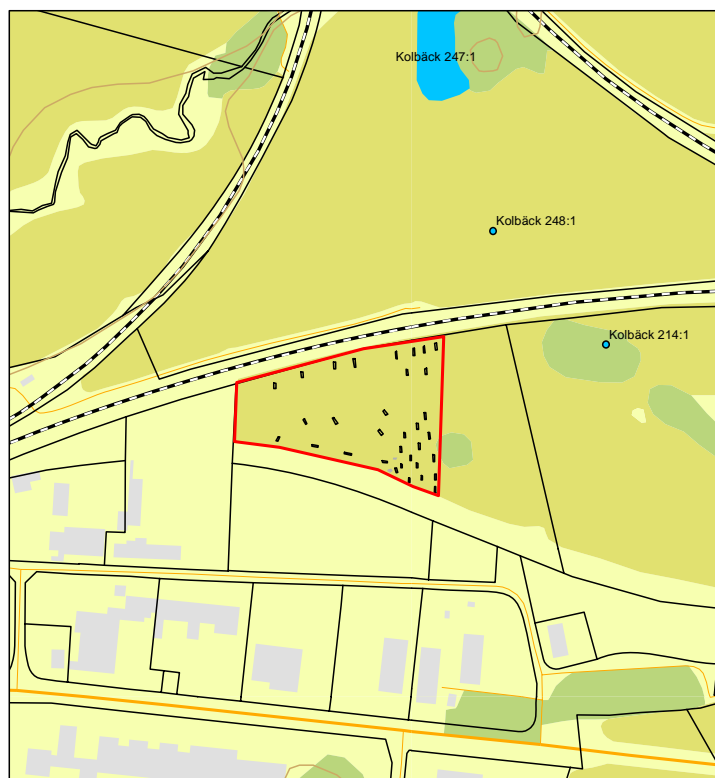
Figur 2. Schaktplan, de närmast belägna fornlämningarna är blåmarkerade. Utdrag ur digitala fastighetskartan, blad 11G 1e och 11G 1f. Skala 1:4000