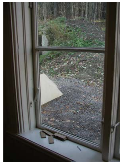
Figur 5. överst t.v. Lagning av hörnparti samt nytt hörnjärn.