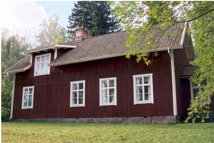
Figur 2. Fasaden mot söder. Digitalfoto VLM.