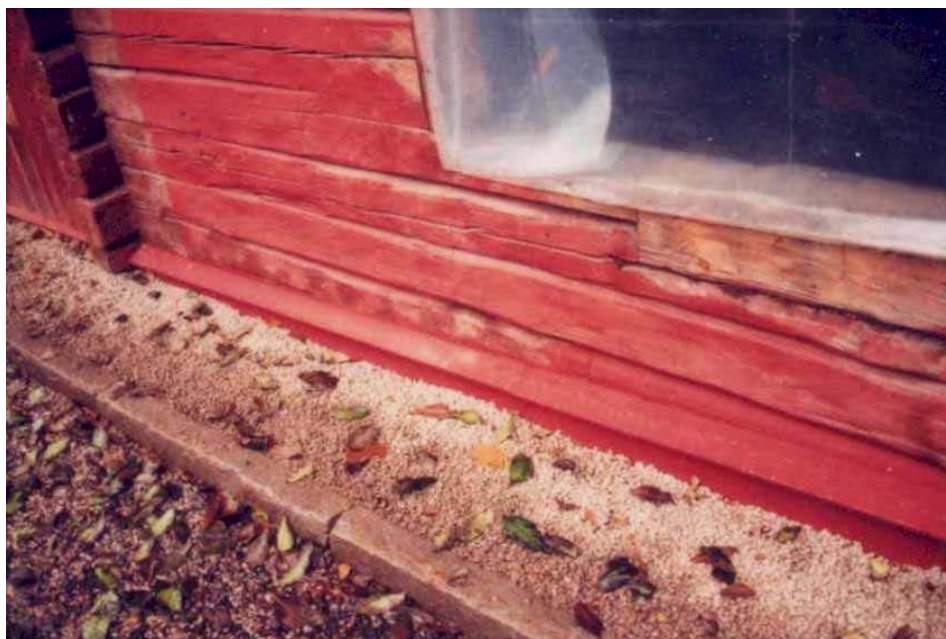
Figur 10, nederst. Färdigt resultat efter byte av syllstock vid det gamla affärsfönstret, mot Ablöfsgatan.