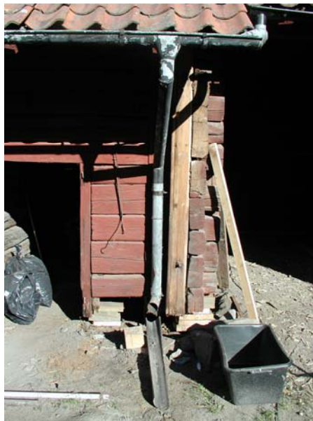
Figur 7, överst t.v. Äldre betongklack under byggnaden.