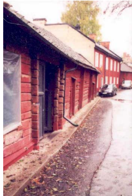
Figur 11, t.v. Fasaden mot Ablöfsgatan mot sydväst, efter utbyte av syllstockar. Marken utmed byggnaden är dränerad och grusad. Asfalten borttagen utmed byggnaden.