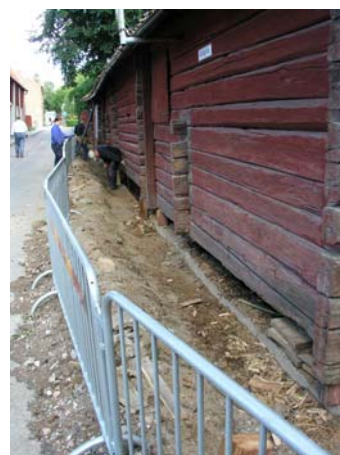
Figur 3, överst t.v. Interiörbild från utbyte av flera stockvarv vid inkörsporten. Digitalfoto: VLM. Figur 4, överst t.h. Borttagning av golv i den f.d. affärsboden i uthuslängan. Foto: VLM B103.962. Figur 5, nederst t.v. Utbyte av stockvarv mot Ablöfsgatan. Foto: Skultunabyggen. Figur 6, nederst t.h. Utbyte av stockvarv mot Ablöfsgatan. Foto: Skultunabyggen.