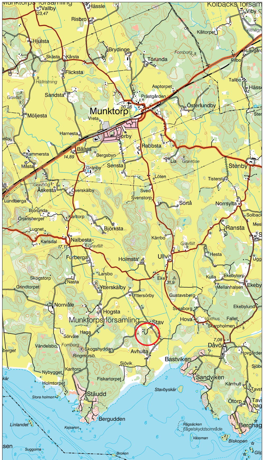
Figur 1. Utdrag ur den digitala Gröna kartan med undersökningsområdet markerat med en röd ring. Skala 1:50 000.