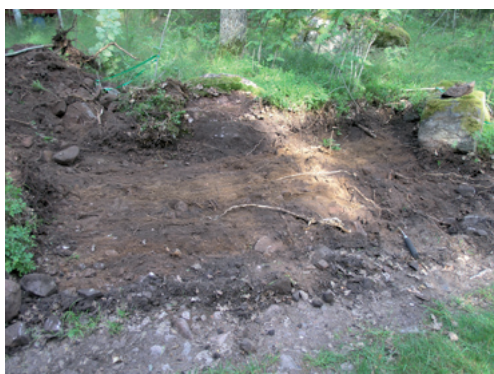
Figur 3 (ovan t.v.). Förundersökningsområdet intill vägen som ska breddas. Det aktuella området är markerat med plastband. Fotograferat från SÖ.