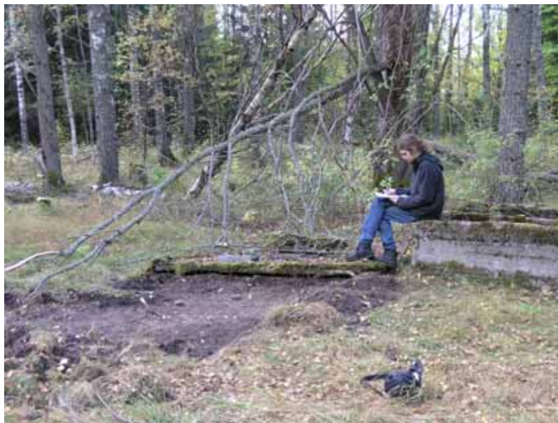
Figur 4. Norra delen av schaktet vid matsalen. Bilden visar också betongfundamentet vid matsalens ingång (519) samt betongkonstruktionen 515 som tolkats som avfallsbinde eller grundkällare.

De båda lagren avgränsades från varandra av en mindre stensamling. Stenarna är ganska små och deras utspridda utseende tyder på att de rubbats i samband med rivningen av lägret och tidigare utgjort en mera prydlig avgränsning av ytan. I anslutning till stenpackningen fanns även fundamentet till en stolpe (972). Möjligen har denna också ingått i avgränsningen.