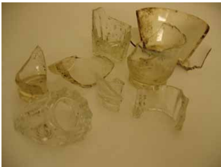
Figur 5.. Fragmenten av dricksglas (ingår i fynd 1119) som hittades i avfallshögen (1078, 1082).

I östra delen av avfallshögen karterades en hög trasiga tegelstenar och någon meter ifrån denna en koncentrerad samling mindre stenar. Även fler stenhögar noterades. Här är det rimligt att sten- och tegelansamlingarna är resultatet av att man har haft ambitionen att sortera byggnadsavfallet, möjligen med syfte att återanvända delar av det. Uppeldningen av byggnadsmaterialet påvisas i form av den brandpåverkade sand och det kol som fanns i avfallshögen. Bland avfallet hittades också en hel del tegelrester, glas, böjda spik och träflis. Det fanns i samband med undersökningen ingen möjlighet att samla in alla rester av byggnadsmaterial, utan ett mindre referensprov togs upp.