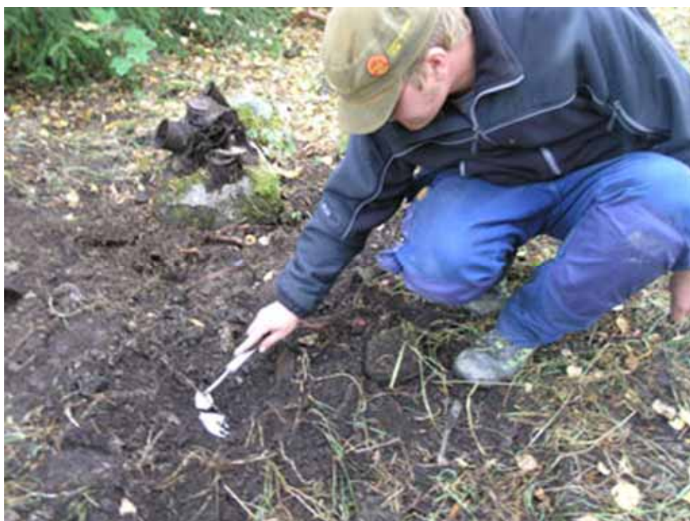
Figur 3.. Utgrävningen av avfallshögen hösten 2005

Resultatet av undersökningen presenteras utifrån de identifierade strukturerna och i presentationen av resultaten sammanförs inmätningar, utgrävningsresultat och fyndmaterialet.