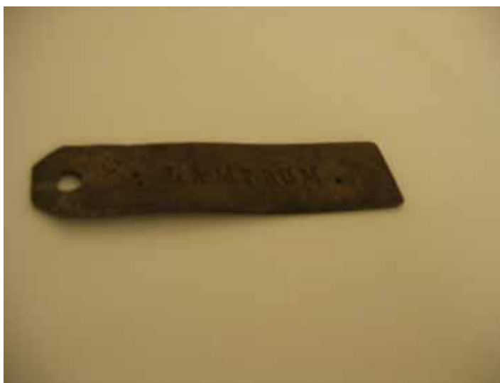
Figur 6 . Den lilla skylten med texten Lamprum (ingår i fynd 1510).

Eftersom bostadsbarackerna bedömdes som den viktigaste delen av lägret ur de internerades synvinkel förlades tre av undersökningens sammanlagt sju schakt hit (schakten 784, 1319, 1442). Inga lämningar av de regelrätta bostadsbarackerna är idag synliga ovan mark, utan valet av undersökningsytor baserades helt på muntliga uppgifter. Tyvärr omöjliggjorde den täta skogen i södra delarna av området för Krampen-lägret ytterligare undersökningar av de internerades bostadsbaracker.