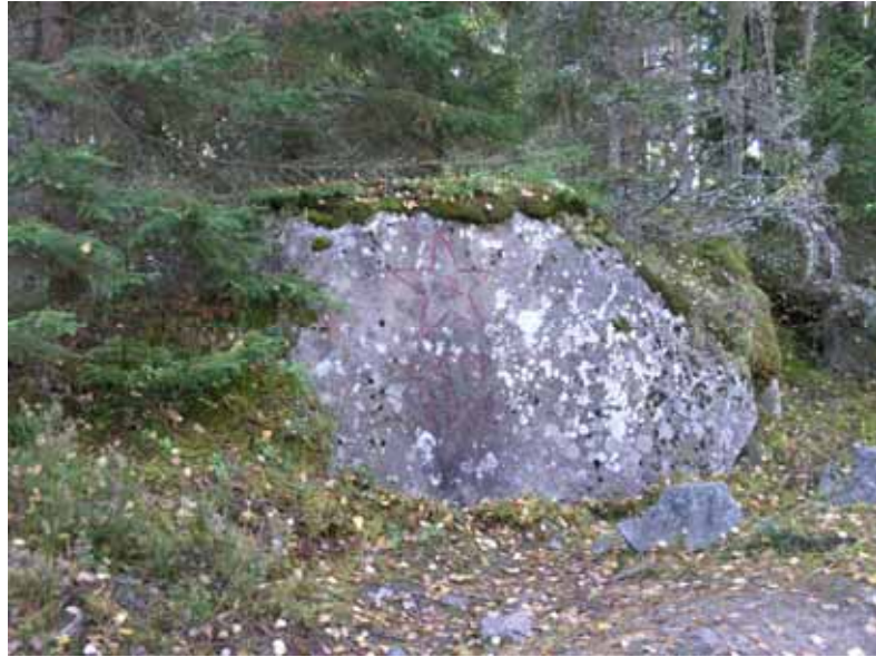
Figur 2. "Ryss-stenen" RAÄ 1, Heds socken. Fotograferat av Joakim Kjellberg 2005.