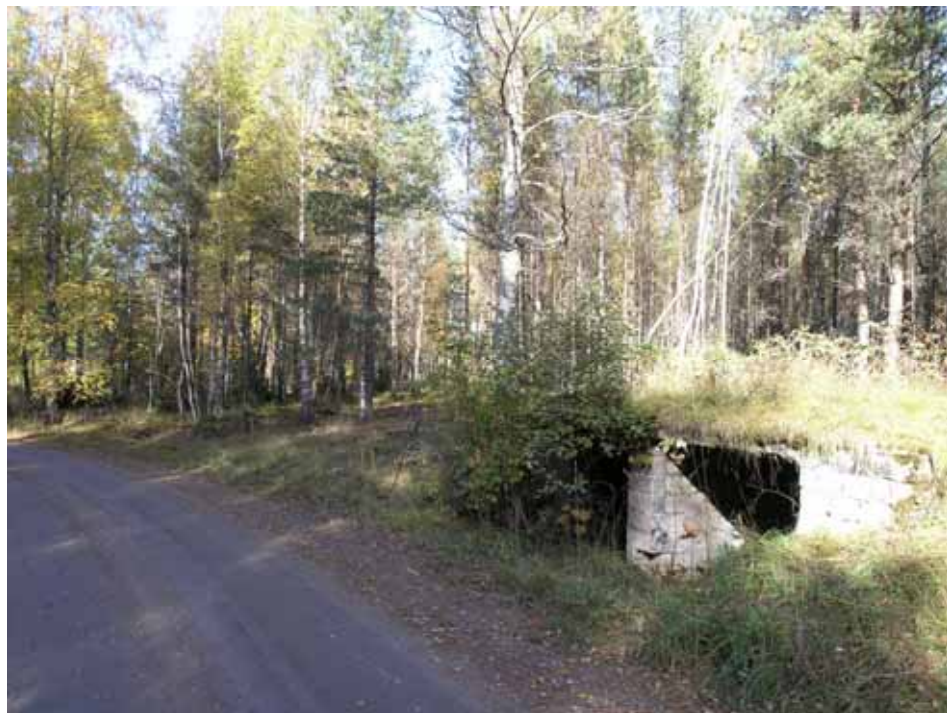
Figur 8 . Rysskällaren idag. Fotograferat av Joakim Kjellberg 2005.

I samband med de arkeologiska undersökningarna i Krampen mättes konstruktionen in och dokumenterades, men någon utgrävning i eller kring den företogs inte. Det kunde dock konstateras att betongkonstruktionen bär tydliga spår av ombyggnad/tillbyggnad något som sannolikt bör sättas i samband med lägrets utbyggnad. Det finns informanter som menar att källaren fanns på platsen innan lägret (muntliga uppgifter som finns samlade i det arkivmaterial som förvaras på Västmanlands läns museum). Ombyggnaden kan då ha att göra med lägrets etablering.