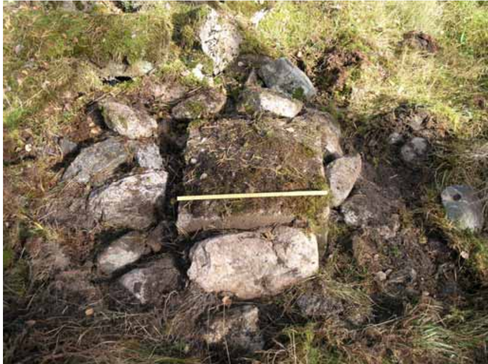
Figur 9 . Plinten med stenskoning (1522).