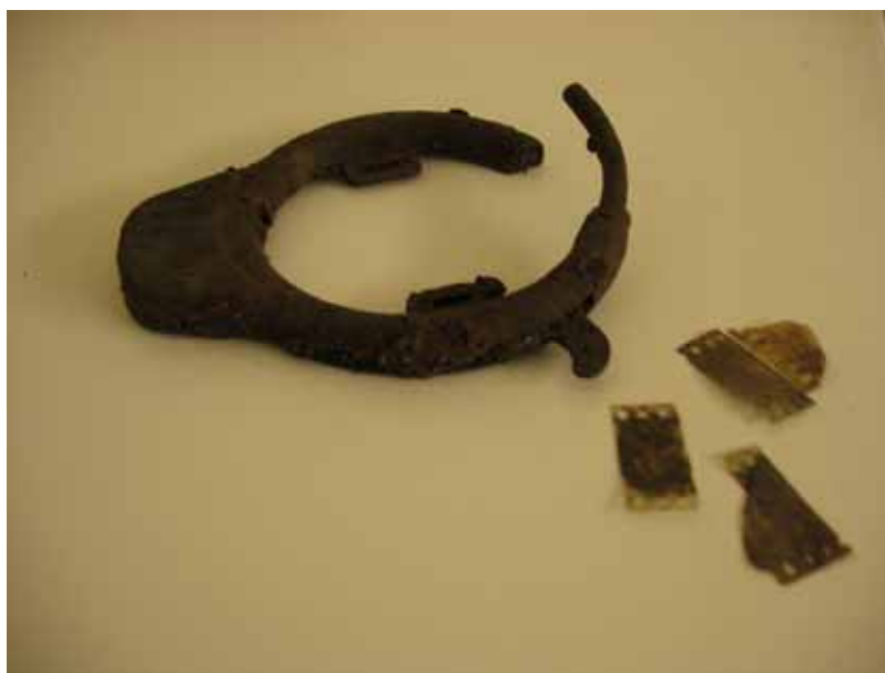
Figur 7. Cykellåset (708) och de fragmentariska filmbitarna (709).

Nära gränsen mellan gräsytan och uppfartens gruslager finns två stolphälsnedgrävningar (638, 713). En av nedgrävningarna (638) innehåller en hel del mindre sten som rimligen utgjort en stenskoning för stolpen. Avståndet mellan stolphälsen är 3,29 m och de ligger på samma avstånd från gruslagret. De skulle kunna utgöra resterna efter exempelvis ett stängsel eller liknande som avgränsat de olika typerna av ytor från varandra. På grund av schaktets begränsade storlek är detta inte möjligt att avgöra. I den ena nedgrävningen (638) hittades två fragment av film (709). Tyvärr gick filmrutornas motiv inte att avgöra.