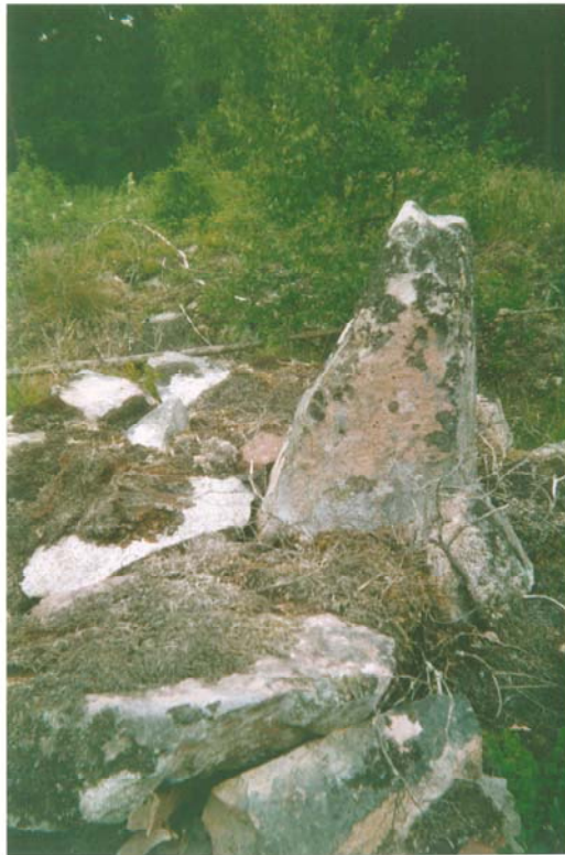
Figur 4, nederst. Mittstenen fotograferad från väst.