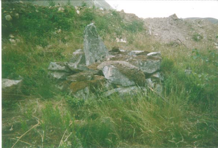
Figur 3, överst. Gränsmärket fotograferat från norr. Dumpmassorna i bakgrunden utgör den norra begränsningen för bergtäkten.