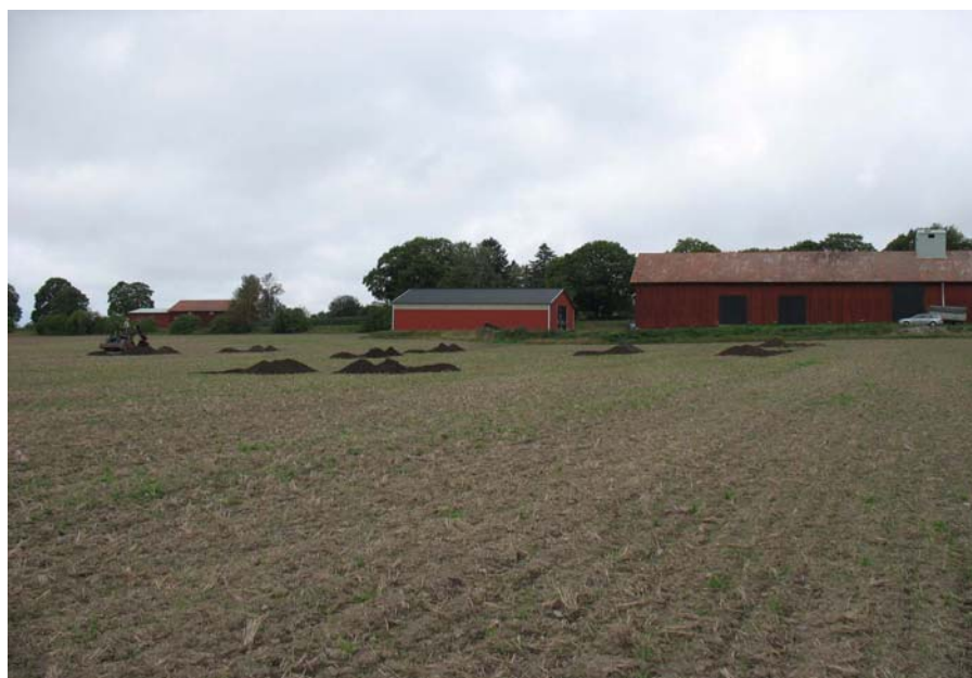
Figur 1. Vy över utredningsområdet, foto från sydöst av Jan Ählström.

På den nordväst om utredningsområdet liggande Äsåsen finns flera registrerade fornlämningar. Där finns fyndplatser för stenyxor, ett gravfält med högar och runda stensättningar samt en boplats. Närmast utredningsområdet finns två borttagna block, ett med en runristning (RAÄ 171) och ett med skålgropar (RAÄ 142) samt ett sentida minnesmärke (RAÄ 83).