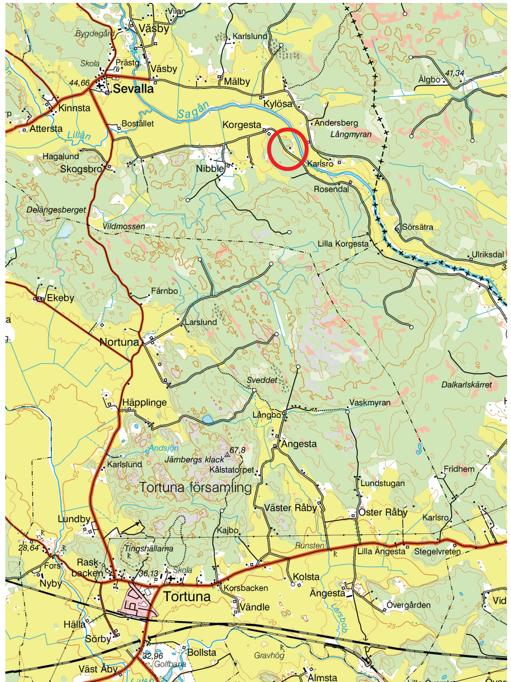
Figur 1. Utredningsområdets läge, markerat med en ring. Utdrag ur digitala gröna kartan 11H SV Enköping. Skala 1:50 000.

Kartor ur allmänt kartmaterial ©Lantmäteriet. Ärende nr MS2006/01407