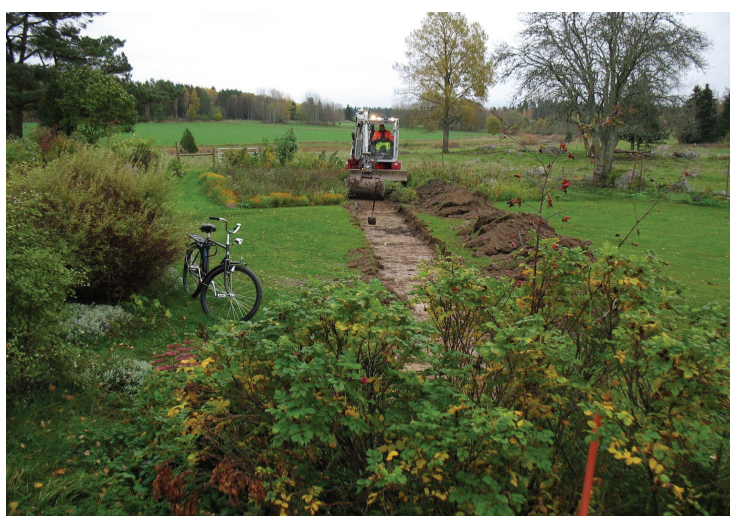
VA-ledningen. Spaden markerar läget för härdarna, A1 och 2. Från N, foto Jan Ählström.