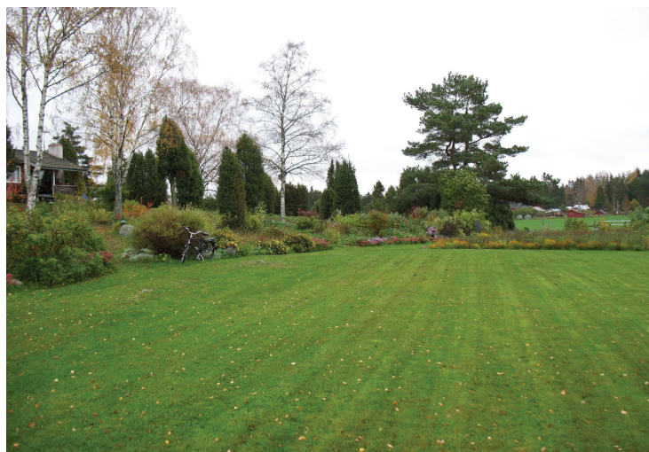
Från cykeln och mot höger bildkant grävdes schaktet för VA-ledningen. Från VSV.