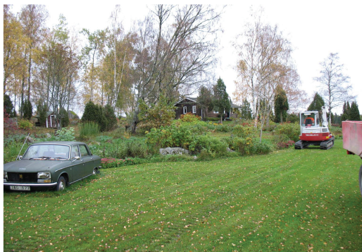
Platset för busbygget. I siktlinjen från bilen mot buset skall det nya buset byggas.