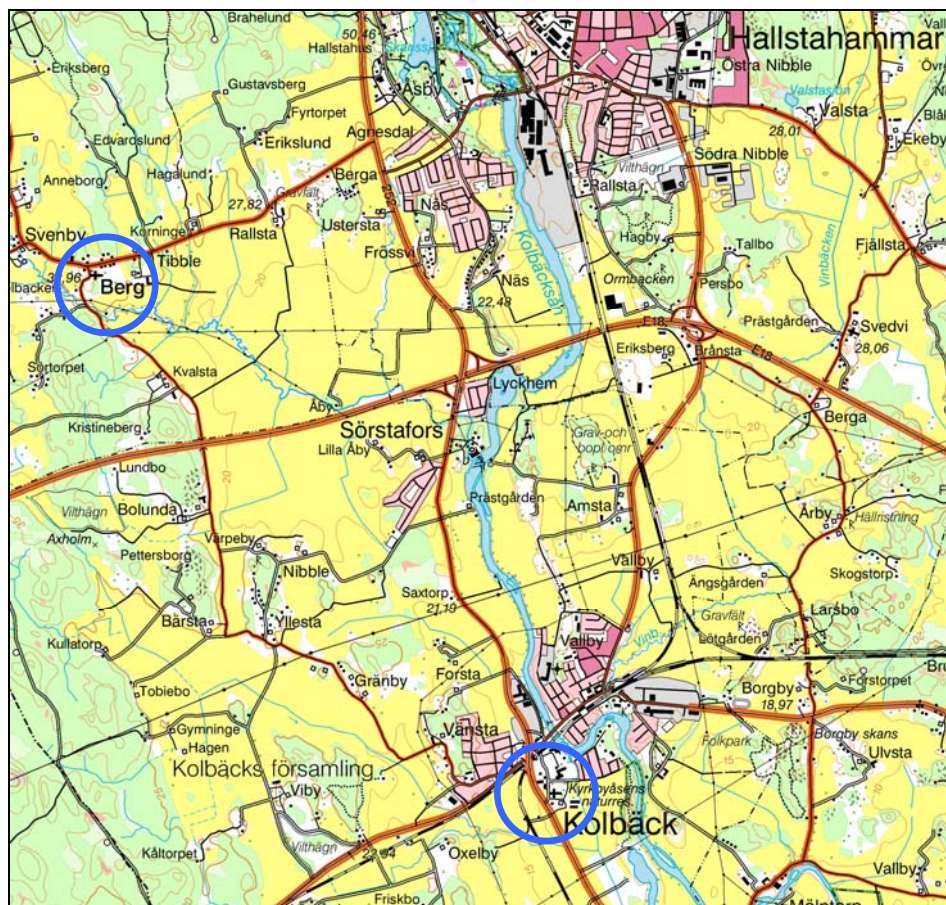
Figur 1. Kolbäck's och Berg's kyrka inmarkerade på Gröna kartan.

Under 2006-2007 har åskledaranläggningarna på Bergs respektive Kolbäck's kyrka setts över och kompletterats. Tillstånd till arbetet har givits av Länsstyrelsen i Västmanlands län, för Berg dnr 433-11076-2006 och för Kolbäck dnr 433-11075-2006. Arbetet har stått under antikvarisk kontroll av Kulturmiljövård Mälardalen. Arbetet är godkänt ur antikvarisk synvinkel.