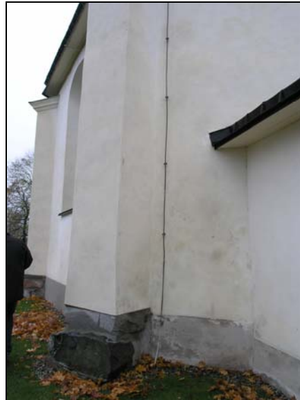
Figur 2 t.v. Kolbäcks kyrka n.ö hörnet, åsokedare före åtgärder.