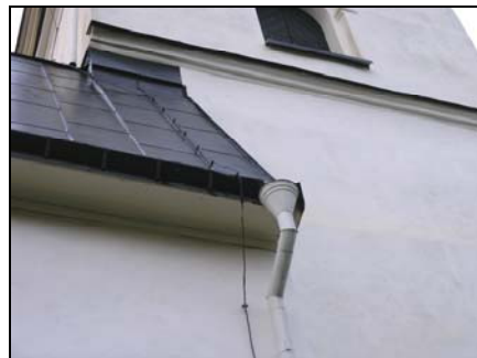
Figur 4 t.v. Kolbäcks kyrka norra sidan vid torn, åsokedare före åtgärder.