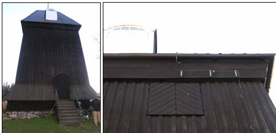
Figur 17. Bergs kyrkas klockstapel efter åtgärder.