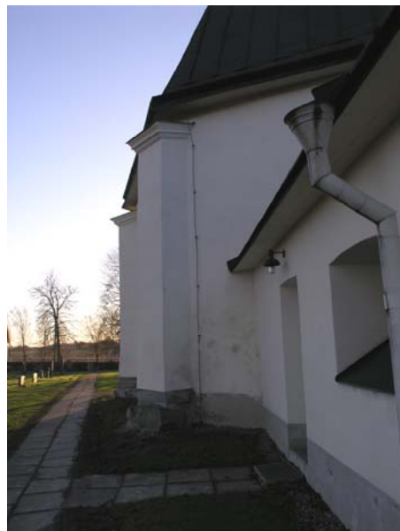
Figur 10. Kolbäckes kyrka, nord östra hörnet, befintlig infästning använd.