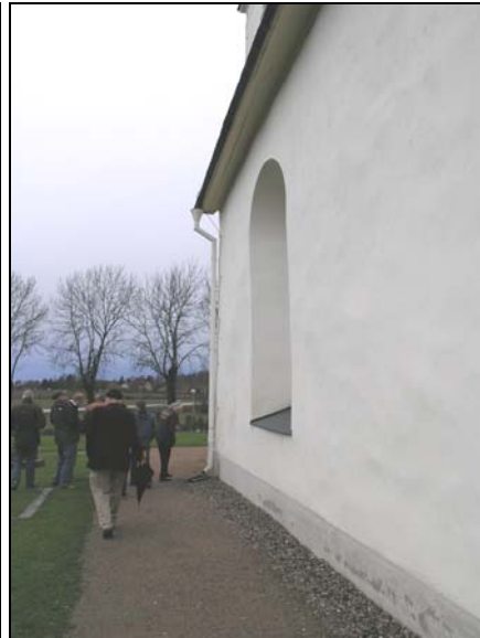
Figur 3. t.h. Kolbäcks kyrka s.v. hörnet, åsokedare före åtgärder.