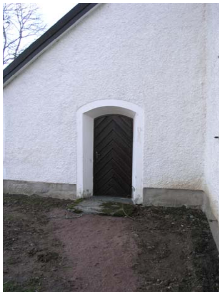
Figur 9. Bergs kyrka ingång till sakristia. Inledningen till elskåp dragen i anslutning till dörrkarmen.