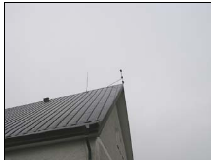
Figur 5. Bergs kyrka. Åsokedare före åtgärder.