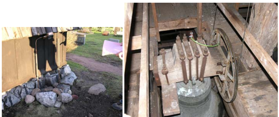
Figur 19. Inspekteringsbrunn sydvästra hörnet på klockstapeln.