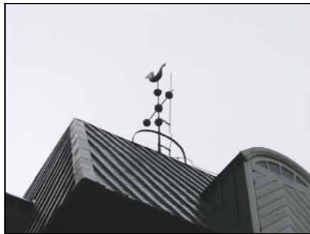
Figur 8. Bergs kyrkas klockstapel, åskskydd före åtgärder.