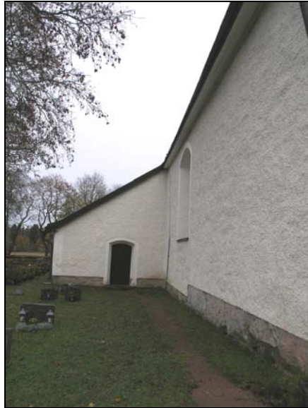
Figur 6. Bergs kyrka norra sidan före åtgärder.