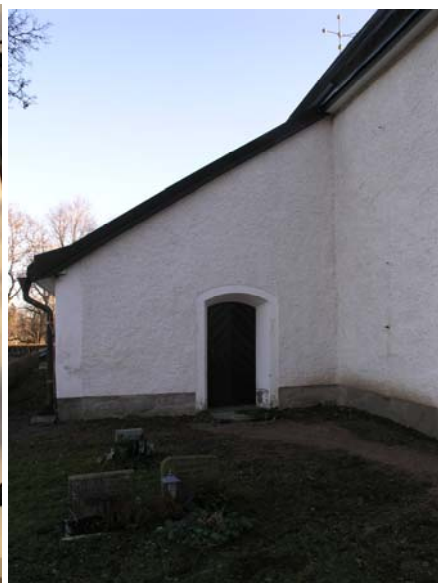
Figur 13. Kolbäcks kyrka tornets södra sida. Befintlig infästning använd för åsokedare. Figur 14. Bergs kyrka, norra sidan. Borttagen infästning för åsokedare i hörnet mellan sakristia och långhus. Putslagning skall genomföras med kalkbruk där fästpunkter tagits bort.