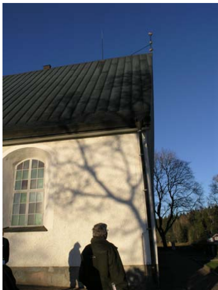
Figur 15. Bergs kyrka infästning av åsokedare mot kopparstuprör. Ny placering ersätter den borttagna se figur 14. Inspekteringsbrunn på sakristians nordöstra hörn breddad. Figur 16. Bergs kyrka. Korsen vid nocken är kopplade till åskeskyddet. Infästningarna i koppertaket är bytta då de befintliga var korroderade.