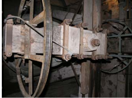
Figur 11. Kolbäcks kyrka, ny infästning av åsokedare vid korset gjord med befintliga fästpunkter. Figur 12. Kolbäcks kyrka. Klockorna är anslutna till åskeskydd.