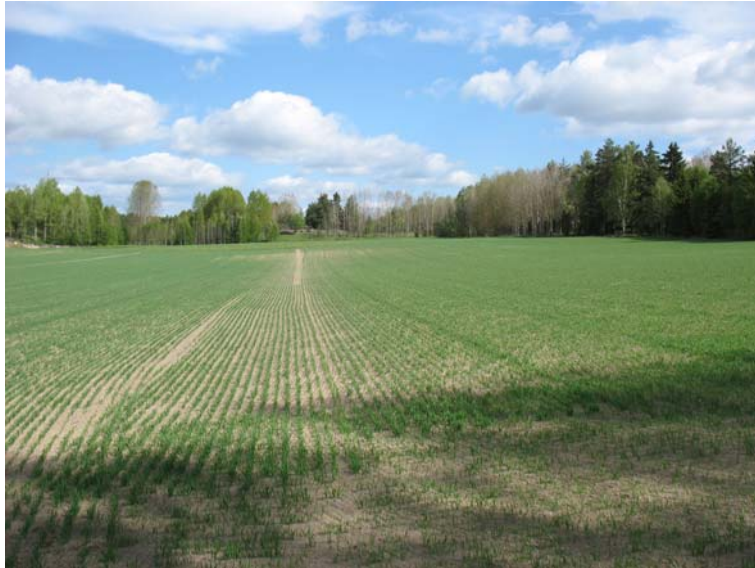
Foto 2. Vy från yta B mot yta C och D.

Från skogen sträcker sig en svag höjdrygg i västlig riktning. Höjdryggen avslutas i väster med en markerad höjd. Från höjdryggen sluttar marken åt väster och mot svackan i söder samt svagt mot norr. Här grävdes 6 schakt om 36 löpmeter (se figur 2). Schakten grävdes 0,2-0,3 meter djupa genom matjord och ploglager. Närmast skogen gick berget i dagen och på höjden i väster förekom det en hel del sten i schakten. I övrigt vidtog orörd lera under matjord och ploglager. Det förekom inte någon fornlämningsindikation.