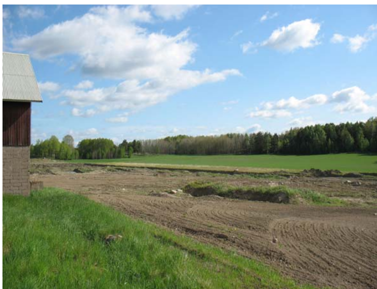
Foto 1. Vy mot utredningsområdet från västra sidan av dalgången, från Hanbo. Utredningsområdet motsvarar det gröna markområdet bitom skogen. I bildens mitt anas spår efter tidigare lertäkter.

Det 34 000 m 2 stora utredningsområdet ligger på den östra sidan av en uppodlad dalgång på nivåer mellan 55 och 60 möh, de lägsta nivåerna finns i områdets västra del. Öster om utredningsområdet är marken skogbevuxen med höglänta partier. Området sluttar i västlig riktning från skogsmarken ner mot dalgångens botten. I utredningsområdets nordöstra och sydöstra del förekommer det några flacka partier, däremellan i områdets centrala del är en större svacka belägen. Merparten av området utgörs av åker som vid tidpunkten för sökschaktningen var bevuxen med späd gröda utom i den nordligaste tredjedelen där det växte vall.