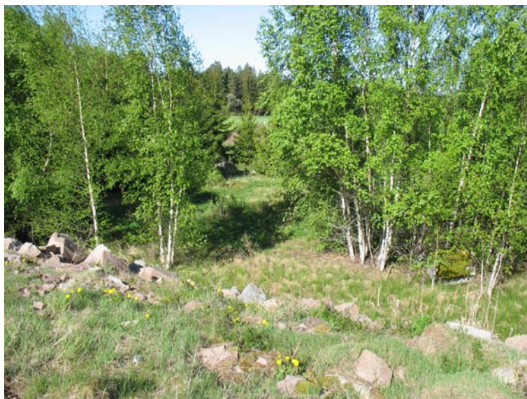
Foto 1. Vy över utredningsområdet från virkesterminalen. Foto från Ö.

I närheten av det markområde, tippyta 5, som man önskar ta i anspråk för överskottsmassor finns tre stensättningar (RAÅ 106, 107 och 108). Vid en besiktning av platsen utförd av länsstyrelsen och KM i december 2006 påträffades ytterligare en stensättning samt ett odlingsröse. I samband med besiktningen definierades ett nytt och mindre område som tar hänsyn till fornlämningarna och som skulle kunna tas i anspråk utan antikvariska åtgärder (Lst Meddelande 2006-12-07, lst dnr 431-13872-06) (se figur 2). För ytorna därutänför förelåg behov av arkeologisk utredning. Det uppdrogs åt KM att bistå Vägverket Produktion vid utstakningen av det nya, mindre, området vilket gjordes i början av januari 2007. Den nya ytan bedömdes dock som otillräcklig varvid processen avstannade. I maj 2007 återupptogs processen genom att Vägverket Produktion avsåg att bekosta en utredning av en delyta utanför det insnävade området.