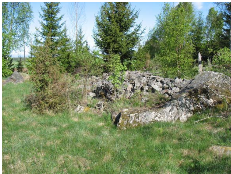
Foto 3. Odlingsröset, objekt A.

Vid utredningen dokumenterades tre lämningar som är synliga i markytan, två odlingsrösen (objekt A och B) samt en sträng av odlingssten (objekt C) (se figur 2). I den öppna delen av området förekommer det även flera diken vilka löper i både öst-västlig och nord-sydlig riktning (ej dokumenterade).