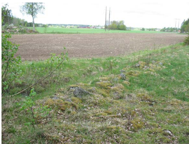
Foto 4. Strängen med odlingssten, objekt C.

Odlingsröset objekt A är 9,0 meter stort, 1,0 meter högt och oregelbundet. Röset är ej övertorvat och stenarna är ofta skarpkantade. Odlingsröset, objekt B , motsvarar det röse som uppmärksammades vid besiktningen. Det är 3,0 meter stort, 0,6 meter högt och oregelbundet. Detta röse är till stor del övermossat förutom i den södra delen där skarpkantad sten förefaller att vara lagd på de övermossade stenarna. Det torde