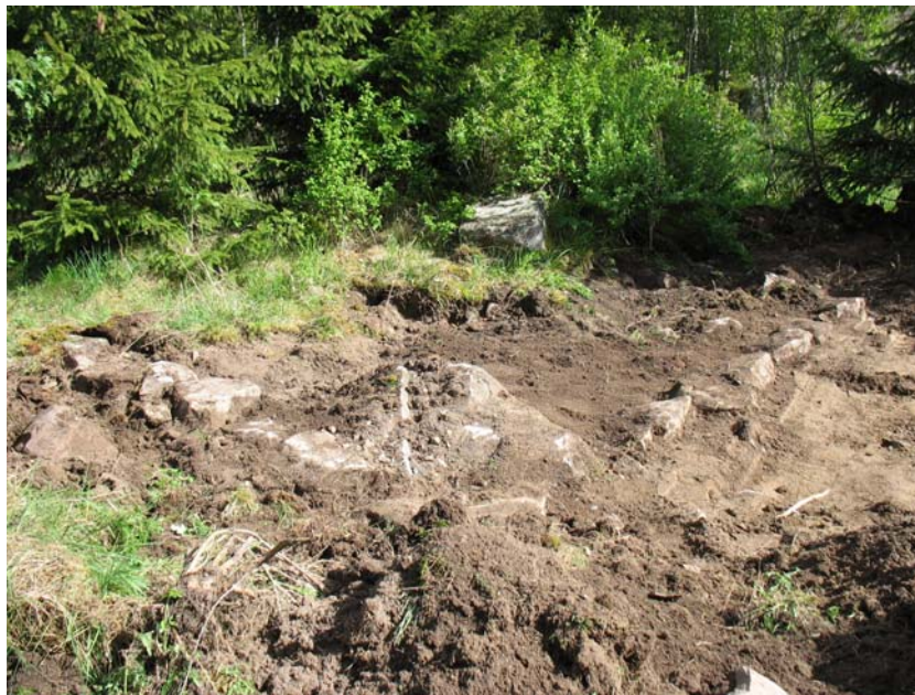
Foto 5. Det SV hörnet av husgrunden, objekt D . Foto från SV, J Ählström.

I de övriga schakten förekom det inte någon fornlämningsindikation.