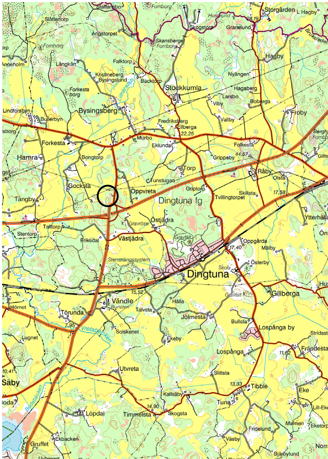
Figur 1. Utredningsrådets läge markerat med en ring. Utdrag ur Gröna kartan, blad 11G SO Västerås. Skala 1:50 000.

Kartor ur allmänt kartmaterial © Lantmäteriet Gävle. Ärende nr MS2006/01407.