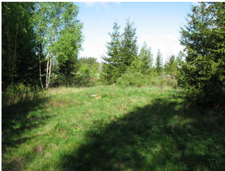
Foto 2. Vy över den centrala delen. Husgrunden påträffades vid granarna i höger bildkant. Foto från Ö, J Ählström.

höglänta marken låg delvis inom utredningsområdet. Markområdet ligger 20-25 meter över havet och jordarten består av silt och lera samt morän i den höglänta marken.