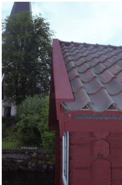
Figur 10. Taket omtäckt och nya överliggare i trä har monterats.