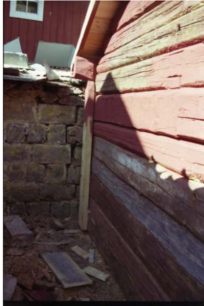
Figur 8. Södra gaveln från utsidan under pågående renovering.