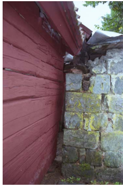
Figur 12. Skorsten med delvis äldre beslag samt omtäcket tak. Foto: Anders Eriksson, VLM 104021:8.