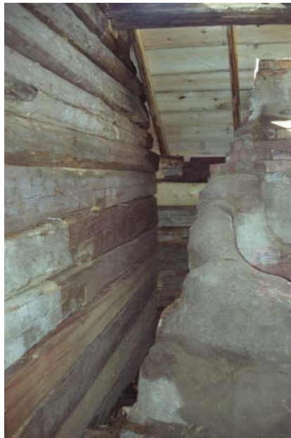
Figur 6. Den kalvande gaveln har rätats upp och skarvats i med friskt virke mot knuten. Jämför figur 3.