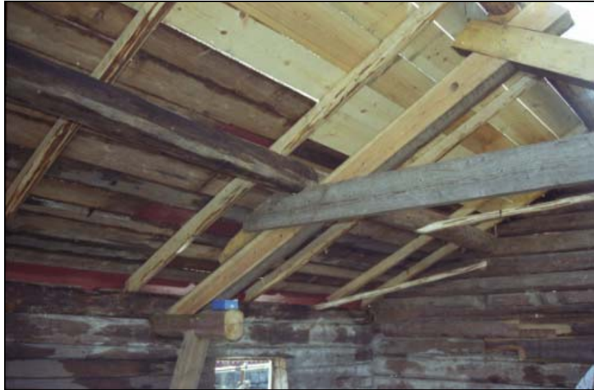
Figur 5. Undertaket lades om till stora delar men i viss mån kunde det gamla virket återanvändas. Även flera takstolar fick göras om helt. Foto: Anders Eriksson, VLM 104000:05.