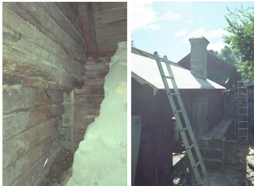
Figur 3. Den sydvästra hörnknuten på tvättstugan glipade före renoweringen på grund av den kraftiga kalvningen i timmerväggen. Till höger i bild murstocken. Foto: Anders Eriksson, VLM 103984:25.