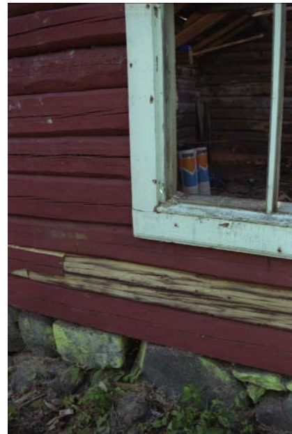
Figur 9. Timmerlagning under fönster på norra gaveln.