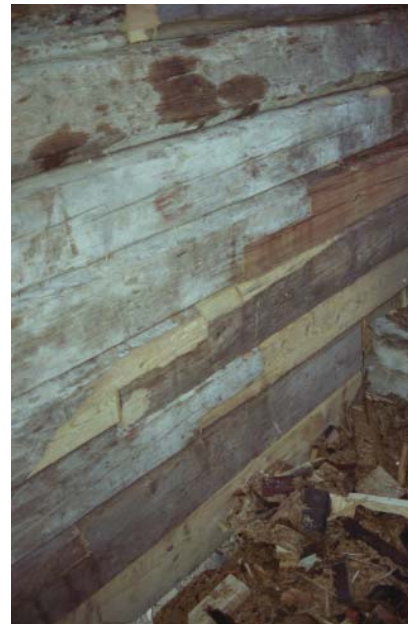
Figur 7. Skarvar i timret på den upprätade gaveln. Foto: Anders Eriksson, VLM 104000:4.