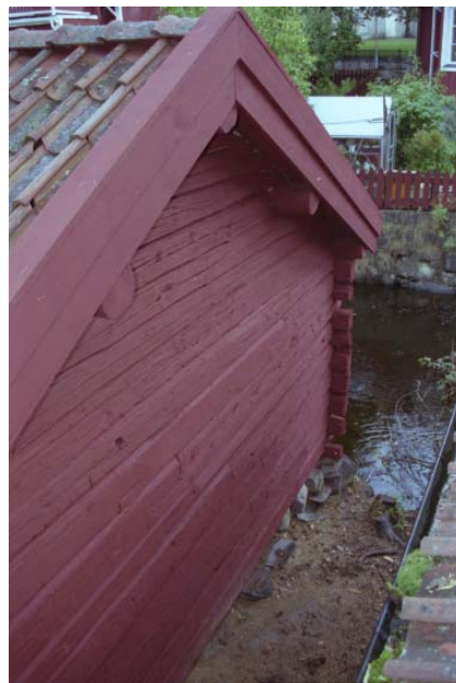
Figur 11. Södra gaveln är åtgärdad och upprättad. Foto: Anders Eriksson, VLM 104021:7.