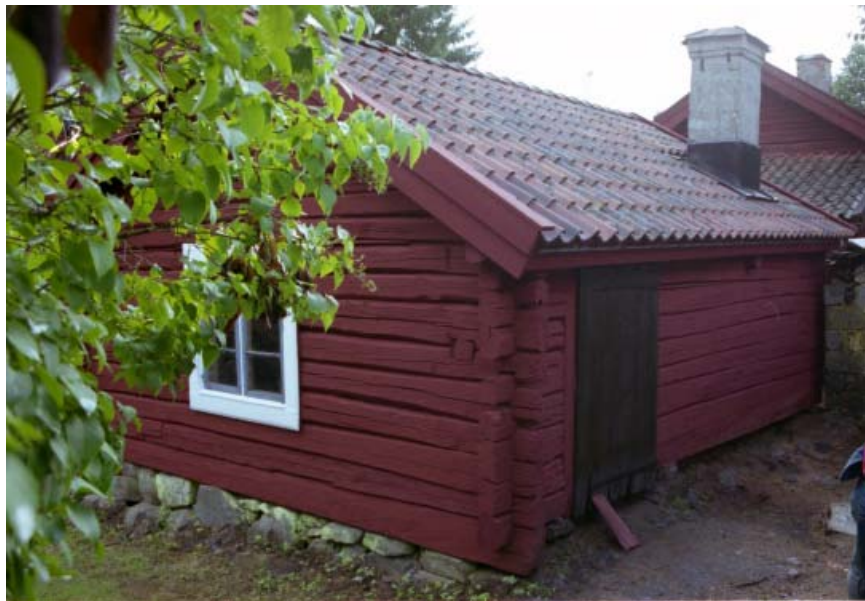
Figur 14. Tvättstugan efter renovering.