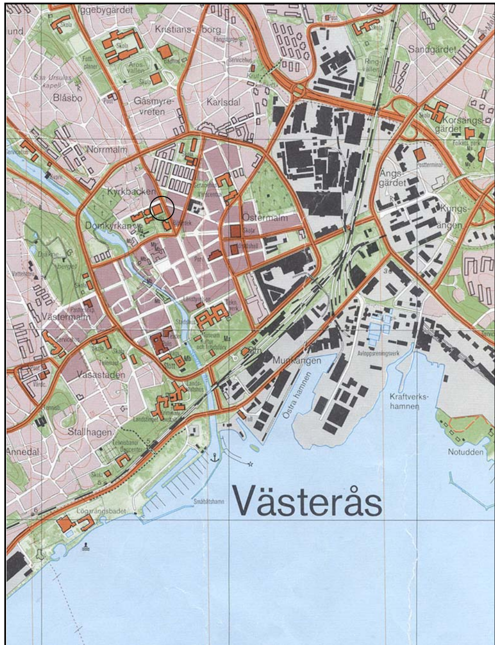
Figur 3. Undersökningsplatsens läge markerat med en ring. Utdrag urekonomiska kartan. Skala 1:10 000.

Kartor ur allmänt kartmaterial © Lantmäteriet Gävle. Ärende nr MS2006/01407.