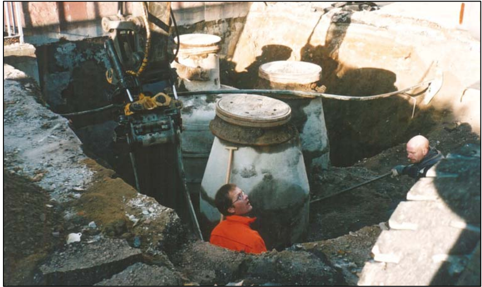
Figur 2. Schaktet vid Rudbeckianska skolan med flera brunnar, kablar och rör.