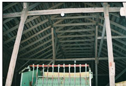
Stolperverkskonstruktionen i hus 29