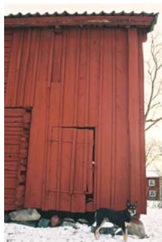
Panelbräda på en del av hus 9

Många panelbrädor har troligen varit sågade på Årnebo sågs enbladiga ramsåg. Enligt skriftlig uppgift har också en kransåg funnits på gården.