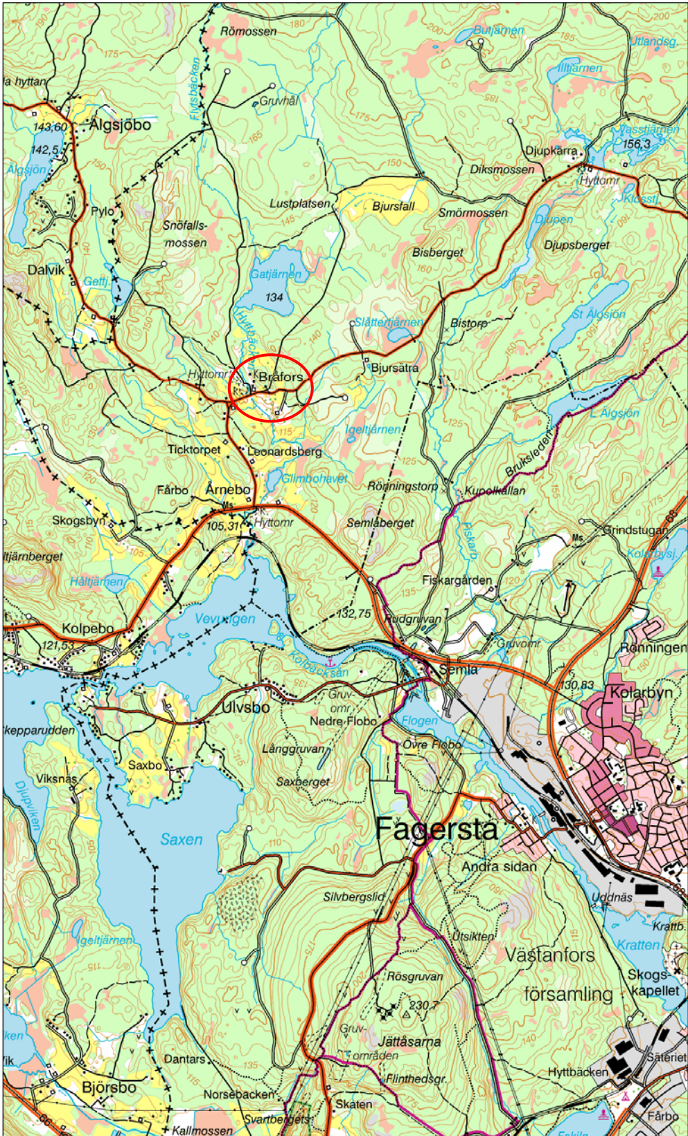
Figur 1. Bräfors läge, markerat med en ring. Utdrag ur digitala Gröna kartan. Skala 1:50 000.