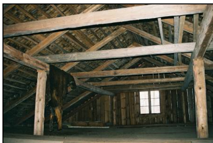
Stolperverkskonstruktionen i hus 16, vinden

"De längsgående stockarna som stödjer hanbjälkarna kallas "slag" och stolpar uppbär slagen. Gavelstolparna står på grundstenar och de andra stolparna inne i huset stöds i sin nedre ände i tvärband av timmer som förenar syllarna med varandra. Ryggås finns ej. För varje stolpar inne i huset är en tvärstock (tvärslag) intimrad i de båda yttre hammarbanden, dels för att hålla dessa stadigt i sitt läge och dels för att göra samma tjänst som åt stolparna. De är säkert fästade vid stockarna genom skruvar och muttrar. På övre delen av stolparna d v s den del som är ovanför tvärslagen är snedsträvor sitter snedsträvor som stödjer stolparna i husets längdriktning".