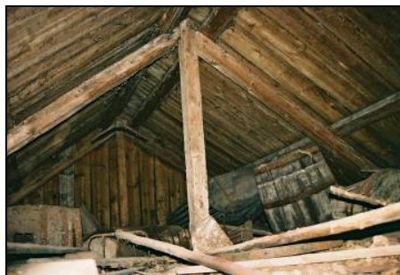
Mesulakonstruktion, vinden hus 19

Stolperverksbyggnad nr 29 och 16 beskrivs på följande sätt: