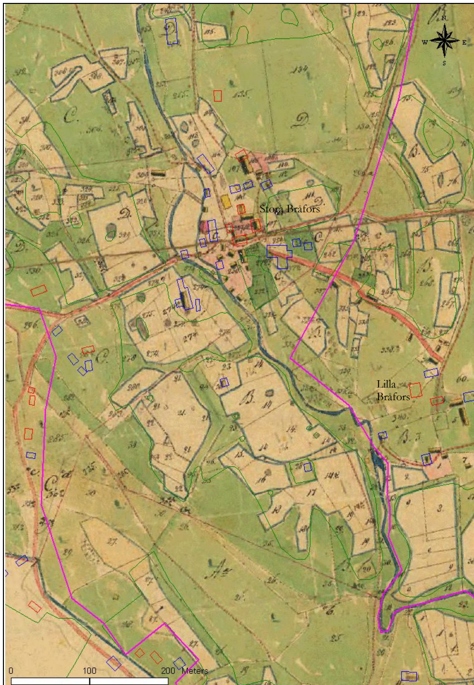
Figur 2. Kartöverlägg. Bakgrunden är den karta som upprättades vid laga skifte mellan åren 1830-1845. I kartan finns dagens bebyggelse inlagd, blå och röda markeringar, och den lila markeringen utgör gränsen för kulturresevatet.