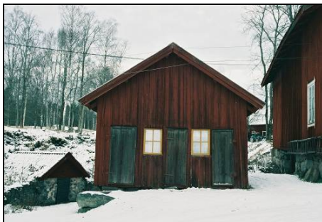
Dasset, hus 19

"Stolparna står på grundstenar och uppbära en takstol utan hanbjälke. Mittstolpen uppbärnocken och de båda sidostolparna var sitt takfall. I stolparna är hak inbyggna som passa mot takstolsbjälken och förenade med denna genom dymlingar. När huset byggdes restes först de tre stolpraderna och på dem anbringades takstolen som fästes med dymlingar. Så påspikades spikreglar mellan stolparna och hela huset inkläddes med en stående brädfodring. Som underlag för taket påspikades även spikreglar mellan de tre takstolarna och på dessa lades brädor. Stolparna hålles i sitt läge genom snedsträvor".