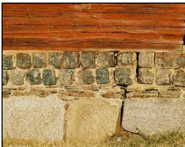
Del av grunden är murad med slaggtegel, hus 23

Angående förekommande tak nämns följande taklag: Näver-, bräd-, pert-, halm-, tegel- och plåttak. Bräddtakens brädor var försedda med hyvlade spår ca 1 tum från kanten i de undre bräddorna, sk vattenspår. Det första takteglat som lades i Bråfors kom från Viksnäs och Kvarnsnäs i Söderbärke socken. Senare taktegel kom från Sala, Heby och Kolbäck.