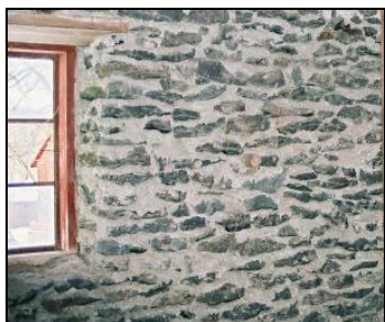
"Sinder", hus 22, invändigt

I Bråfors hytta göt man slaggtegel eller "slaggostar" av dimensionen 9 x 9 x 18 tum. Slaggtegel av den storleken är ett vanligt byggnadsämne på gården. Så kallad "sinder", oregelbunden skivformad slagg, användes som byggnadsämne till den vita ladugården, hus nr 22. Det var bättre än gjutet slaggtegel ur fukt och värmesynpunkt. Dessutom billigare för det fick hämtas gratis på varparna och förekommer säkerligen i fler byggnader i trakten.