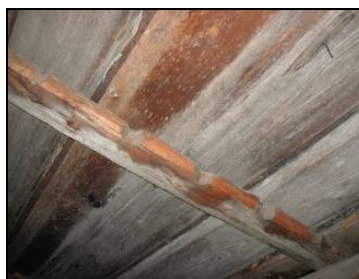
Mullbräda återanvänd som taksparre på vinden, hus 12