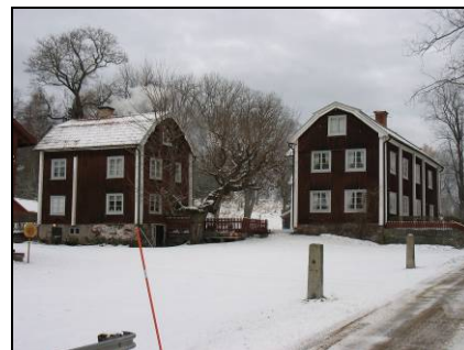
Fotot överst är taget från öster, nedre fotot från sydväst