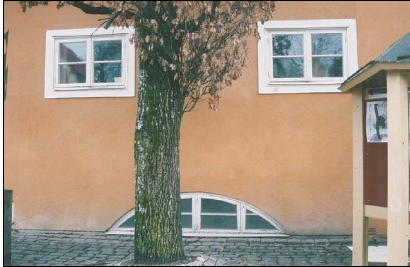
Figur 3. De två fönstren i bottenvåningen har försetts med klarglas.