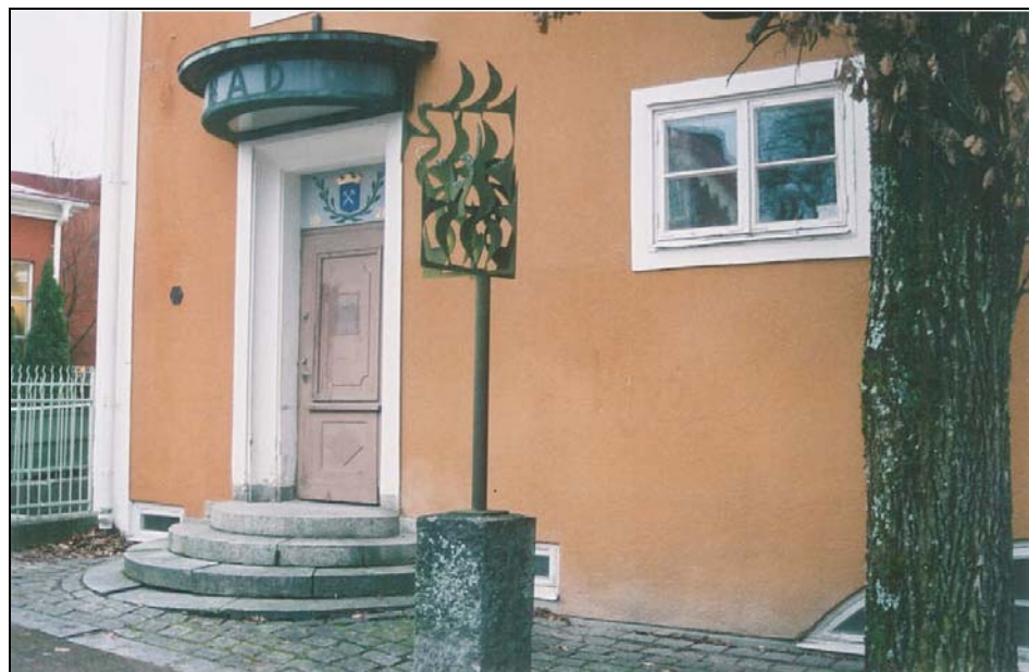
Figur 2. Entré till badhuset.

Indragningen av fjärrkyla genomfördes inte då beräkningar visade att den lokal man tänkt sig använda för undervisningsändamål inte uppfyllde kraven på ventilation. Åtgärderna skulle då blivit betydligt mer omfattande och planerna ändrades.