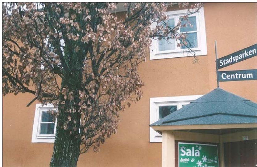
Figur 5. Det övre fönstret till böger har ej fått glaset utbytt.