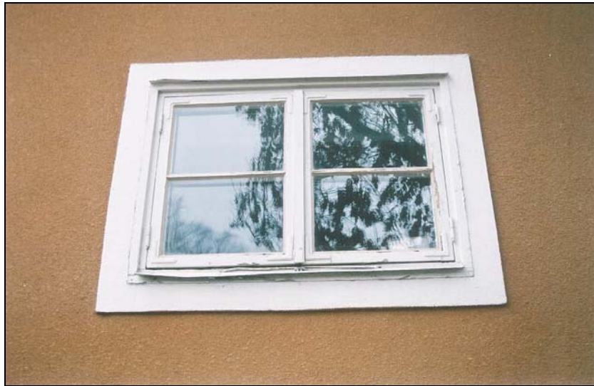
Figur 4. Fönstren har kittats om men ej målats om.