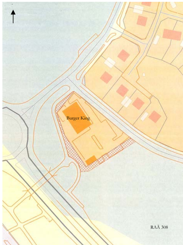
Figur 2. Utredningsområdet rasterat. Läget för fornlämning RAÄ 308 är ungefärligen angivet. Utdrag ur beslutsbilaga. Skala 1:2000.