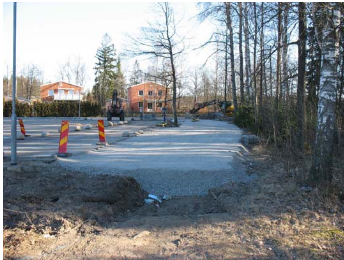
Figur 3. Vy över den SÖ delen av utredningsområdet med den ny-anlagda vägen. Foto från SV, J. Åhlström.