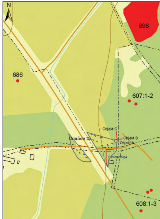
Figur 8. Område 2a, schakt och de närmast liggande forn- lämningarna samt de nypåträffade odlingslämningarna. Utdrag ur den digitala fastighetskartan. Skala 1:5000.