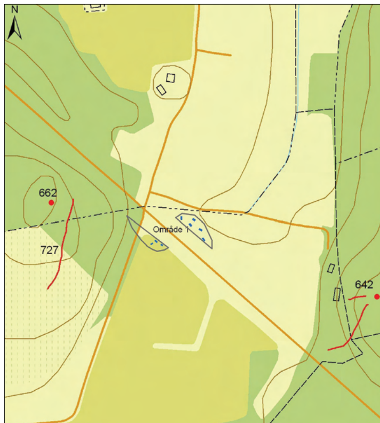
Figur 7. Område 1, schakt och de närmast liggande fornlämningarna. Utdrag ur digitala fastighetskartan. Skala 1:5 000.