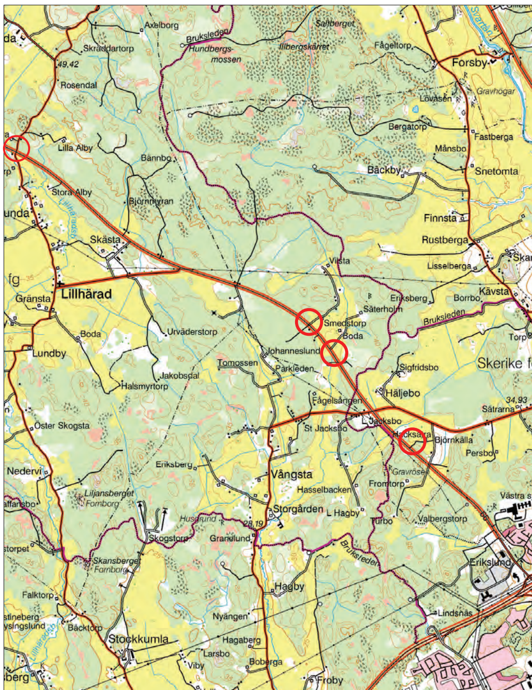
Figur 4. Utredningsområdena markerade med ringar (område 3 i NV och område 1 i SÖ). Utdrag ur den digitala gröna kartan, blad 11G SO Västerås. Skala 1:50 000.

Kartor ur allmänt kartmaterial © Lantmäteriet Gävle. Ärende nr MS2006/01407.