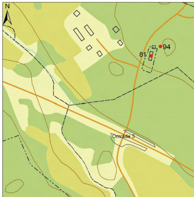
Figur 10. Område 2c med fornlämningarna markerade. Utdrag ur den digitala fastighetskartan. Skala 1:5000.