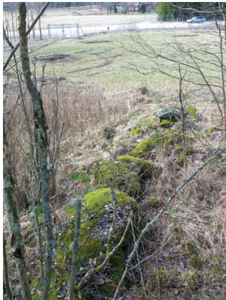
Figur 2. Den västra delen av stensträngen objekt B. Foto fr Ö J. Åhlström.

På den nordöstra sidan av vägen sammanfaller områdesgränsen med ett odlingsröse (objekt A). Röset är flackt, delvis övertorvat, 4 meter stort och runt. Det består av 0,3–0,5 meter stora stenar. Cirka 4–5 meter norr om röset ligger en stensträng (objekt B). Stensträngen är 17 meter lång (Ö-V), 0,5 meter bred och 0,2–0,5 meter hög. Den är en- och flerradig samt enskiktad. Det ingår ett stort block i stensträngen och dess östra del är nedsjunken. Till det stora blocket ansluter ytterligare en stensträng (objekt C). Stensträngen är 20 meter lång (N-S), 2 meter bred och 0,5 meter hög. Den är flerradig och flerskiktad. Stenarna är övermossade och 0,5–0,8 meter stora. I omgivningarna finns ytterligare ansamlad odlingssten i mur och sträng (utmed åkerkanterna och runt en befintlig sommarstuga) samt i röse. Eftersom det finns ett tydligt samband mellan merparten av lämningarna och övergången mellan skog och åker är de troligtvis sentida. På häradsekonomen är sambandet tydligt. Den något kortare av stensträngarna, objekt B, avviker dock härvidlag genom riktningen. Den strävar in mot skogen istället för att löpa utmed åkerkanten. Således kan denna stensträng avspegla ett äldre skede av uppodling än vad de övriga lämningarna gör.