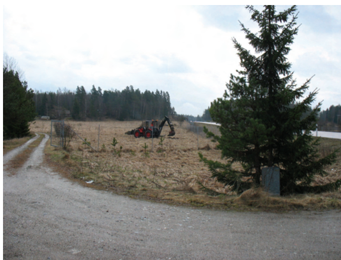
Figur 1. Vy över den NÖ delen av område 1. Foto fr NV J. Åhlström.

Området omfattar två ytor på ömse sidor av vägen. Ungefär halva ytan sydväst om vägen utgick på grund av att maskinen inte kom fram. Området ligger omkring 30 m.ö.h. och det är halvt om halvt att betrakta som ett utmarksläge även om härads-ekonomen redovisar marken som uppodlad. Fornlämningsbilden runt lokalen är gles (se figur 6 och 7 samt tabell 1).