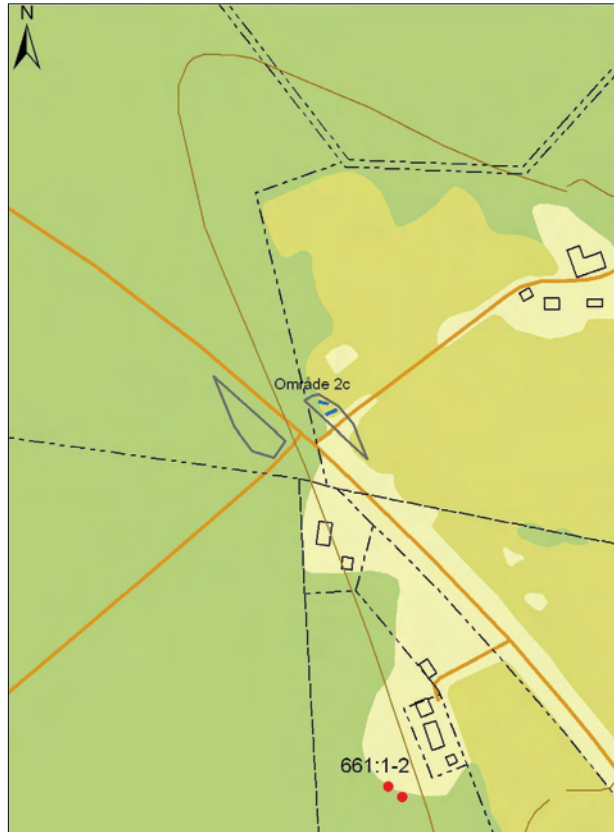
Figur 9. Område 2c, schakt och de närmast liggande fornlämningarna. Utdrag ur den digitala fastighetskartan. Skala 1:5000.