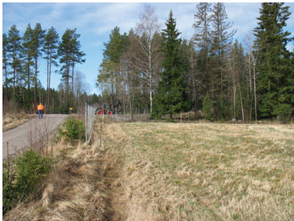
Figur 3. Vy över den NÖ delen av område 3c, där schakten grävdes.