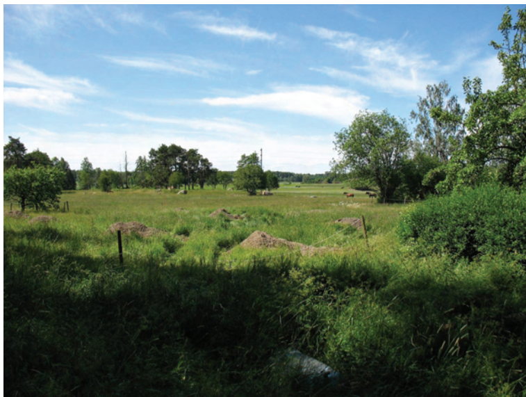
Figur 3. Utredningsområdet från NNÖ, från den planerade nya vägen.

Kartstudien visar att platsen inte har varit bebyggd vare sig vid tiden för karteringarna i samband med storskiftet 1776 eller det laga skiftet 1854 (se bilaga 1–2). Om stensamlingen och den rödbrända ytan med tegel är bebyggelseanknutna är den av mycket sent datum och betraktas inte som fornlämning.