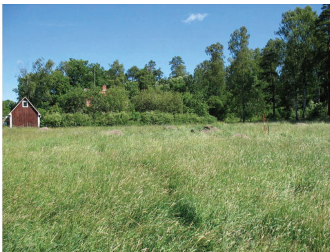
Figur 2. Utredningsområdet från SSV.

KM utarbetade en undersökningsplan som inkom till länsstyrelsen den 18 juni 2008 varefter länsstyrelsen fattade beslut den 23 samma månad (1st dnr 431-6273-08). Länsstyrelsen bekostade utredningen med medel ur anslaget 28:25/2008, insatsområde 8, åtgärdsstyp 8.1 . Fältarbetet utfördes under en dag i juni 2008. Jan Ählström ansvarade för utredningen och rapporten.