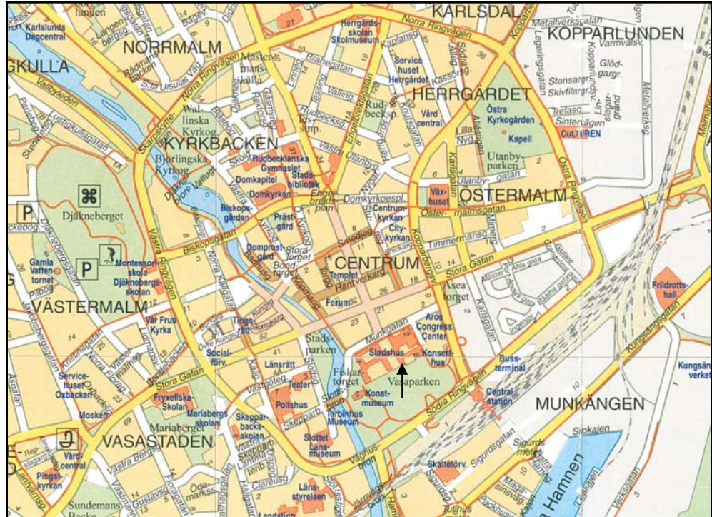
Figur 2. Undersökningsplatsens läge markerat med en pil. Utdrag ur Västeråskartan 2006. Skala 1:15 000.

Kartor ur allmänt kartmaterial © Lantmäteriet Gävle. Ärende nr MS2006/01407.