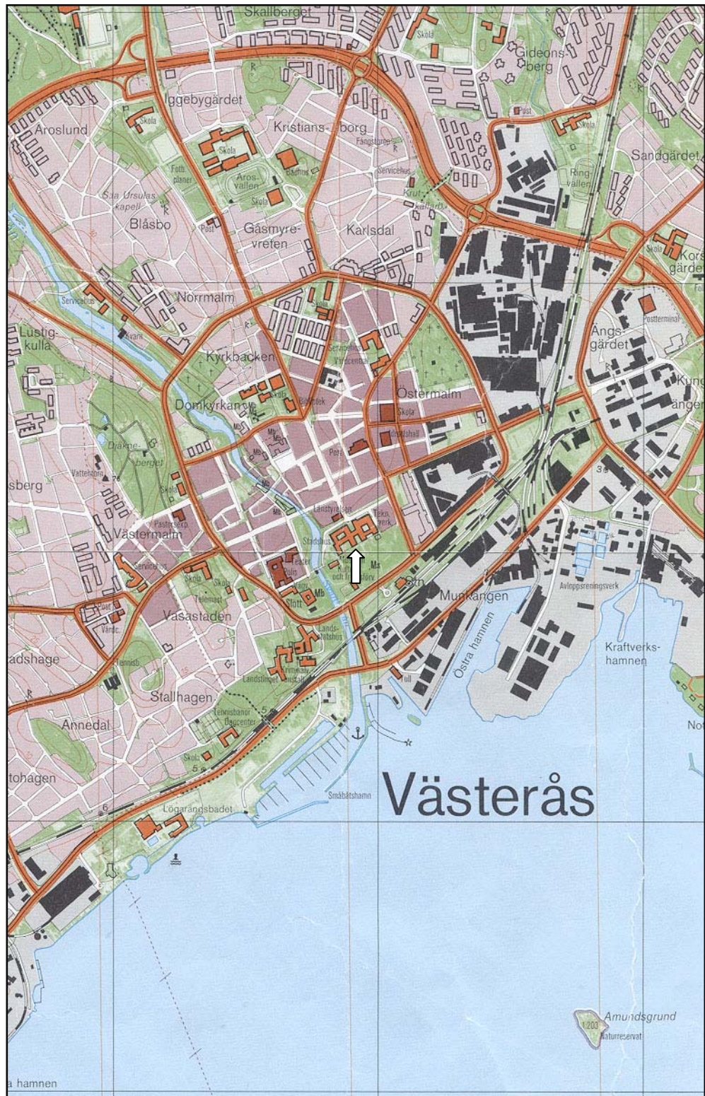
Figur 3. Undersökningsområdet markerat med en pil. Ekonomiska kartan. Skala 1:20 000.