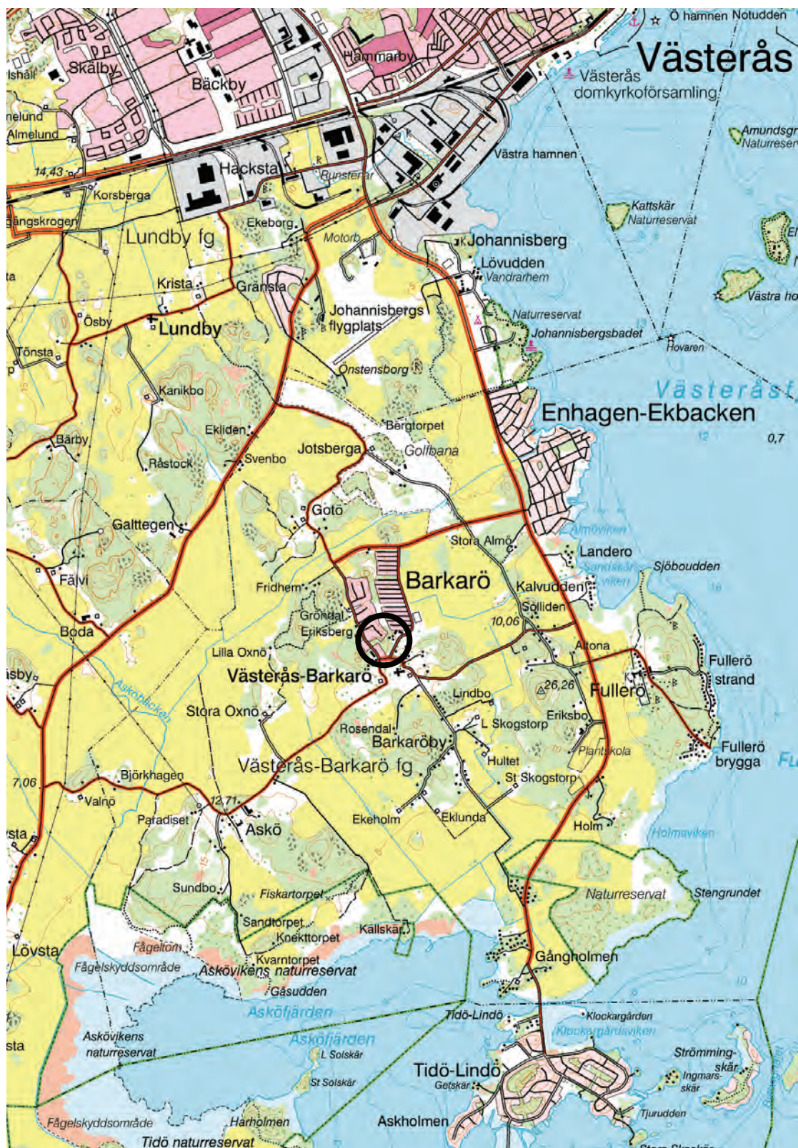
Figur 1. Utredningsområdets läge, markerat med en ring. Utdrag ur Gröna kartan, blad 11G SO Västerås. Skala 1:50 000.