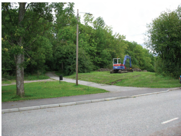
Figur 8. Den södra stora gräsbevuxna ytan. Observera nivåskillnaden mellan cykelvägen och gräsytan där maskinen står. Skillnaden beror på de påförda massorna.

I skogen utmed cykelvägen grävdes fyra glesliggande schakt om totalt 21 m 2 (se figur 7). Schakten var 2–4 meter långa och de grävdes 0,1–0,3 meter djupa ner till orörd stenbemängd morän. I ett av schakten påträffades en härd. Härden var synlig som en gles samling av ungefär knyträvsstora och eldpåverkade stenar som sammanföll med en blek mörkfärgning. Härden var 0,5 x 0,4 meter stor. Härden är fornlämningsindikerande men med tanke på de få och glesliggande schakten som kunde grävas är det svårt att säga vad den indikerar, om det är en boplats eller någon slags aktivitetsyta.