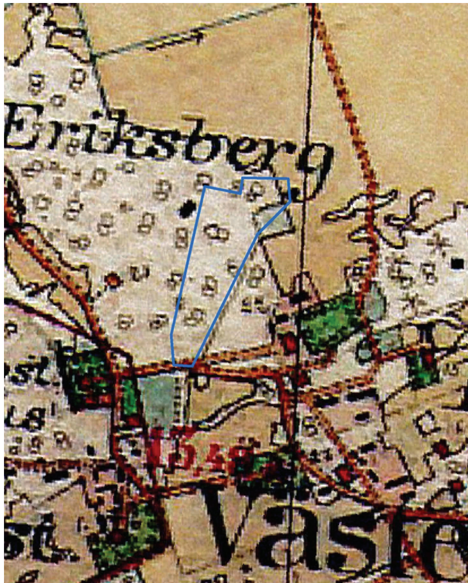
Figur 5. Utdrag ur Häradskartan, blad Västerås, 1905-11. Utredningsområdet är markerat. Skala 1:5 000.