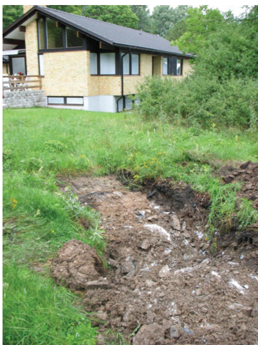
Figur 9. Det NV schaktet i den lilla gräsbevuxna ytan. Schaktet berörde ett kompakt lager med sprängsten som bl a kommer från bygget av huset i bild. Foto från SÖ J. Åhlström.

Parallellt med stensträngen som påträffades vid inventeringen grävdes ett 10 meter långt schakt (se figur 7). Schaktet grävdes 0,1–0,3 meter djupt ner till den orörda steniga moränen. Ungefär mitt i schaktet framkom stenar vilka ligger i nästan rät vinkel med stensträngen och som nordväst om schaktet tycks sammanfalla med i markytan synliga större stenar. Det är därmed troligt att stensträngen har en till stor del övertorvad nordvästlig utlöpa. Den del av utlöpan som framkom i schaktet utgörs av 0,2–0,5 meter stora stenar och den framstår som flerradig och flerskiktad.