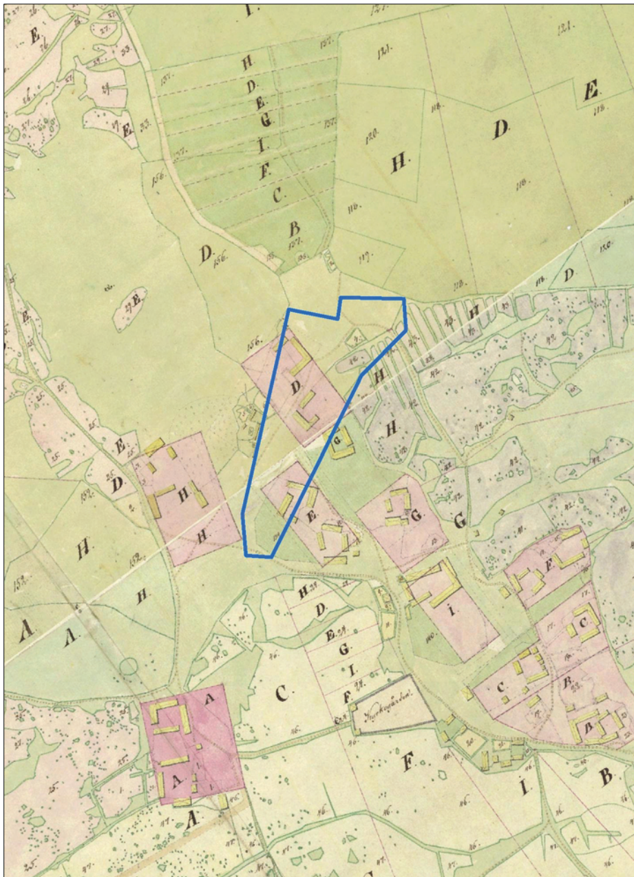
Figur 4. Utsnitt ur 1801 års Storskifteskarta över Barkaröby med utredningsområdet markerat. Skala 1:5 000.

I närområdet ligger i övrigt både historiska och förhistoriska lämningar (se figur 2). Inom en radie på 300 m från utredningsområdet finns husgrunder (fornlämning RAÄ 70, Västerås-Barkarö), lämningar av en bytomt, (fornlämning RAÄ 36, Västerås-Barkarö) och en backstuga (fornlämning RAÄ 44, Västerås-Barkarö), samt en kvarnlämning (fornlämning RAÄ 38, Västerås-Barkarö) och olika vägmärken (fornlämning RAÄ 25:1-2, 65:1, Västerås-Barkarö).