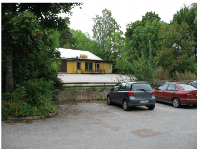
Figur 6. Vy från SÖ över utredningsområdets norra planerade del. Huset i bild hyste tidigare ICA-butiken Barken.

Husterrassen är 3 meter lång (NNÖ-SSV) och den försvinner under de påförda massorna. I markytan är flera syllstenar synliga. Möjligen kan terrassen motsvara det torp som enligt 1691 års karta sammanfaller med utredningsområdets sydvästra gräns.