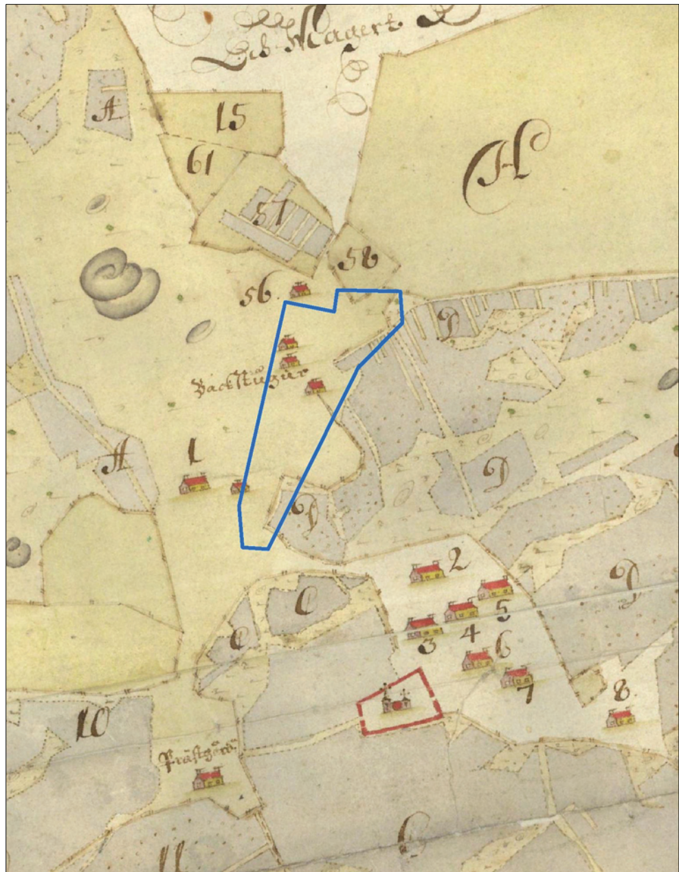
Figur 3. Utsnitt ur 1691 års avmätning av Barkaröby med utredningsområdet markerat. Skala 1:5 000.

det tre backstugor och ytterligare torp eller backstugor på gränsen till området i sydväst och i norr. Enligt 1801 års storskifteskarta ser det ut som om gårdarna har förskjutits något mot norr under 1700-talets lopp. Backstugorna längst i norr försvinner under samma period (se figur 3–4). Under 1800-tal sker också stora förändringar vilka medför att gårdsbebyggelsen försvinner från utredningsområdet (se figur 5). Utredningsområdet har således gått från att mestadels vara ett skogsområde med sekundär bebyggelse via tomtmark för att återgå till att vara obebyggd skogsmark.