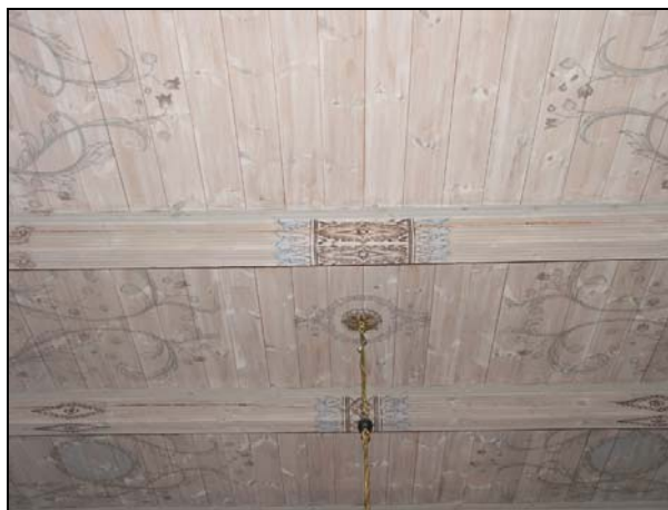
Figur 3. Taket i kyrkorummet.