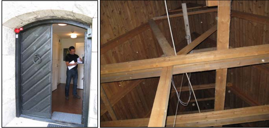
Figur 12. Ett blyxtljus och en klocka monterades vid källaringången innanför vilken larmcentralen placerades. Detta för att räddningstjänsten snabbt skall hitta centralen.