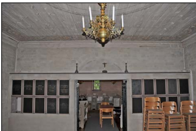
Figur 11. Placeringen av kabeldragningen är justerad av antikvariska hänsyn.