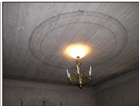
Figur 6. Taket i familjen Lagercrantz gravkapell.