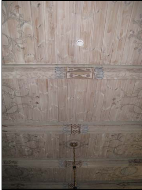
Figur 8. Placering av detektorer i kyrkorummets tak.