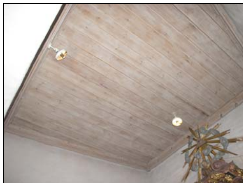
Figur 5. Taket i koret.