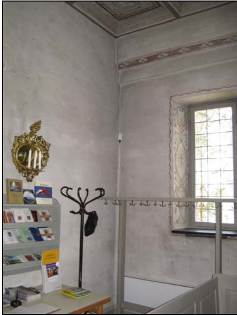
Figur 7. Rörelsedetektor i kyrkorummet.