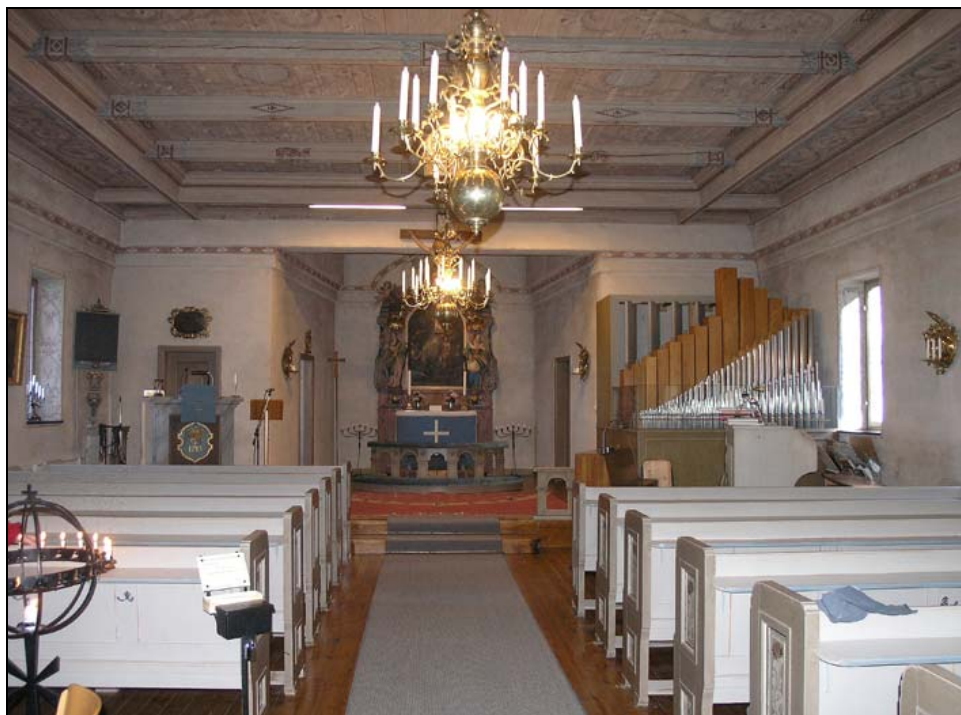
Figur 2. Översiktlig bild av kyrkorummet mot koret.