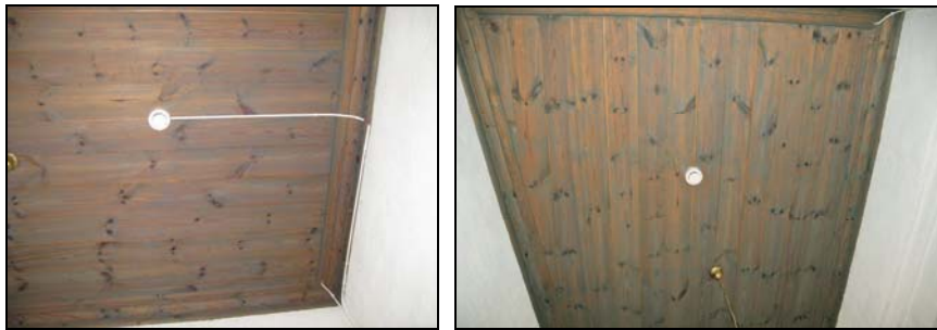
Figur 14 och 15. Branddetektor i sakristian. Kabeln målades in i bakgrundsfärg.