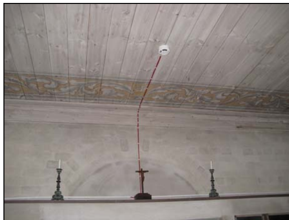
Figur 10. Placeringen av detektorn i Lagercrantz gravkor fick göras om då denna inte ansågs ta tillräckliga hänsyn.