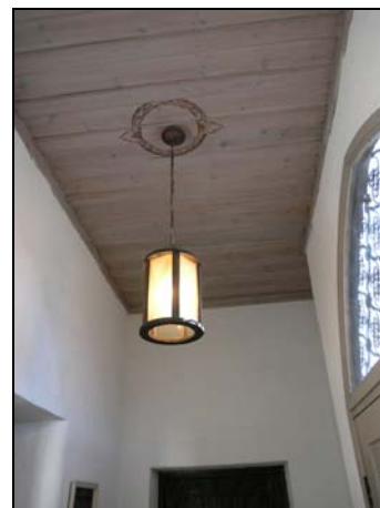
Figur 4. Taket i vapenhuset.