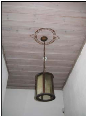
Figur 9. Vapenhusets tak med branddetektor.