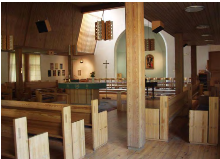
Figur 4. Inredningen som tillkom 1965.