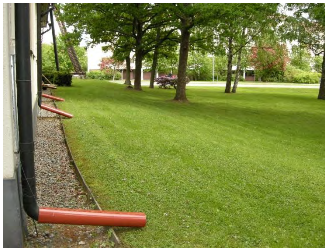
Figur 12. Tillfällig avvattningsföregång.