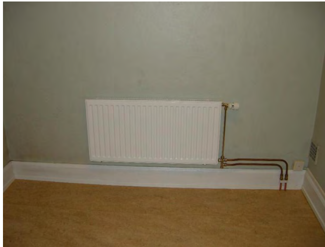
Figur 11. Ny radiator i förrådsrummet.