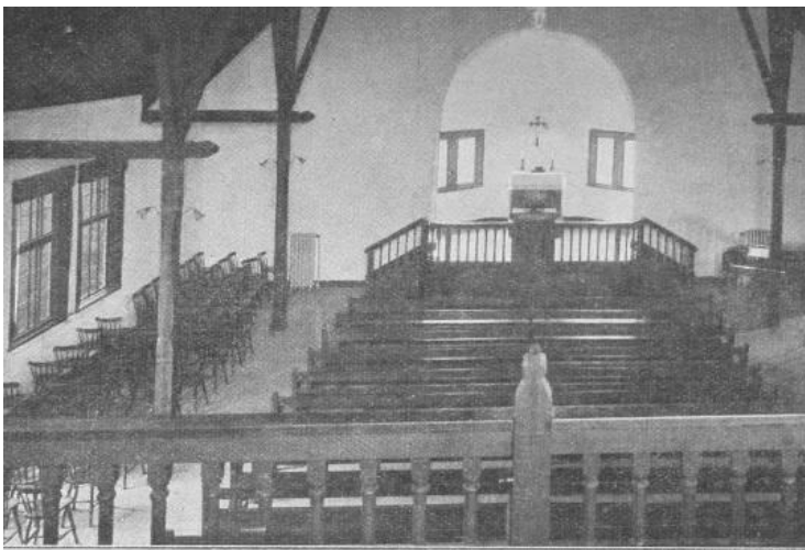
Figur 3. Den öppna mörkbetsade inredningen som fanns före 1941.

Efter 1960-talets genomgripande renovering har endast smärre förändringar gjorts. 1988 målades fönster och tak om och ett nytt dörrparti med brunoxiderad aluminium sattes in. 1997 drogs nya värmeledningar in och sakristian nyinreddes. 5