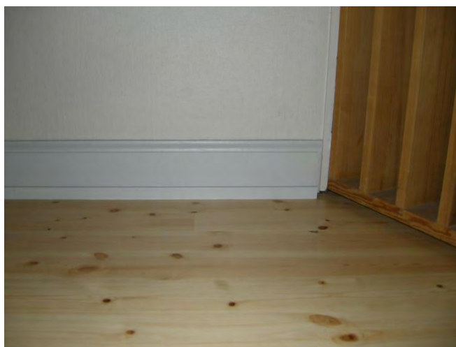
Figur 7. Smyglist mellan sockel och golv.