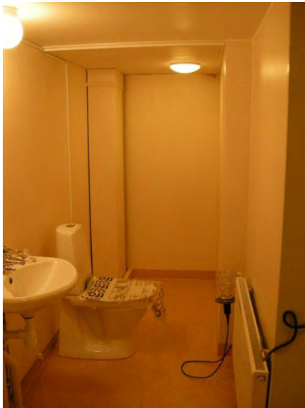
Figur 9. Toalettutrymme efter HC anpassning.