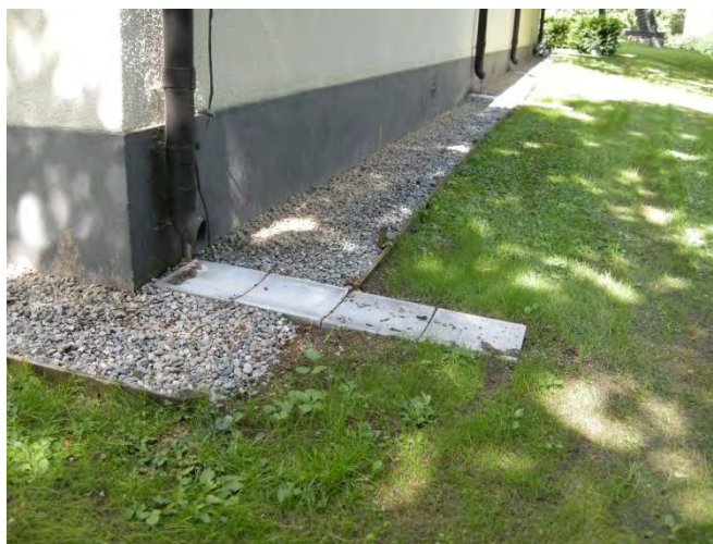
Figur 13. Avvattningsföregång med skålföregångade betongplattor efter åtgärd.