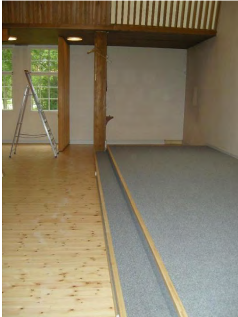
Figur 8. Ny matta i kordelen.