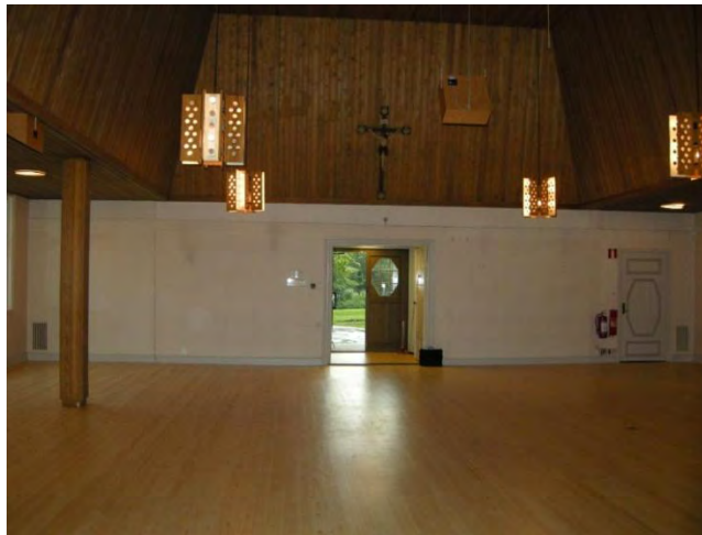
Figur 6. Nytt golv av furu som behandlats med klarlack.