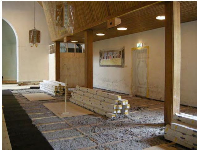
Figur 5. Nytt bjälklag med isolering av mineralull.