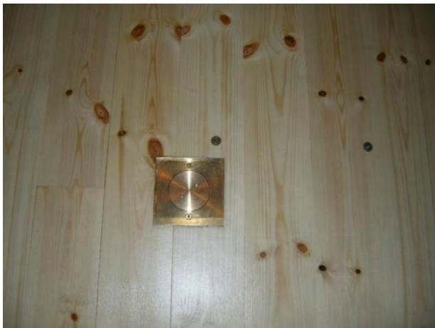
Figur 10. Eluttag i mässing infällda i det nya furugolvet.