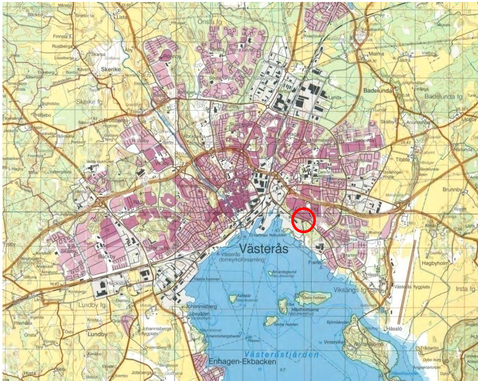
Figur 1. Viksängskyrkan markerad med en röd ring på gröna kartan. Skala 1:50 000