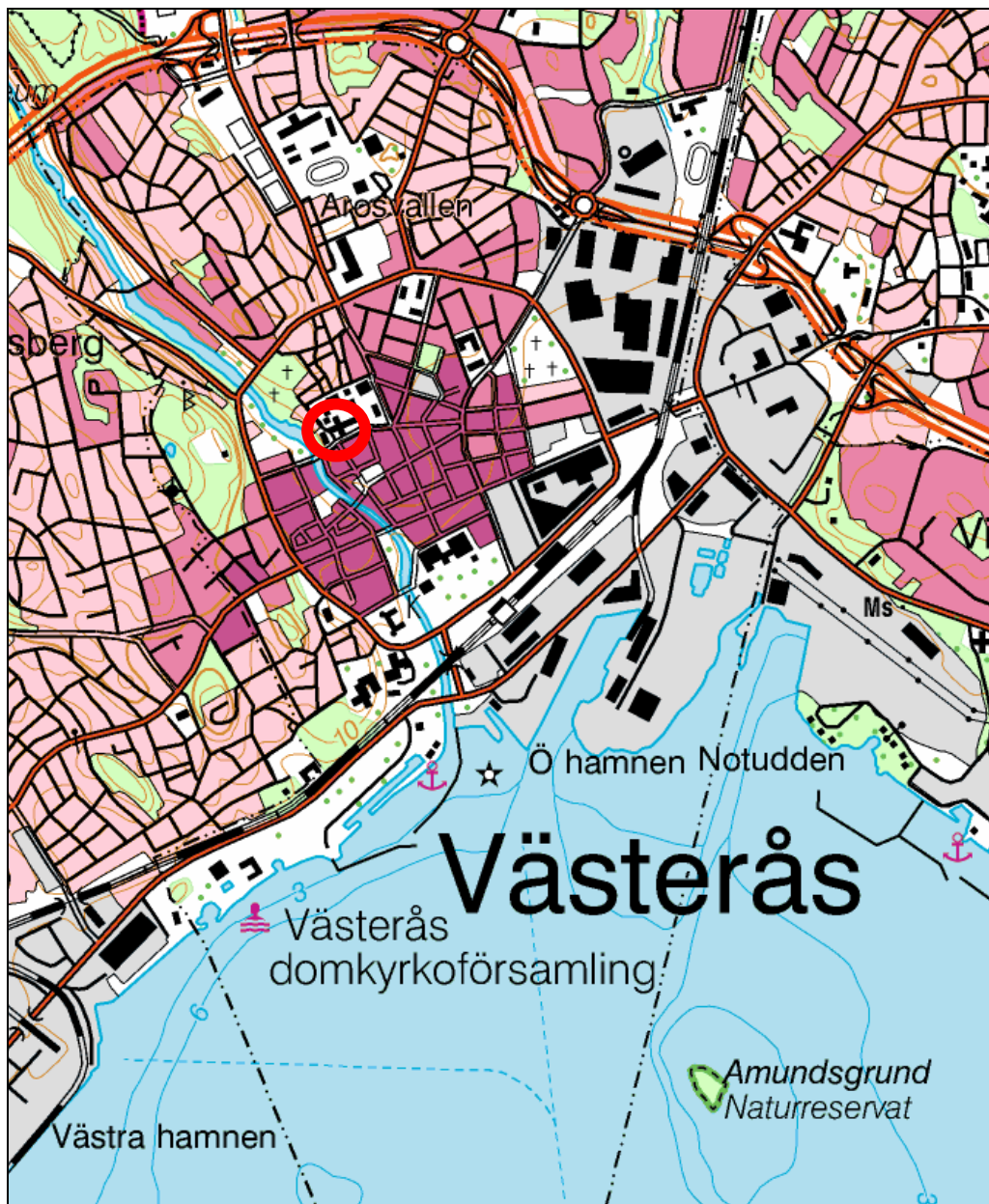
Figur 1. Biskopsgårdens och domkyrkans läge, markerat med en ring. Utdrag ur Gröna kartan. Skala 1:25 000.