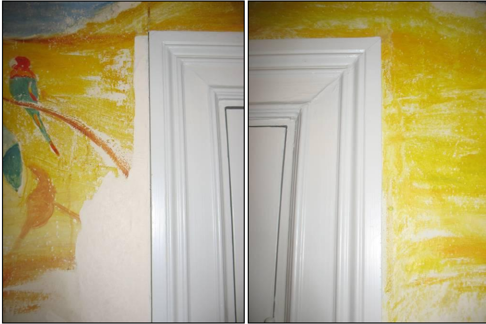
Figur 13. Dörrkarm mot öster, vänstra sidan, där den större lakunen ifylldes med bottenfärg medan små retuscheringar tilläts för att få en rak kant i det övre partiet.