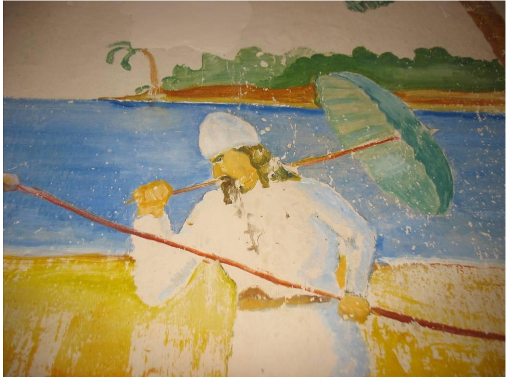
Figur 16. Robinson Crusoe efter konservering.