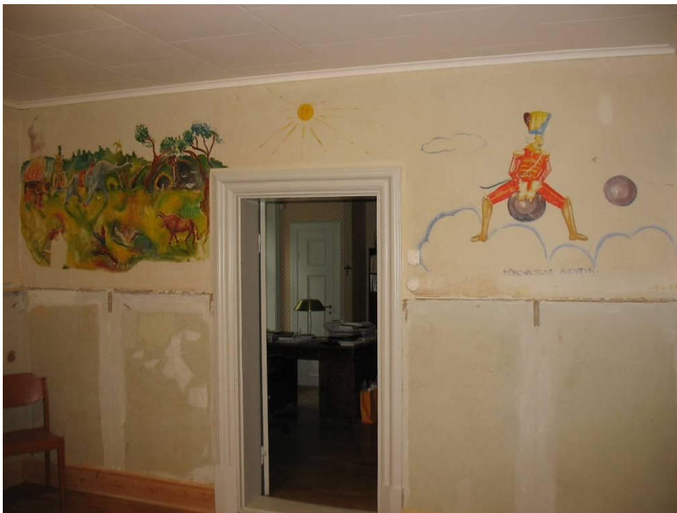
Figur 19. Baron von Münchhausen efter konservering.