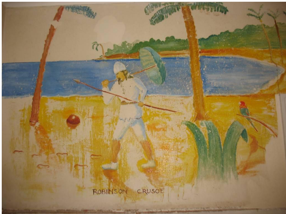
Figur 17. Robinson Crusoe efter konservering.