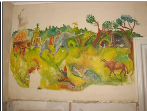
Figur 4. Målning föreställande Röde Orm .