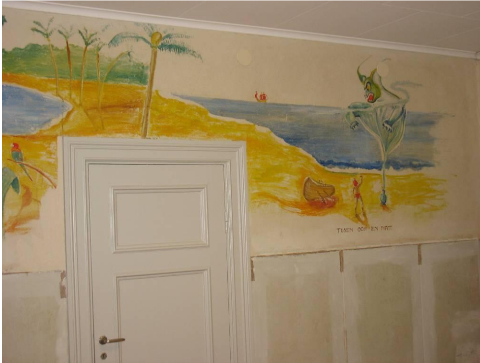
Figur 18. Tusen och en natt efter konservering.