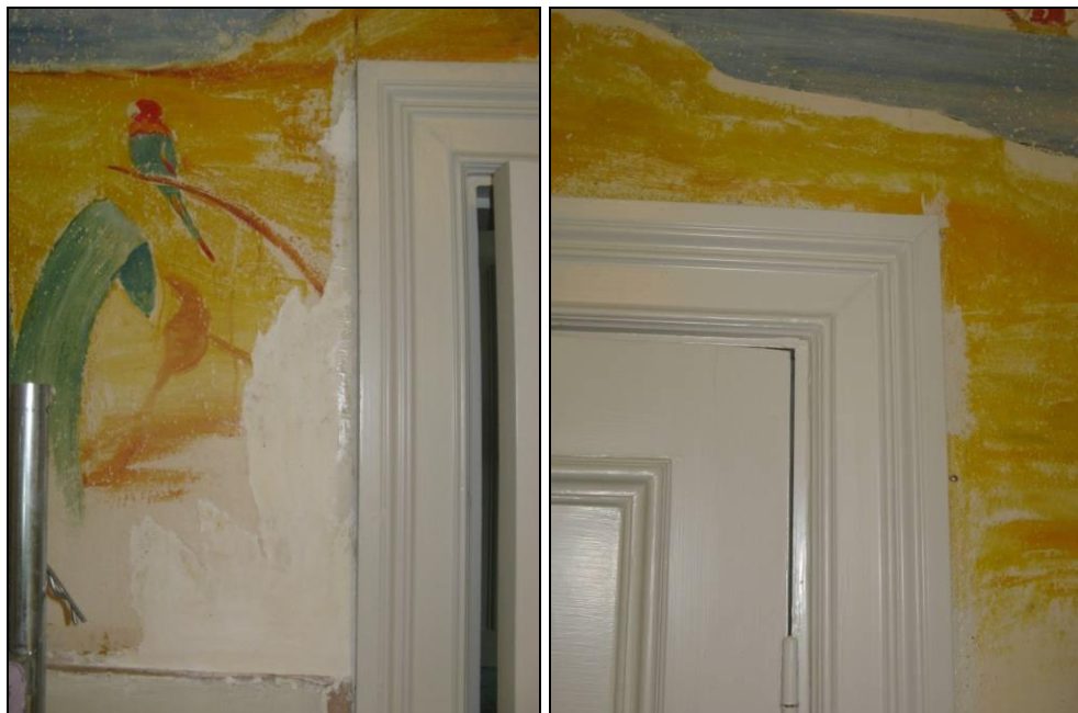
Figur 11. Dörrkarm mot öster, vänstra sidan, med en större lakun vid sidan av karmen.