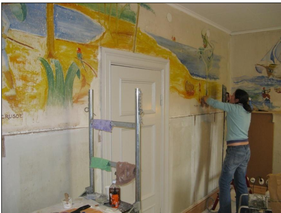
Figur 8. Pågående rengöring från tapetlim med hjälp av ånga.