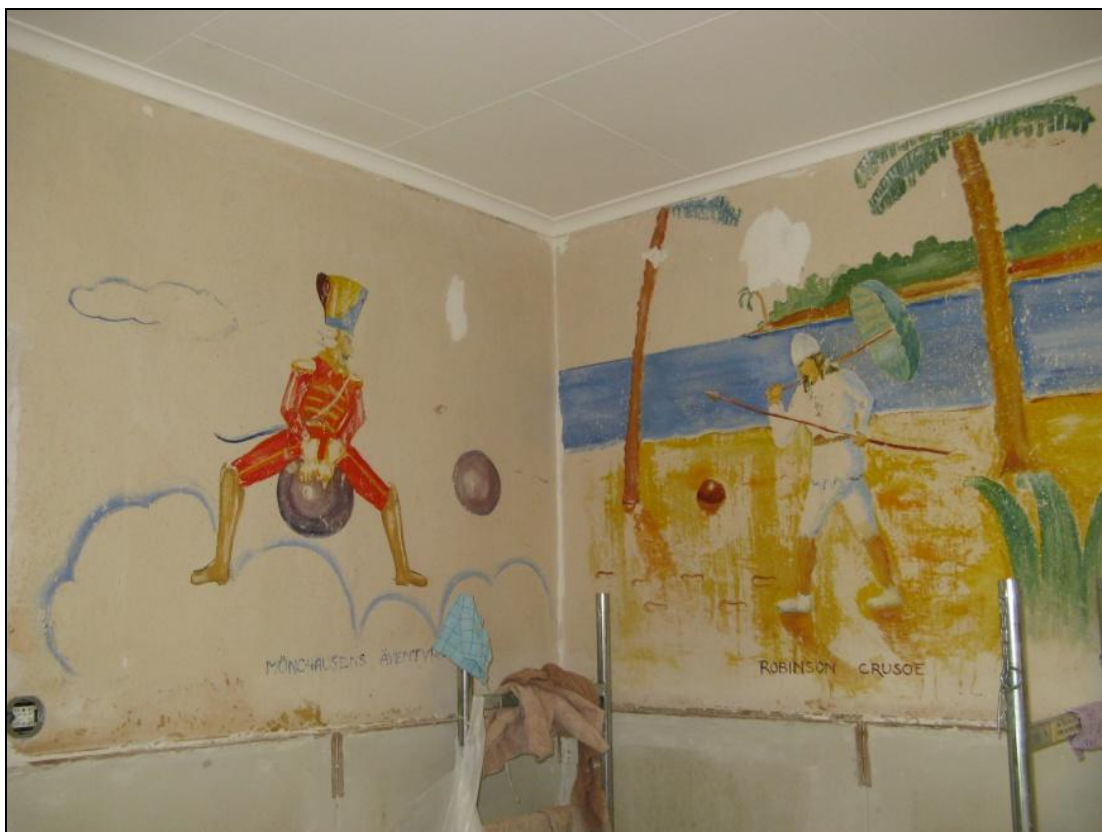
Figur 7. Ytliga skador har lagats med gips.