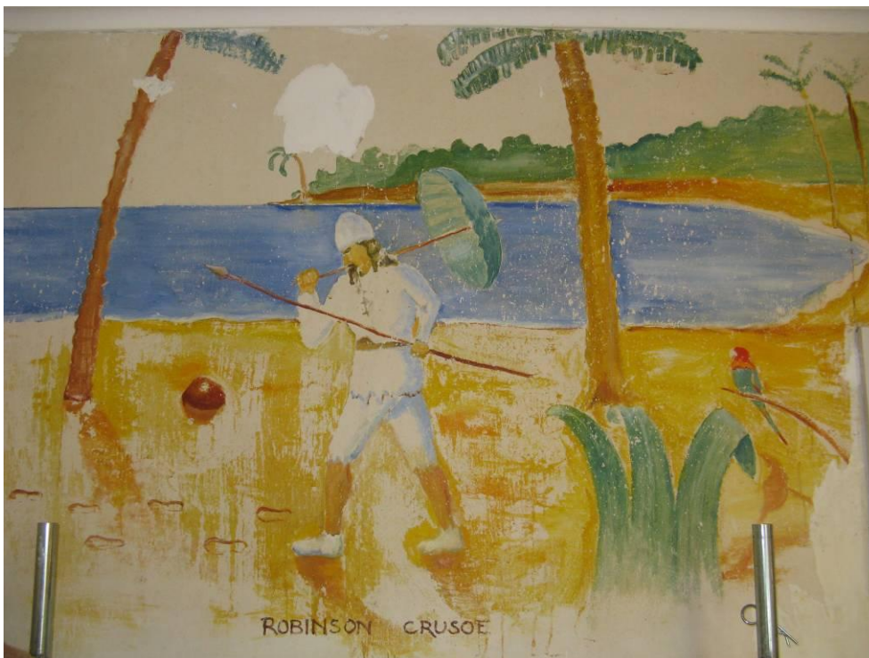
Figur 15. Robinson Crusoe före konsolidering och andra åtgärder.