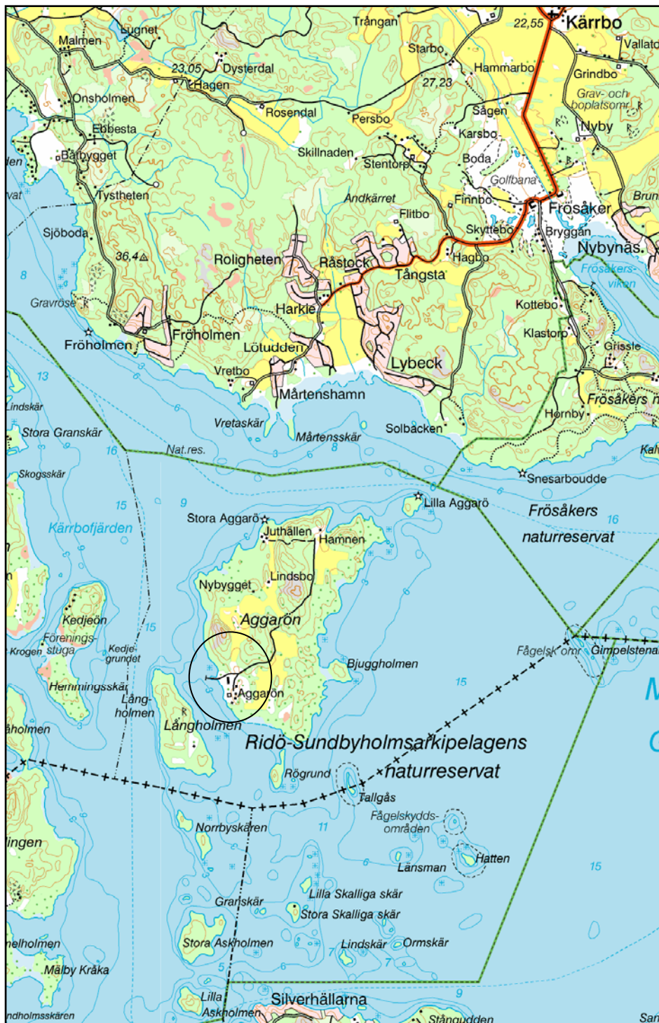
Figur 2. Undersökningsplatsens läge markerat med en ring. Utdrag ur Gröna kartan. Skala 1:50 000.

Kartor ur allmänt kartmaterial © Lantmäteriet Gävle. Ärende nr MS2006/01407.