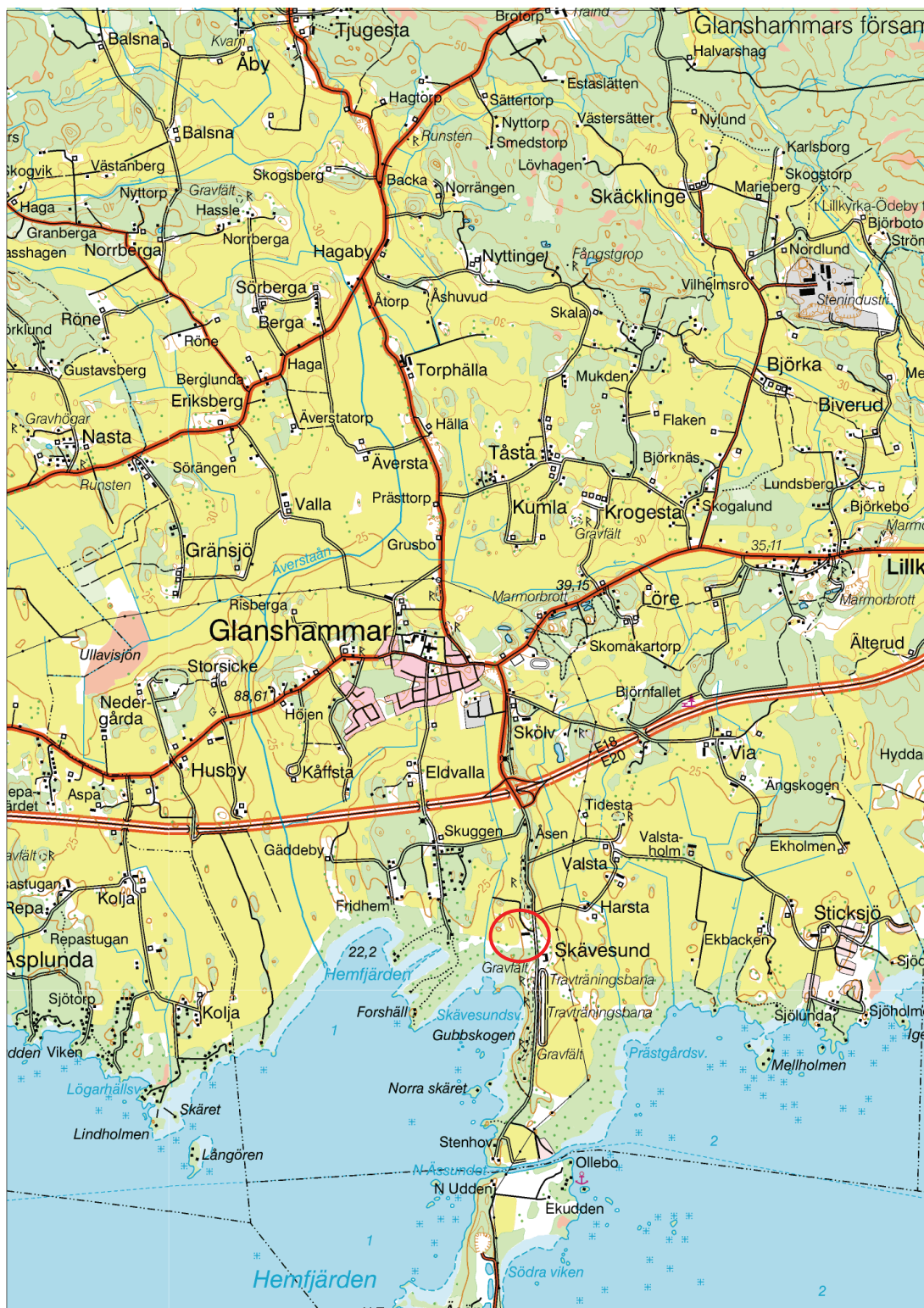
Figur 1. Utdrag ur Terrängkartan för Örebro län med undersökningsplatsens läge markerat med en ring. Skala 1:50 000.

Kartor ur allmänt kartmaterial © Lantmäteriet Gävle. Ärende nr MS2006/01407.