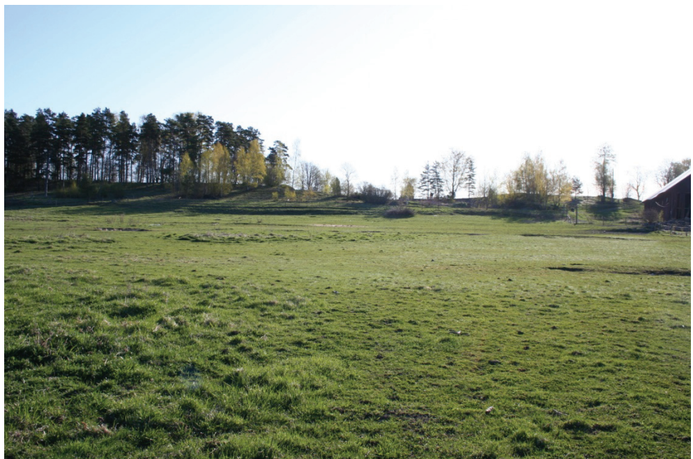
Figur 4. Glanshammarsåsen vid Skävesund sedd från västra delen av utredningsområdet. Gravfältet, Glanshammar 4:1, ligger bland tallarna till vänster i bild.