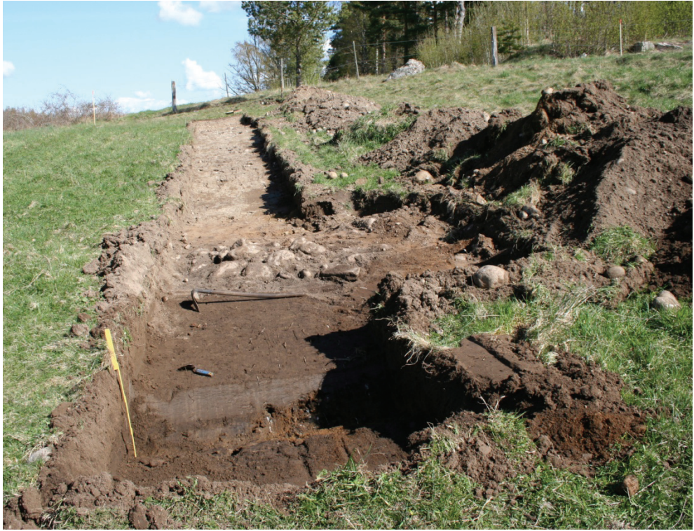
Figur 5. Röjningsröset, A2, med det äldre odlingslagret i förgrunden. Foto från söder, Jenny Holm.