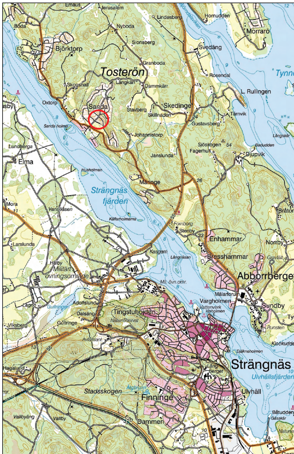
Figur 2. Undersökningsplatsens läge, markerat med en ring. Utdrag ur Terränkartan. Skala 1:50 000.

Kartor ur allmänt kartmaterial © Lantmäteriet Gävle. Ärende nr MS2006/01407.