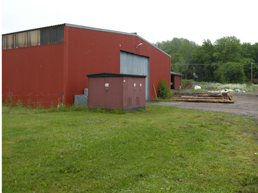
Bild 3. Transformatorstation före arbetena.

Transformatorstationen har utformats så att den är identiskt med den gamla.