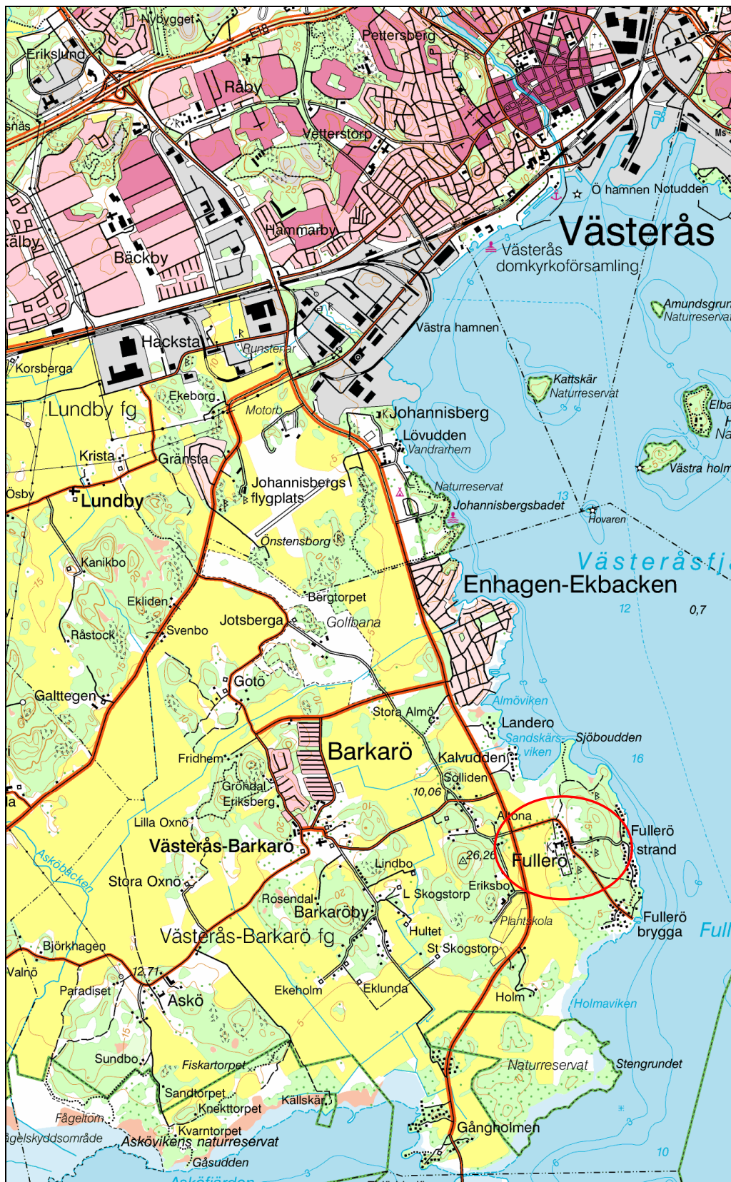
Bild 1. Fullerö säteri, markerat med en ring. Utdrag ur Gröna kartan. Skala 1:50 000.