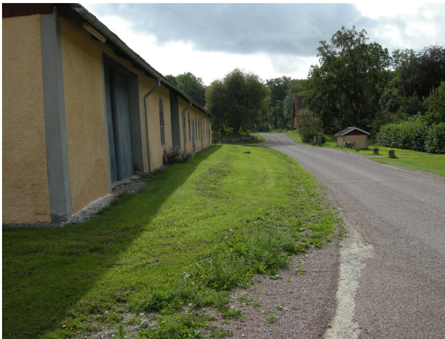
Bild 6. Ladugårdens västra sida efter schaktning.