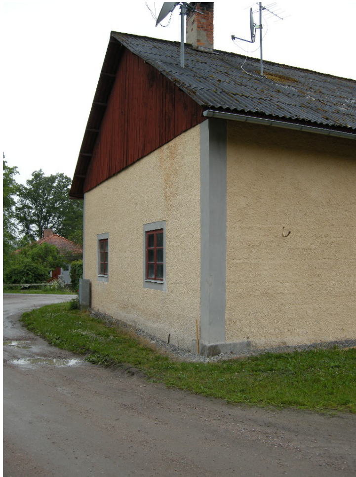
Bild 7. Ladugårdens södra gavel före schaktning.