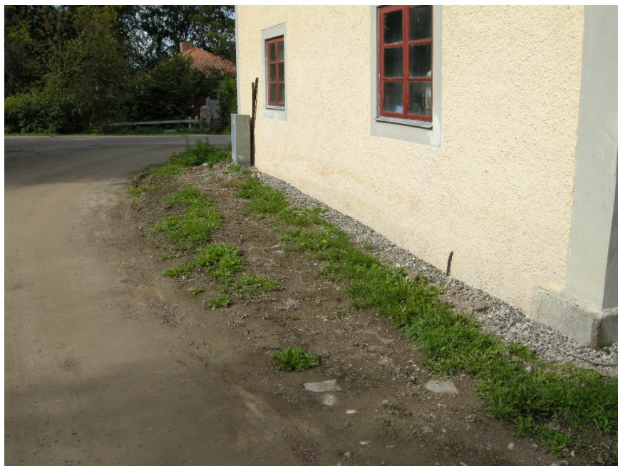
Bild 8. Ladugårdens södra gavel efter schaktning.