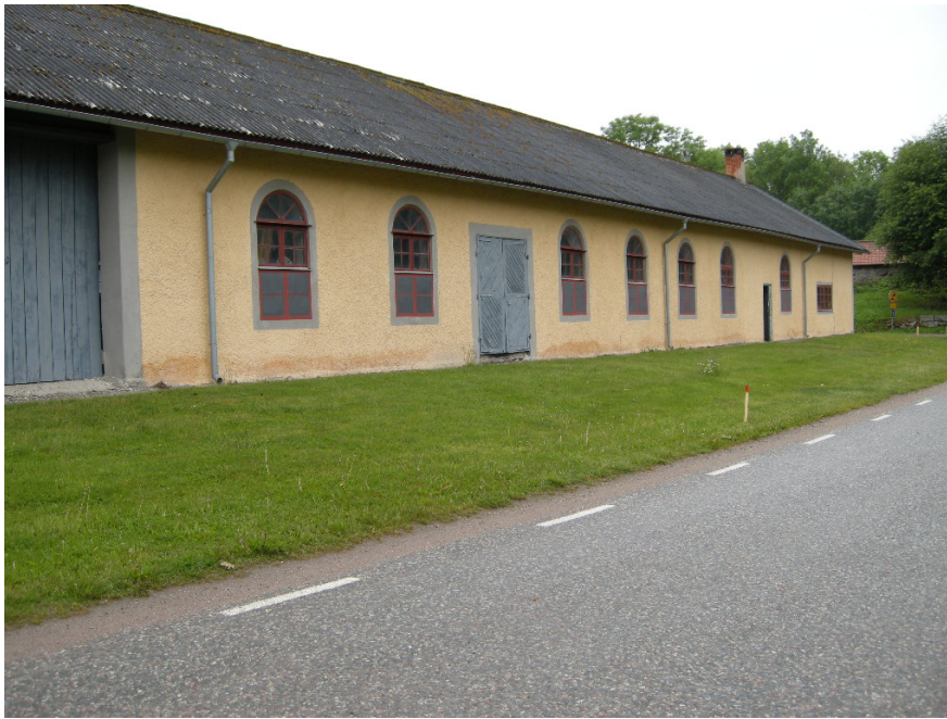
Bild 5. Ladugårdens västra sida före schaktning.