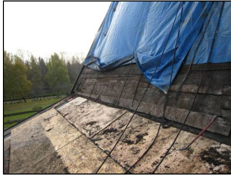
Figur 6. Undertaket var i gott skick.