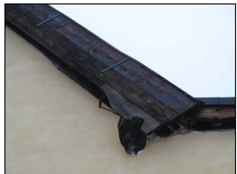
Figur 13. Detalj med delvis utbytt vindskiva samt bevarade järn och plåtöverläggare.