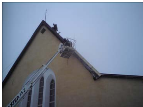
Figur 12. Den övre delen av vindskivan är utbytt.