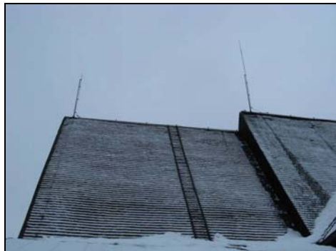
Figur 10. Norra takfallet efter omläggningen med återmonterad takstege.