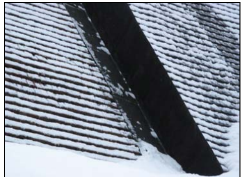
Figur 11. Anslutning mellan korets och långhusets takfall efter omläggningen.