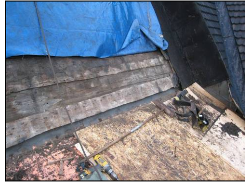
Figur 7. Till höger i bild syns de korta plåtar som ligger mellan korets och långhusets takfall.