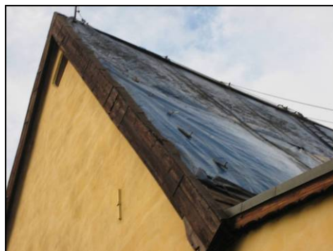
Figur 4. Korets norra takfall avtäcktt.