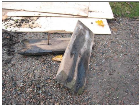
Figur 8. Bortrivet spån från norra takfallet med smidd spik eller klippspik.