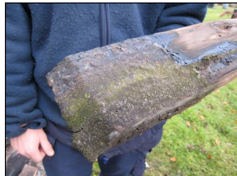
Figur 9. Bortrivet spån med spår av stenkolsstjärna.