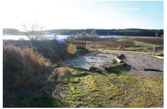
Figur 6. Schakt 2 sett från norr med Lasjön i bakgrunden.