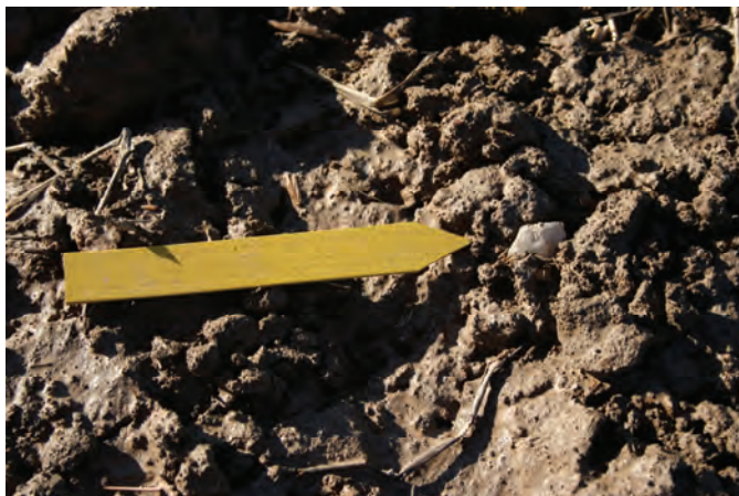
Figur 7. Bipolär kärna av kvarts i åkern inom Västerfärnebo 78:1.