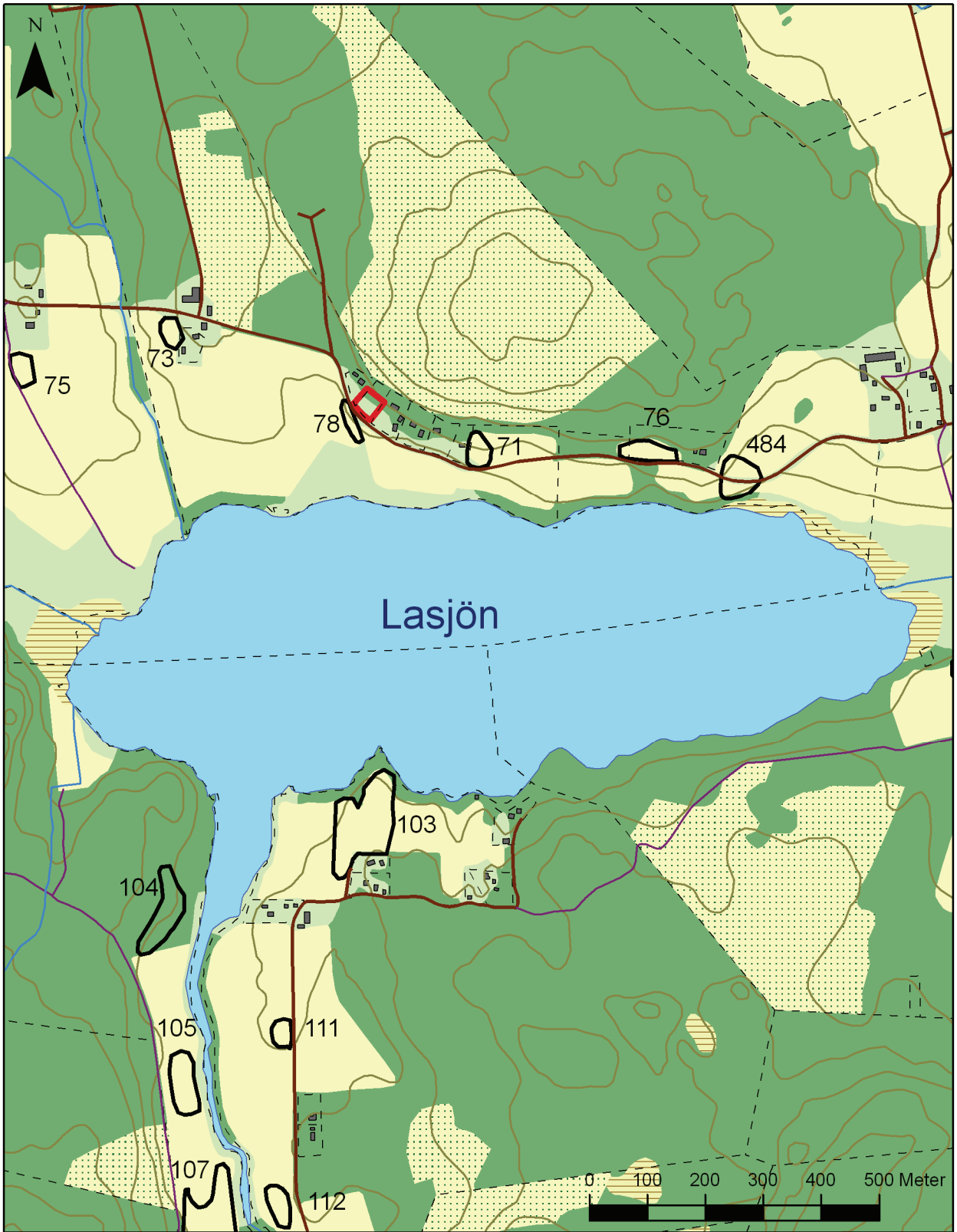
Figur 2. Utsnitt ur digitala fastighetskartan med undersökningsområdet markerat med röd ram. Ur forminnesregistret har de kända stenåldersboplatserna, markerade med svarta begränsningslinjer, tagits med. Skala 1:10 000.