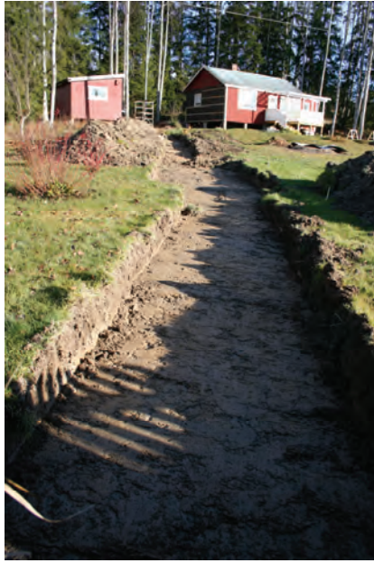
Figur 5. Schakt 1 sett från sydväst.