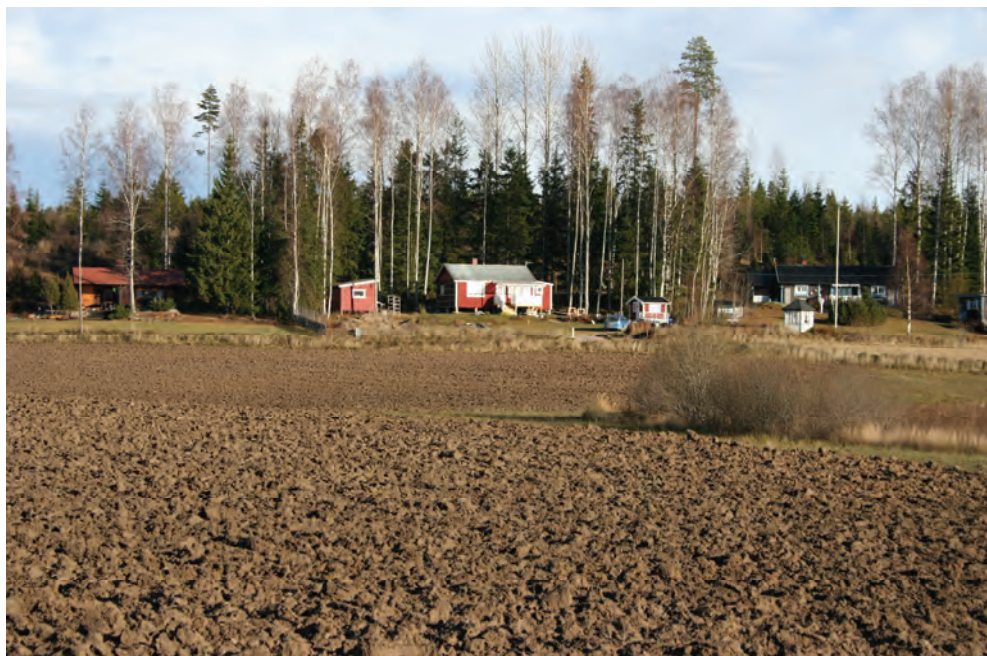
Figur 4. Undersökningsområdet är vid den röda sommarstugan i bildens mitt med boplatsen Västerfärnebo 78:1 i åkern framför. Foto från sydväst, Jenny Holm.