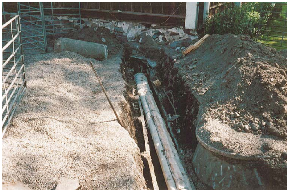
Figur 3. Schakt B mellan östra flygeln och huvudbyggnaden med vattenledningar som kulverterats i cementrör samt elledningar.