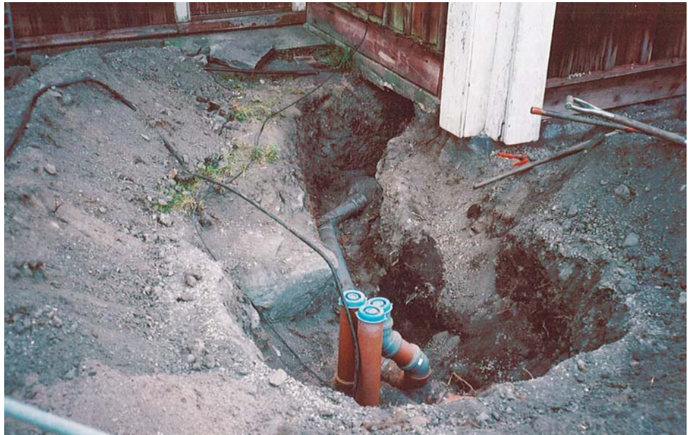
Figur 2. Schakt A intill östra flygeln med diverse vattenledningar samt en elkabel. (Foto från väst U. Alström.)

Schakt B var 10 m långt och 1 m brett. Schaktdjupet var maximalt 1 m djupt. I schaktet fanns en kulvert med vattenledningar men även el var nergrävt intill kulverten. I schaktkanten påträffades mörkt grusigt kulturlager. Inga fynd påträffades i schakt B eller i de uppgrävda massorna som låg intill schaktet.