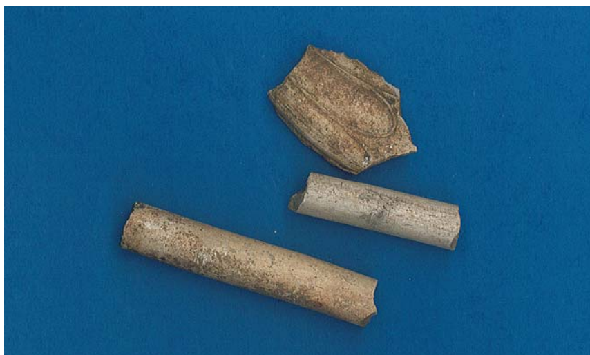
Figur 1. Kritpipsfragmenten som påträffades vid schakt A.

Två schakt hade redan grävts vid den östra flygeln innan schaktningsövervakningen utfördes. Schakt A var cirka 3,5 m långt med oregelbunden form. Djupet var 0,8 m. Marken var omgrävd på grund av tidigare ledningsdraineringar. Ett mörkare omrört kulturlager fanns delvis bevarat i schaktkanterna. Från dumphögens massor tillvaratogs en rödgodsskärva samt tre kritpipsfragment. Rödgodsskärvan är av en allmän typ och dateras till cirka 1700 talet. Kritpipsfragmenten bestod av en del av ett piphuvud samt två skaftdelar. Piphuvudets utformning antyder att den tillverkats i Stockholm av Anders Örnbeck som började tillverka pipor 1754 (Loewe 1990, Åkerhagen 1995).