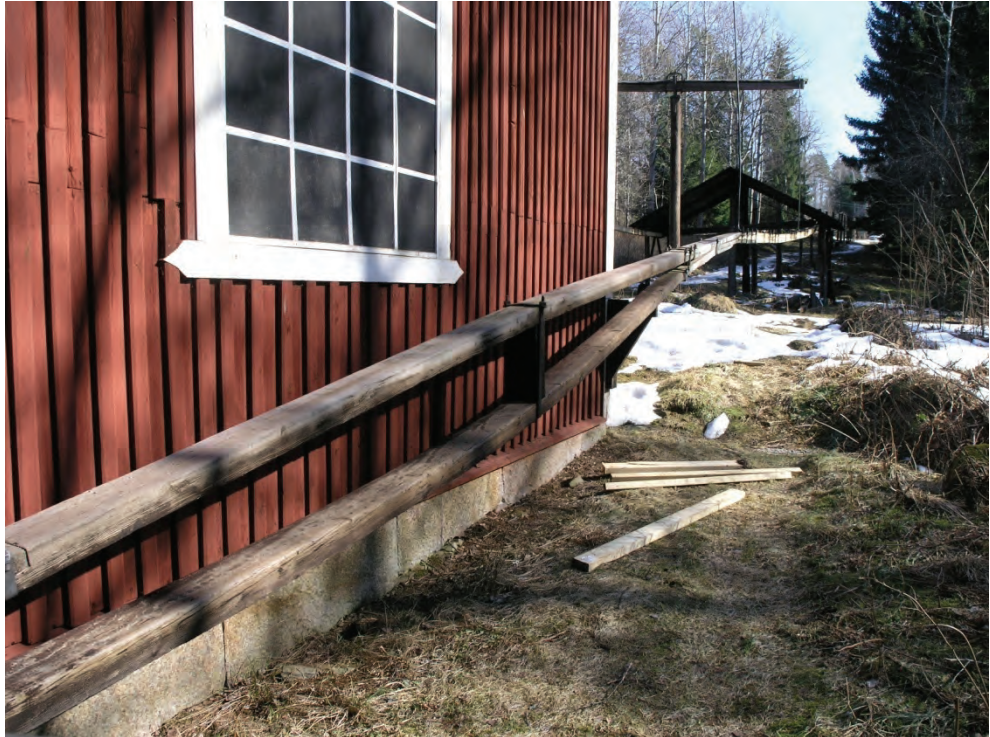
Figur 4. Den tvådelade korgstången i förgrunden samt i bakgrunden höjdbrottet där korgstångens tvådelade konstruktion går samman och själva stånggången tar vid.