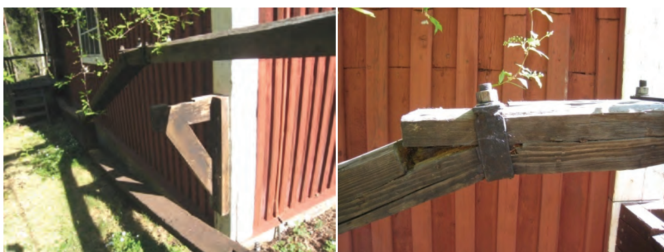
Figur 8. Den brustna korgstången.

Timret som använts för korgstången hade dimensionerna 180 mm hög och 177 mm bred. Längden på armen var 13,47 meter. Högpunkten för de uppspända bågarna låg cirka 5,87 meter från vevaxeln eller 7,6 meter från skarven mot stånggången. Där spänces bågarna upp med en 40 cm hög vertikal stolpe. Efter provsågning i det äldre virket konstaterades att armen var konstruerad av gran. Detta kunde senare även verifieras av brandförsäkringen från 1879. Man kunde även se att det var ramsågat virke som använts i den ursprungliga konstruktionen.