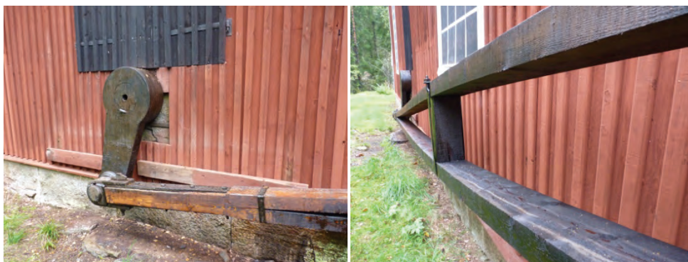
Figur 20. Korgstångens infästning mot vevaxeln.