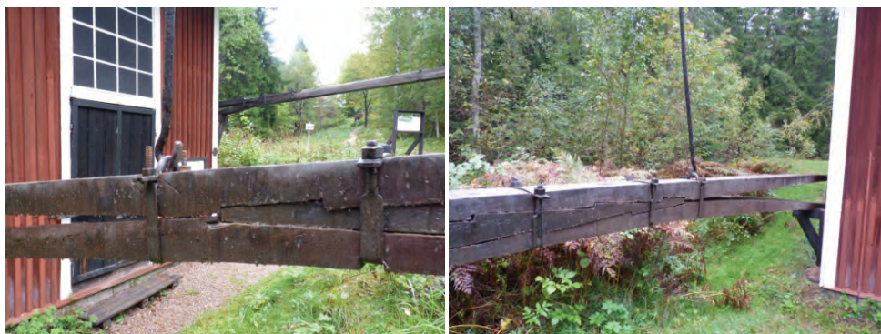
Figur 22. Blixtskarv som sammanfogar korgstången med den fortsatta stånggången.