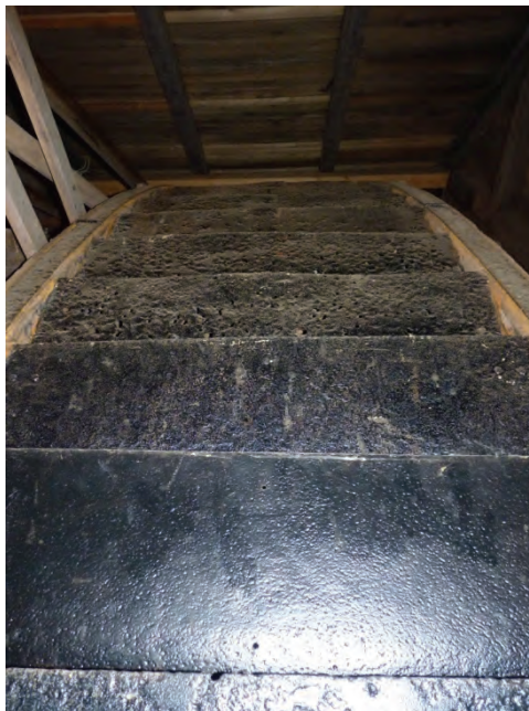
Figur 7. De järnklädda skovlarna på utsidan av hjulet.