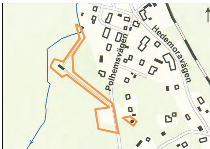
Figur 2. Byggnadsminnets angränsning markerat med rött.

Under 2010 brast den sydvästra korgstången på flera ställen. Redan tidigare fanns flera lagningar.