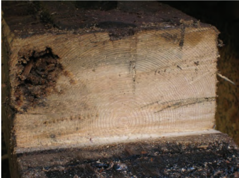
Figur 15. Snittet visar att armen är tillverkad i gran. Stocken är också angripen av lite röta i övre vänstra delen.