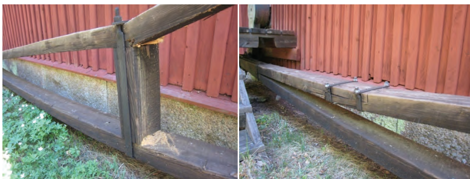
Figur 10. Övre delen av korgstången har brustit i höjd med den vertikala stolpe som spänner upp armen i två bågar.