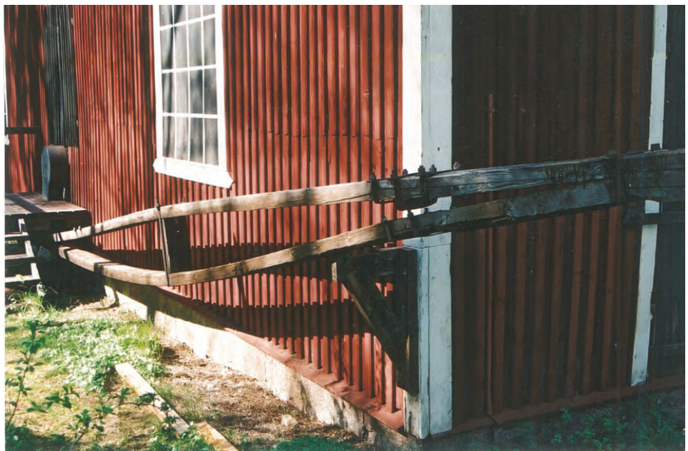
Figur 5. Korgstången sedd mot vevaxeln.