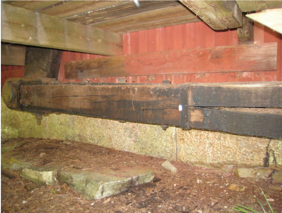
Figur 12. Korgstångens infästning mot hjulhusets revaxel. Fram till det vertikala järnet är armen i ett stycke, däriifrån klyvs den i två delar. Vid undersökningen visade det sig att man sedan tidigare bytt den övre delen av stängen. Järnet har därmed fått dölja den skarv där virket låg stumt mot varandra.