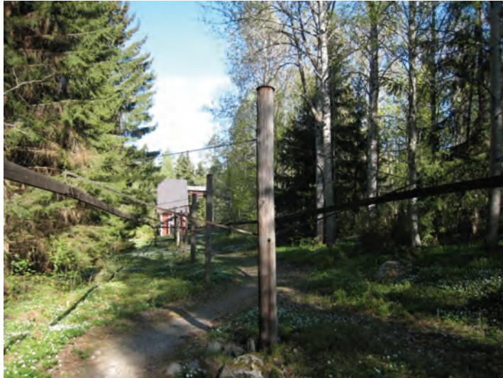
Figur 24. Stånggången sedd mot hjulluset.

Den övre delen av den sydvästra korgstången hade som tidigare nämnts brutit på två ställen. För att åtgärda detta önskade man byta hela armen, vilket Länsstyrelsen även gav sitt medgivande till. På så sätt skulle man slippa dagens skarvar i konstruktionen, vilka inte skulle fungerat i en stånggång i drift. Istället för att ha som antikvarisk utgångspunkt att bevara ursprungligt material valde man att få en teknikhistoriskt mer pedagogisk lösning.