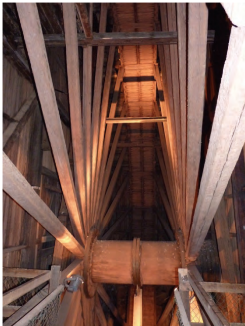
Figur 6. Hjulets insida.

För konstgångens del värderades 180 löpfot dubbel konstregla. Detta innefattade 5 timmer till bockar, två stycken, 40 fot långa, grantimmer till korkstänger/korgstänger, 10 stycken 25 fot höga stolpar av furu, 280 fot granspiror, 10 stycken 3/8 tum x 11 tum rundjärn, järn till krokar, skruvar, grimmor, slakjärn och korkstångsbeslag. Dessutom tre stycken vändhjul till konstledningen.