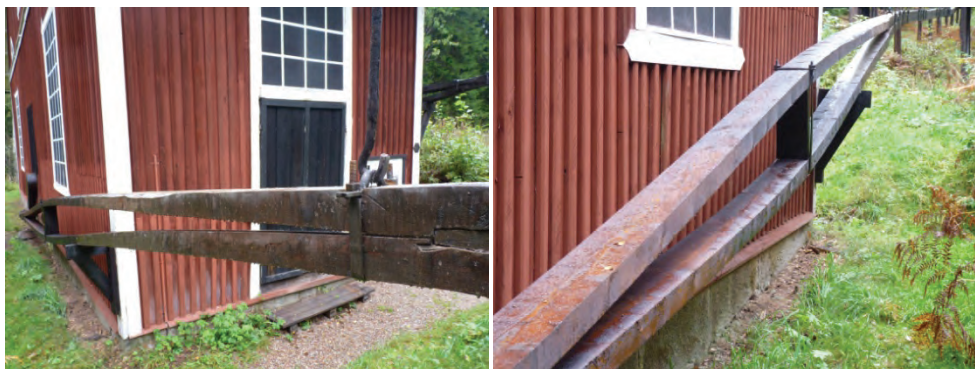
Figur 16. Korgstängen sedd mot nordväst efter byte.

Hela stånggången har tjarats med dalbränd trätjära.