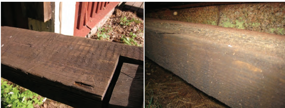
Figur 13. Spår efter ramsågning av det äldre virket där den undre delen av stängen skarvats, ungefär i höjd med hjulhusets knut.