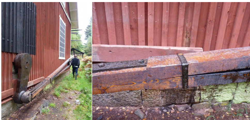
Figur 18. Den nya korgstången sedd från vevaxeln.