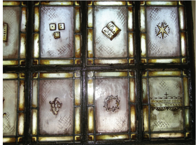
Figur 59. Detalj av korfönstret efter rengöring.