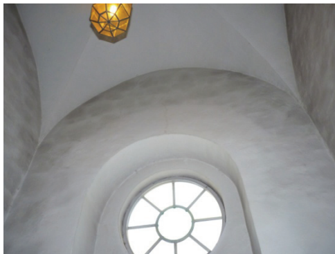
Figur 60. Vapenhusets valv och västra vägg före rengöring.

Sedan tidigare hade den nedre delen av väggarna i vapenhuset strukits med kulturkalkfärg eller dylikt. I sista strykningen blandades därför en liten del kulturkalkfärg i Gotlandskalken, som en förstärkning för avfärgningen av väggarna, ungefär upp till manshöjd. Underlaget var annars för sugande för att ge ett bra resultat med ren Gotlandskalk. I valvet har fyra strykningar utförts, medan väggarna i nedre delen strukits upp till åtta gånger.