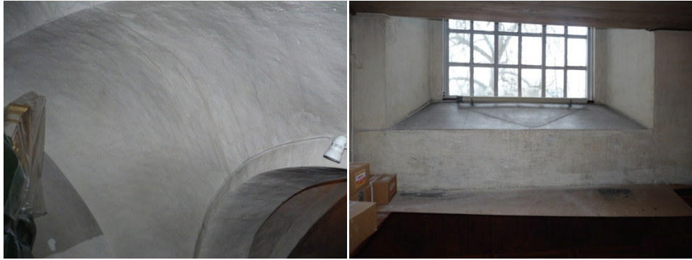
Figur 39. Trävel 4 före rengöring.