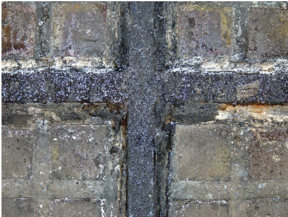
Figur 57. Korfönstrets gjutjärnsbåge och glas har varit illa av den kondens som uppkommer på fönstret på grund av stora temperaturskillnader.