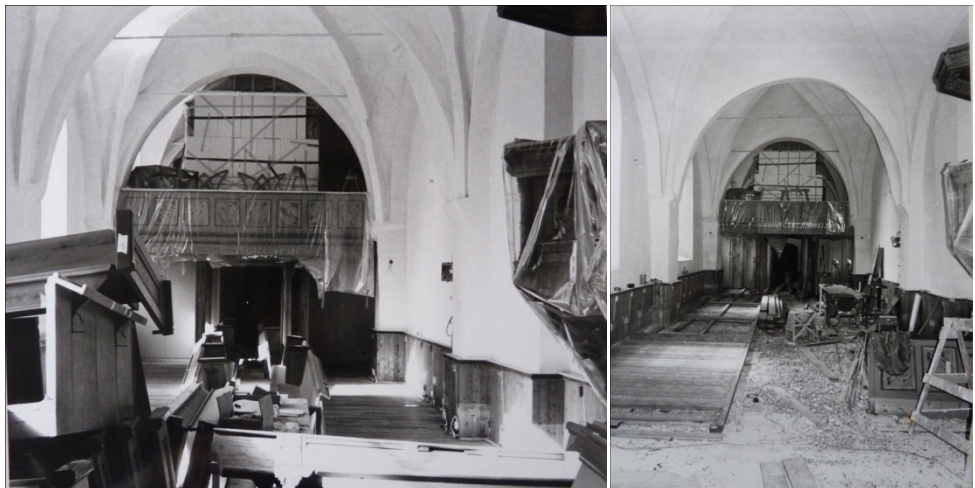
Figur 14. Bänkkvarteren staplades i kyrkan.