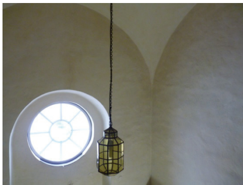
Figur 62. Vapenhus, västra och norra väggen efter rengöring och lavering.