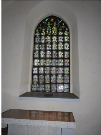
Figur 58. Korfönstret efter rengöring.