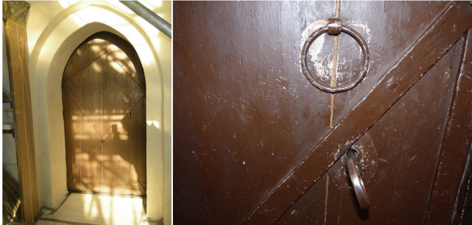
Figur 49. Sakristians dörr sedd från koret.