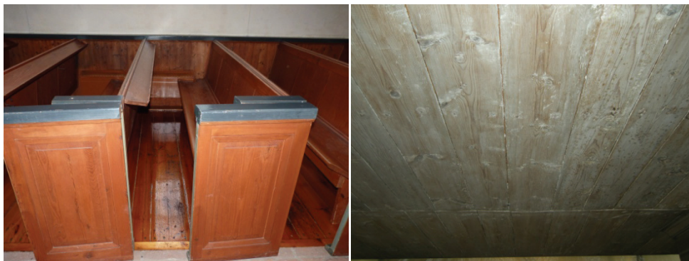
Figur 45. Linoljefernissat golv i bänkkvarter.

En äldre färgställning på innerdörrarna i vapenhusets entré har skrapats fram, NCS S 6005 G80Y, och karm och dörrblad har därefter målats med linoljefärg från Wibo i denna kulör.