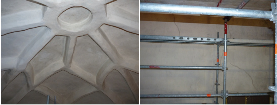
Figur 20. Korvalvet vid påbörjat arbete med rengöring, före laveling.