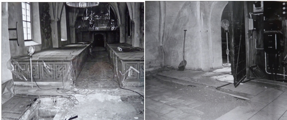
Figur 12. Nederst till vänster i bild syns den återfunna källaren i korgolvet.