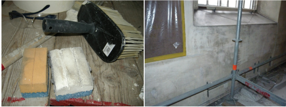
Figur 25. Till höger ligger den Akapadsvamp som användes till de mindre smutsiga ytorna såsom valven. Till höger den mjukare, vita Akapadsvampen som användes till mer nedsmutsade partier. Figur 26. Rengöring påbörjad under fönster, korets södra vägg.