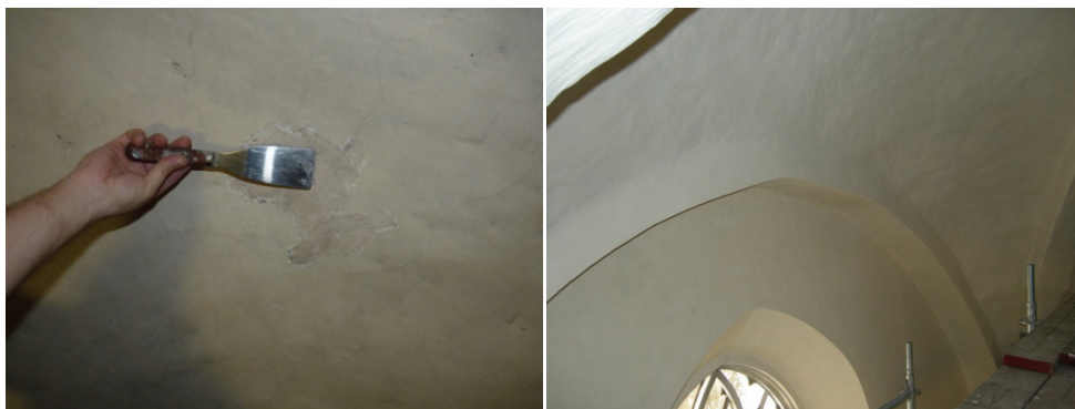
Figur 33. I travé 2 spjälkades det yttersta skiktet från underlaget på sina ställen. Möjligen har man använt sig av ett spackelartat material vid förra renoveringen. Det kan också bero på för dålig rengöring.