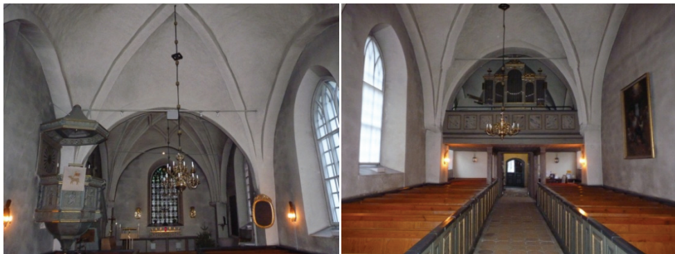
Figur 18. Sotningen var kraftigast på väggarna av natursten medan de slätare tegelvalven var ljusare.