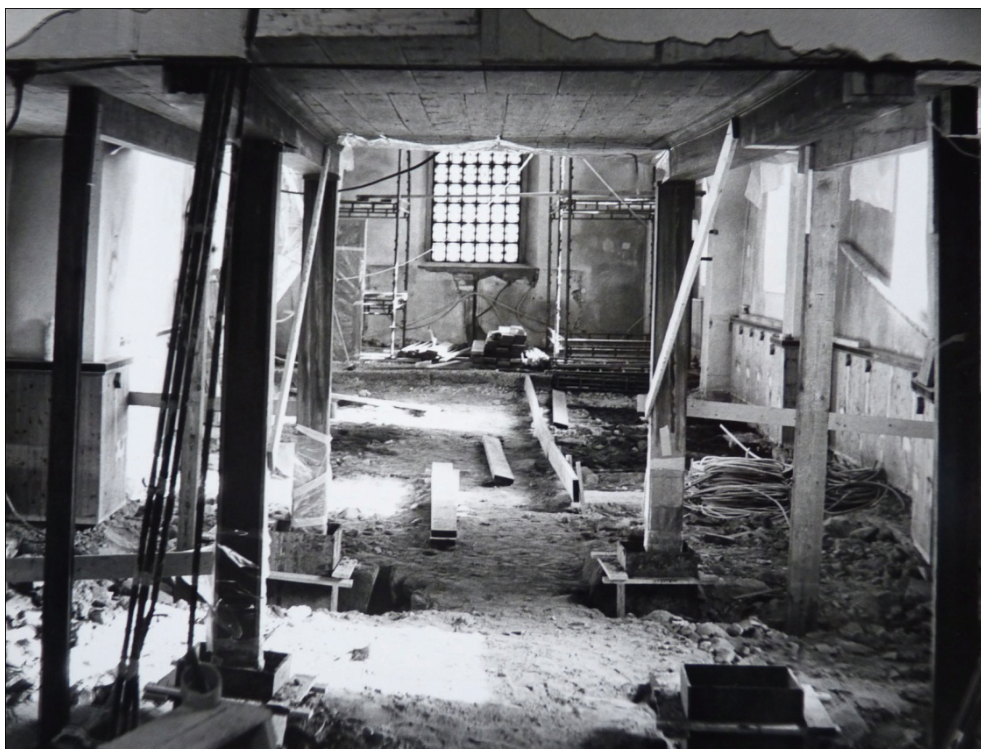
Figur 9. Hela golvet bröts upp i samband med arbetet 1978.