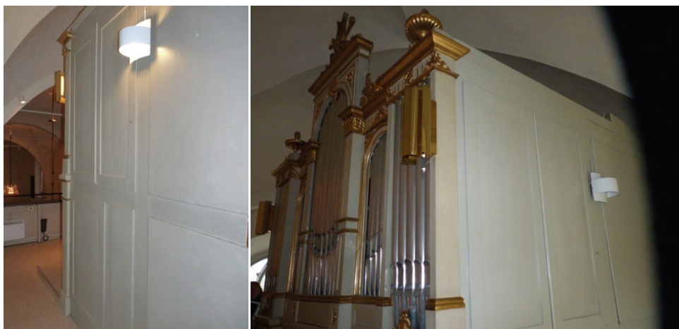
Figur 47. Orgelhusets sida före åtgärder.