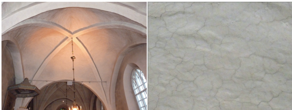
Figur 29. Travé 2 före påbörjad rengöring. Foto: Helén Sjökvist. Figur 30. Nålsprickor före rengöring i travé 2. Foto: Helén Sjökvist.