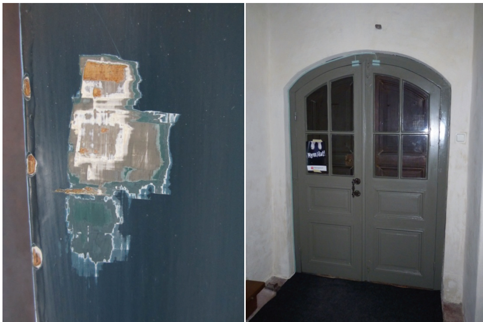
Figur 53. Framskrapade äldre färglager på dörrkarmen i vapenhusets entré.