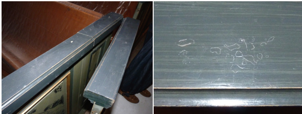
Figur 51. Överliggarna i bänkkvarteren hade slagskador.