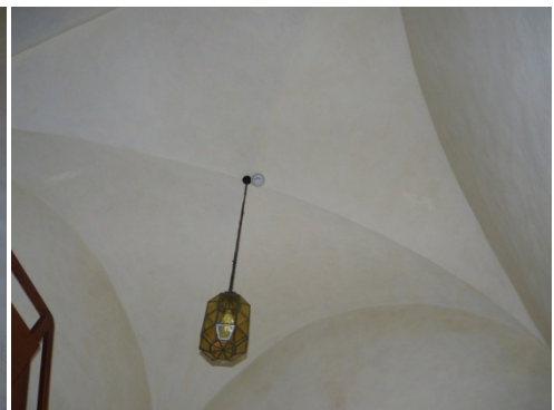
Figur 63. Vapenhus, valv efter rengöring och lavering.