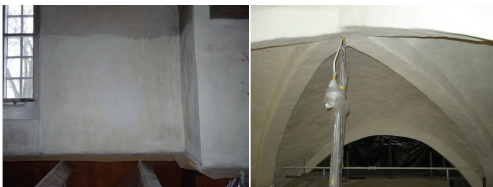
Figur 35. Bomsläppa på norra väggen i travé 3.