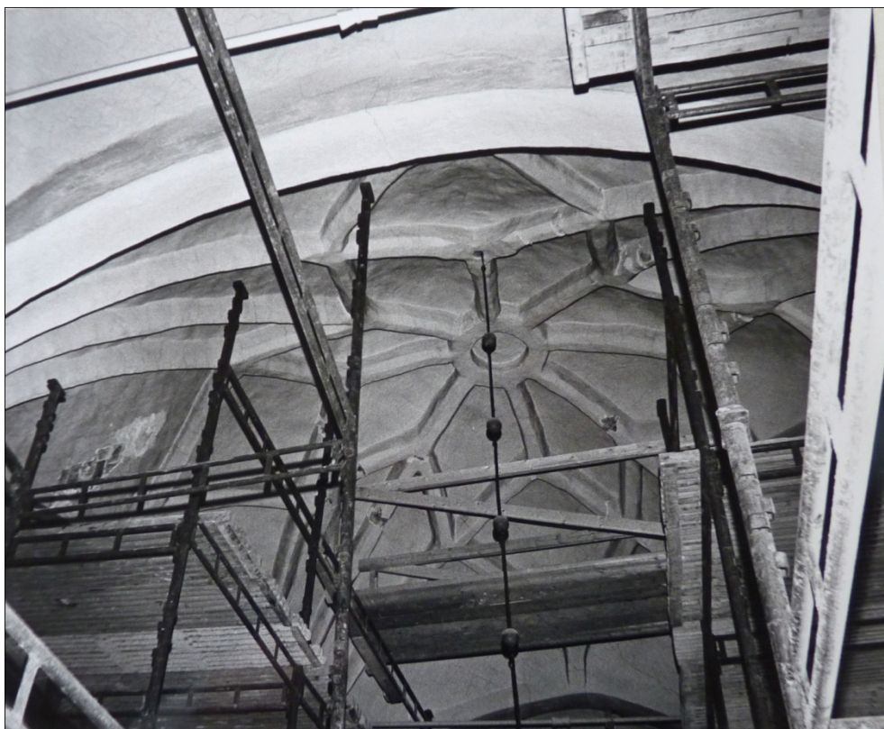
Figur 8. Rengöring av korets stjärnvalv 1978.