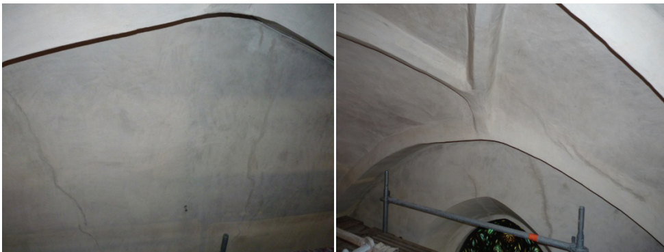
Figur 22. Spricklagning norra väggen travé 1.