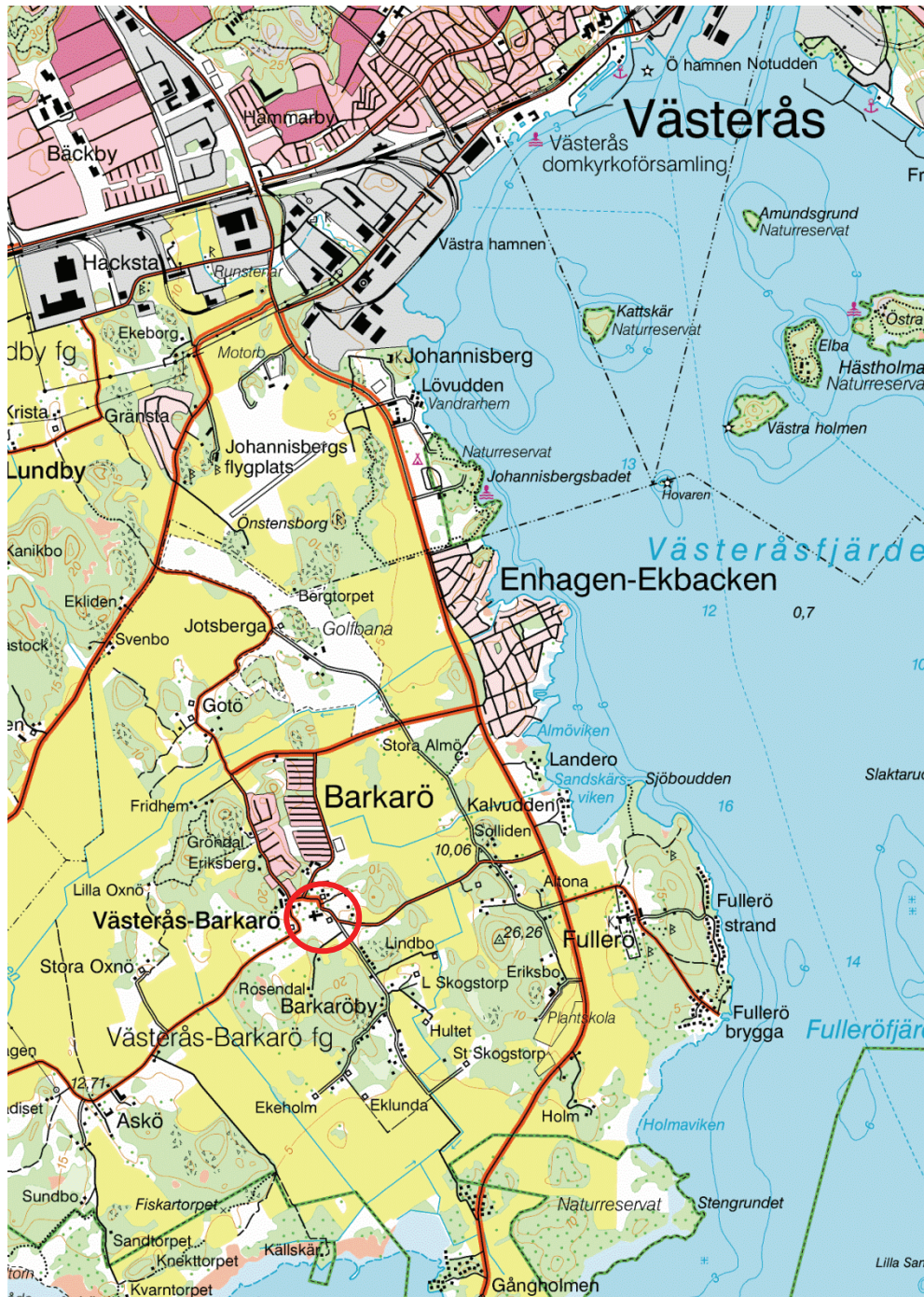
Figur 1. Kyrkans läge, markerat med en ring. Utdrag ur Gröna kartan, skala 1:50 000.