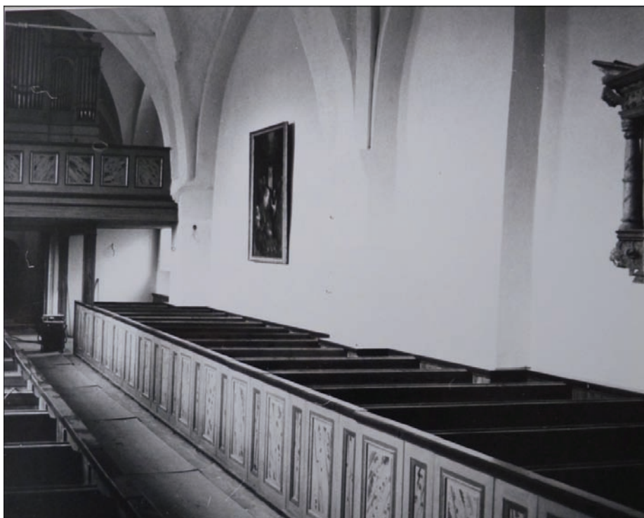
Figur 16. Kyrkan efter färdigställandet.