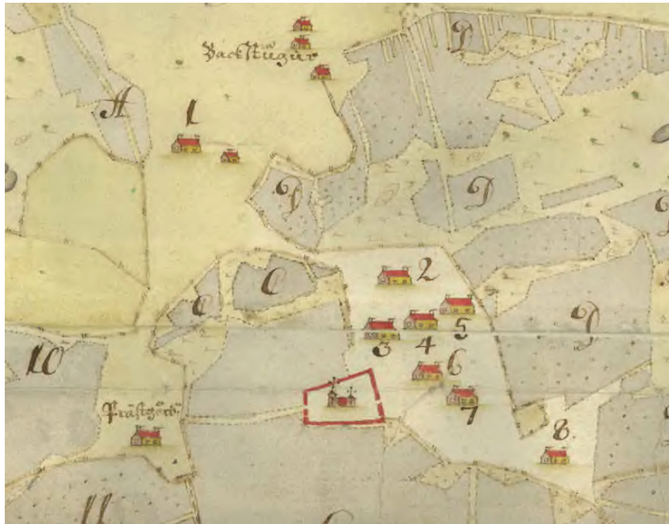
Figur 5. Barkaröby på geometrisk avmätning från 1691. Lantmäteristyrelsens arkiv akt T71-4:1.