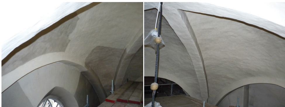
Figur 31. Påbörjad rengöring med Akapadsvamp i travé 2. Foto: Helén Sjökvist. Figur 32. Travé 2 under rengöring. Foto: Helén Sjökvist.