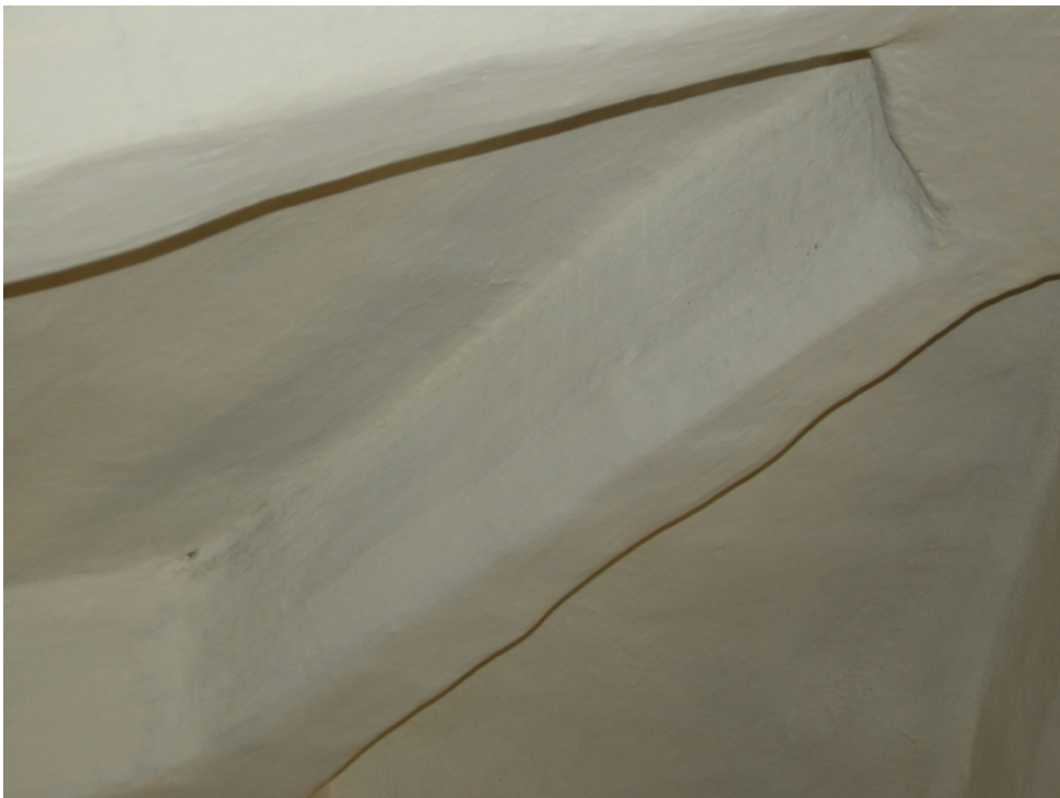
Figur 24. Valvribba i travé 1 före laveling. Det äldre färgskiktet fäster ojämnt vid underlaget.