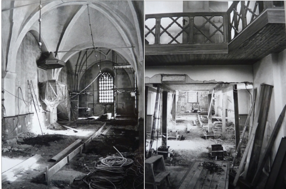
Figur 10. Uppbrutet golv i långhuset.