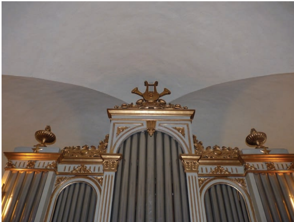
Figur 66. Orgelfasaden är rengjord av konservator.