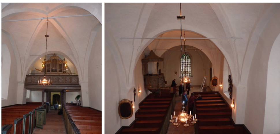
Figur 37. Travé 3 efter färdigställda arbeten.