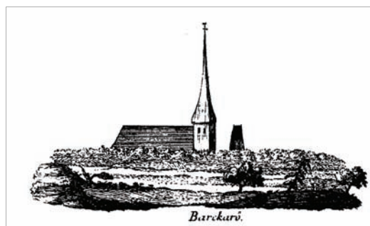
Figur 2. Kyrkan sedd från sydväst.