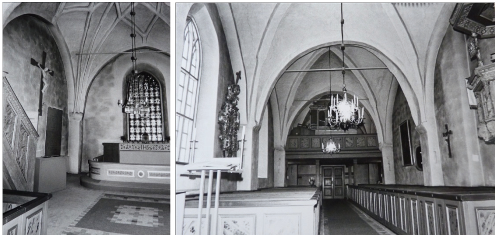
Figur 6. Koret med den gamla altarringen före 1978 års renovering. Väggarna var kraftigt nedsmutsade.