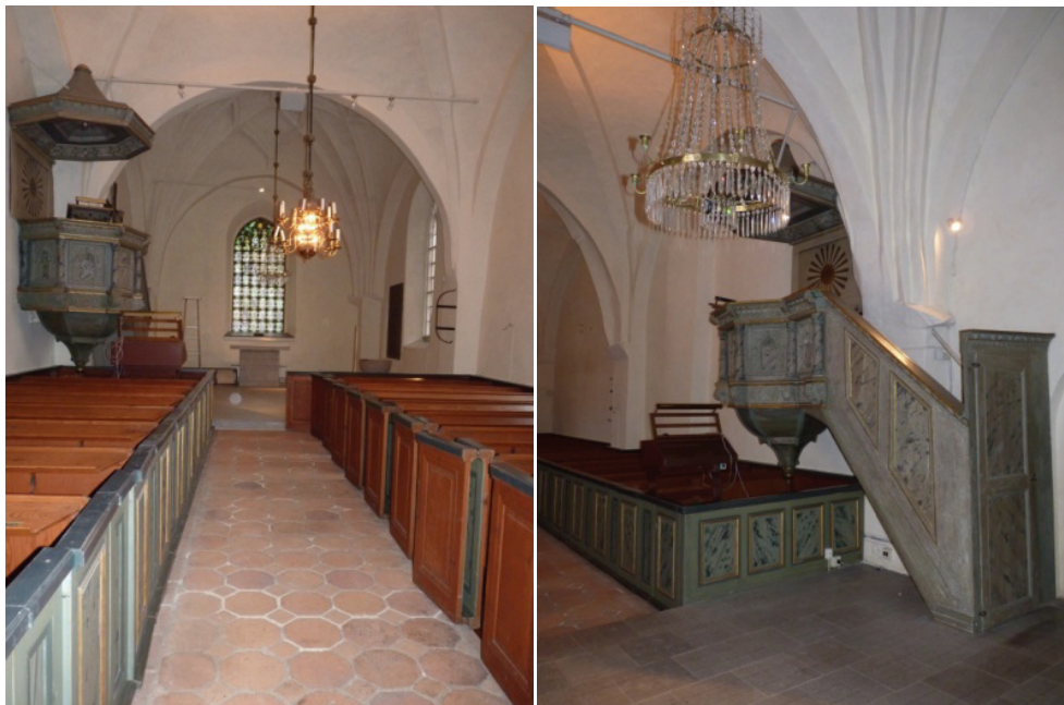
Figur 43. Kyrkan sedd mot koret efter rengöring.