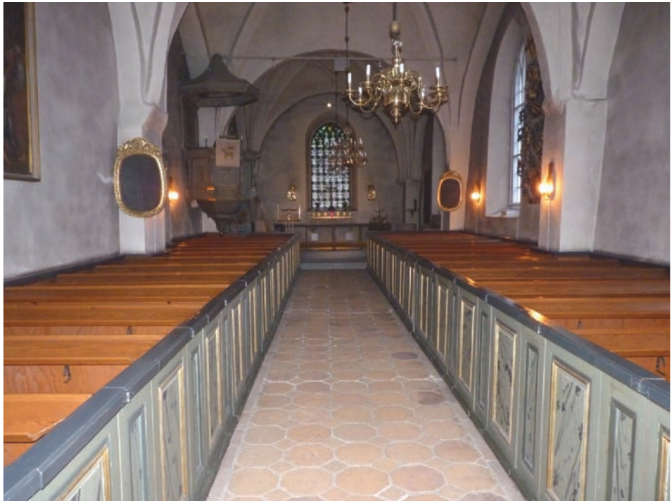
Figur 17. Kyrkorummet sett mot koret före arbetets påbörjande.

Långhusets västra vägg, mot vapenhuset, består av en träfiberskiva. Denna var sedan tidigare målad med en modern färg men kunde nu avfärgas med Gotlandskalk i likhet med övriga väggar.