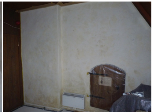
Figur 61. Vapenhusets södra vägg under läktartrappa under rengöring.