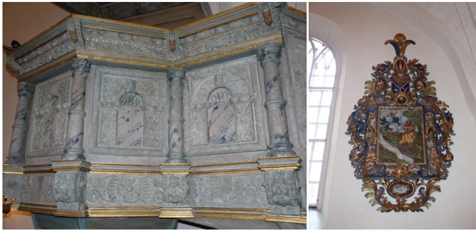
Figur 64. Rengjord predikstolskorg.

Södra väggens epitafium har dammats av och rengjorts från mögelangrepp.