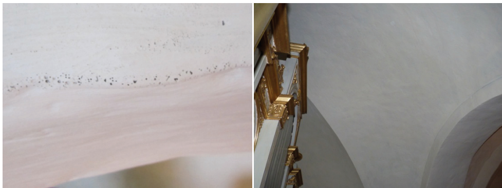
Figur 41. Porigheter i tidigare putslager i trävel 4.