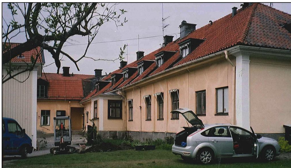
Figur 1. Kungsgården 3 där bergvärme installeras.