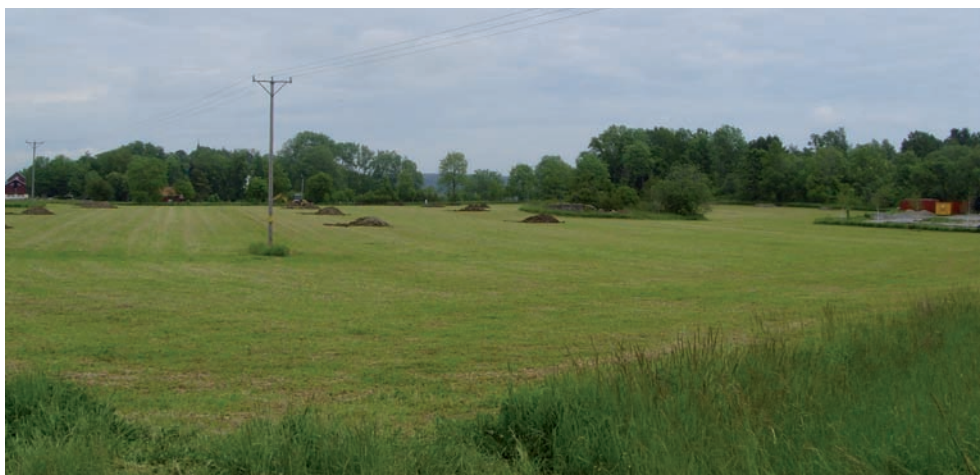
Figur 2. Översikt över utredningsområdet från sydväst. I skogsridån i bildens högra hälft ligger gravfältet Ytterjärna 331:1.

Utredningsområdet var ca 3 hektar stort och utgjordes av åkermark med ett mindre impediment i den centrala delen. Marken var svagt öst-sydöstsluttande med de högst belägna partierna, ca 10–15 meter över havet, i norr och väster. Omedelbart öster om planområdet ligger ett gravfält, Ytterjärna 331:1, och öster därom vidtar en brantare sluttning ner mot Saltsjön och Järnafjärden. Ca 500 meter norr om området ligger Ytterjärna kyrka, uppförd under 1100-talet.