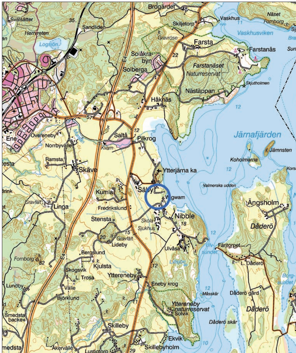
Figur 1. Utredningsområdet (markerat med blå ring) ligger söder om Ytterjärna kyrka ca 3 km sydöst om Järna. Utdrag ur den digitala Terrängkartan. Skala 1:50 000.