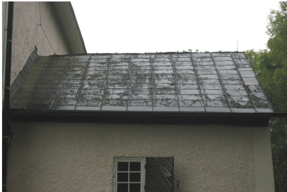
Figur 4. Sakristietakets östra sida före åtgärder.

Mellanstrykningen utfördes med Isoguard Pansar, en oljebaserad rostskyddsfärg som innehåller järnglimmer. Slutligen ströks taket två gånger med Lasol utvändig linolfärg från Engwall och Claesson, vilket är en linoljebaserad oljefärg baserad på svensk rå, kallpressad linolja.