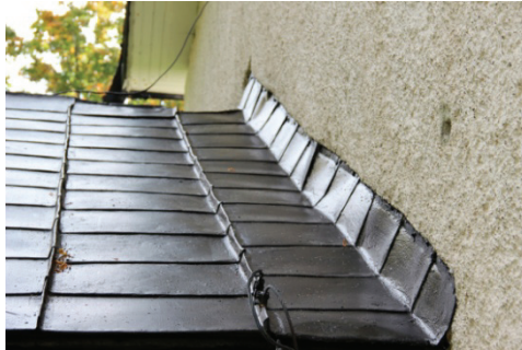
Figur 13. Västra takfallet efter åtgärder.