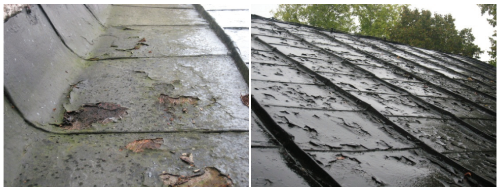
Figur 5. Rostiga partier på östra takfallet mot långbusväggen. Plåtarna är uppvikta mot fasaden.