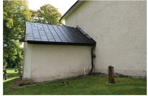
Figur 12. Östra takfallet mot långhusväggen har rengjorts från rost och målningsbehandlats.