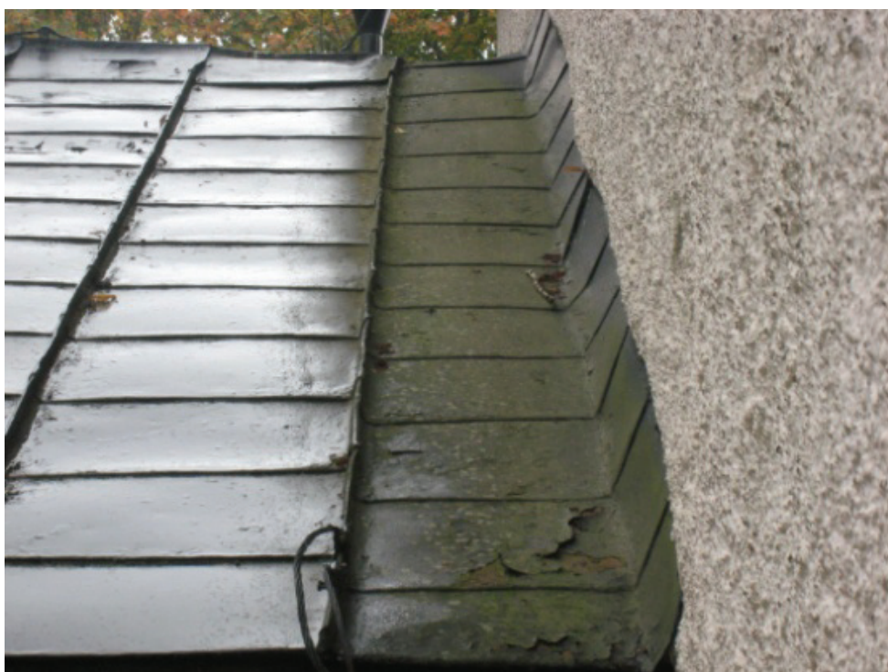
Figur 9. Rostangrepp i anslutningen mot långbusväggen.