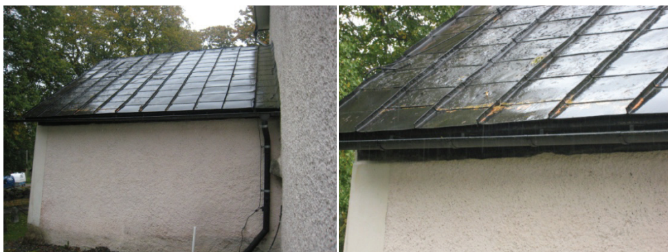
Figur 7. Västra takfallet före åtgärder.