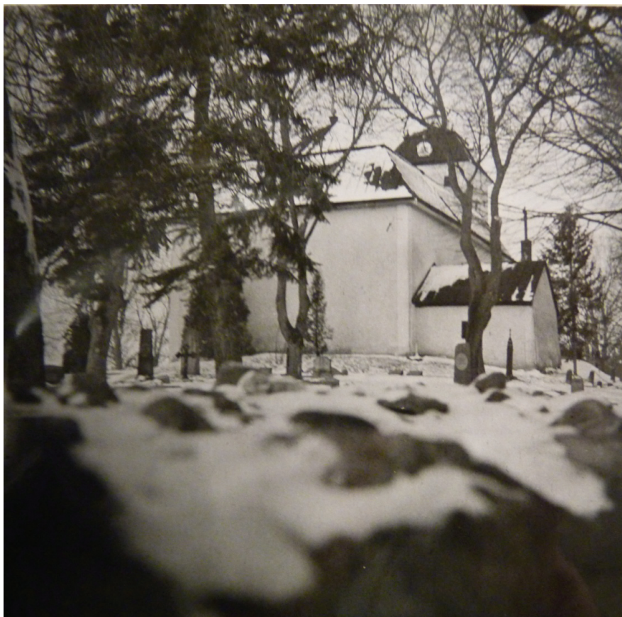
Figur 3. Odaterad bild på Kungsåra kyrka, sedd från öster. Sakristians skorsten finns fortfarande kvar vilket gör att bilden bör vara tagen före 1954–56 års renovering.

År 2008 ansågs det gamla plåttaket helt uttjänt och man fick tillstånd från länsstyrelsen att byta. Taket lades om med en modern stålplåt med polyesterbelagd yta som skall vara ommålningsbar. Falsarna utfördes dubbla och lades med så liten förskjutning som möjligt för att efterlikna det gamla takets skivtäckning. Sakristians gamla plåttäckning undantogs emellertid från arbetet då det kulturhistoriska värdet ansågs särskilt högt och att taket därför skulle bevaras.