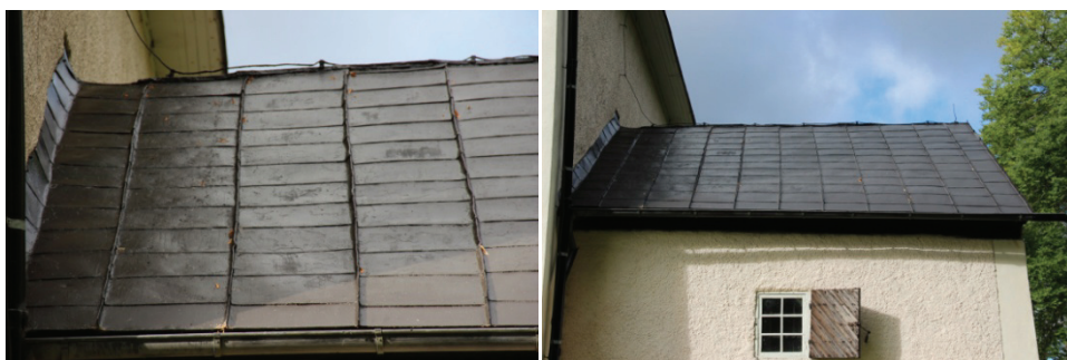
Figur 10 och 11. Östra takfallet efter åtgärder.