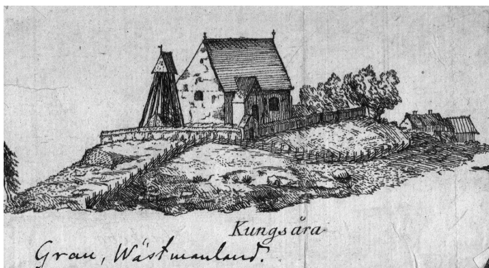
Figur 2. Teckning av den gamla kyrkan i Kungsåra ur Olof Graus "Beskrivning över Västmanland..." från 1750-talet.

Kungsåra kyrka uppfördes 1751-53 på grunden av medeltidskyrkan, vilken troligen härstammade från 1300-talet. 1 Den ursprungliga stenkyrkan hade relativt kort och bred plan, med sakristia utbyggd mot norr. I östra gaveln fanns ett trekopplat fönster. Över kyrkorummet var ett tak av trä. Vid nyuppförandet av kyrkan på 1700-talet revs det äldre långhuset och endast sakristian behölls. 2 Långhuset försågs med ett för tiden modernt brutet takfall som valmades över östra gaveln. Takfallen spåntäcktes. Över det nya vapenhuset i väster restes ett 11 alnar högt torn av gråsten. Över kyrkorummet slogs två flacka kryssvalv av tegel.