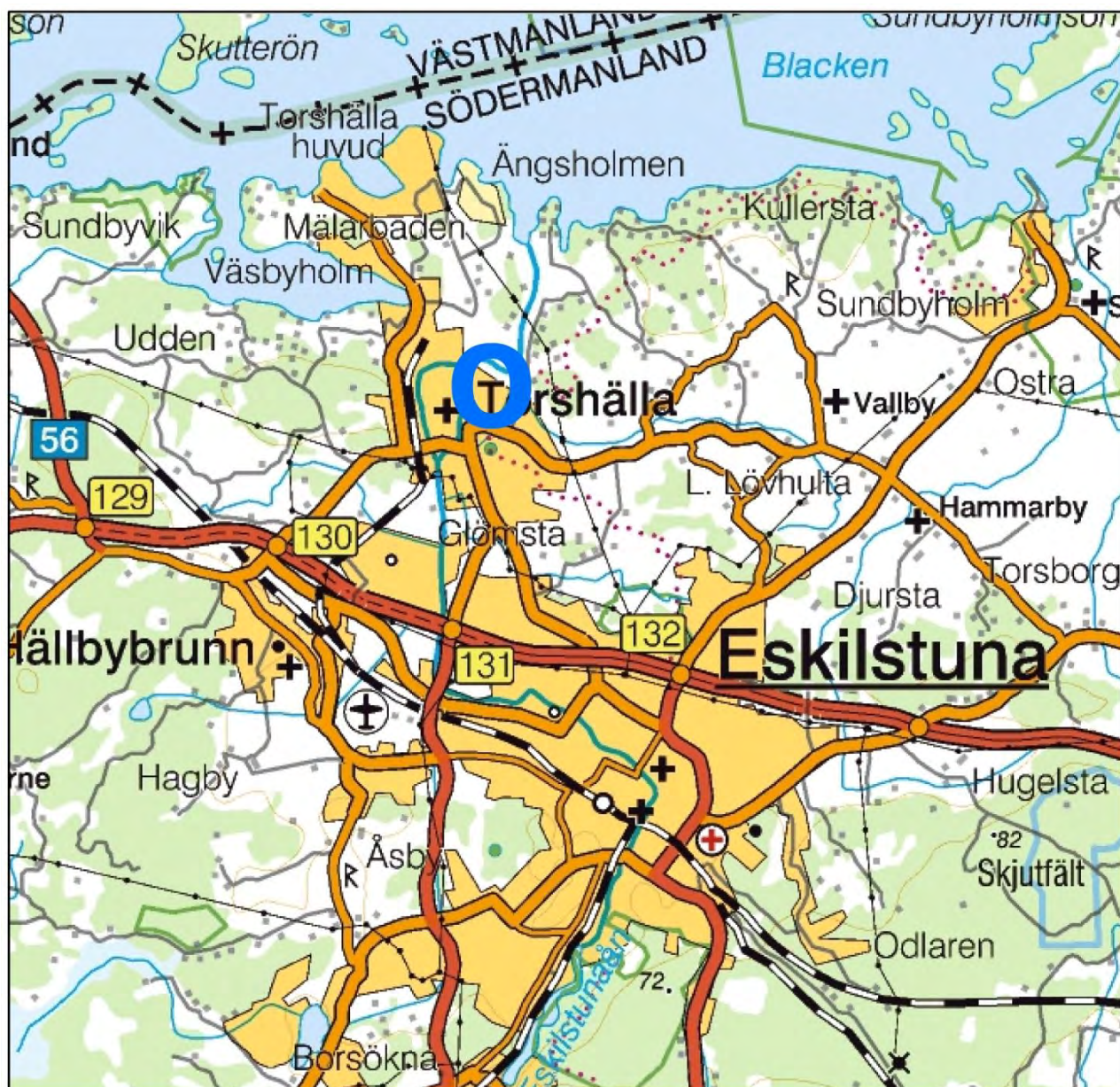
Figur 1. Utredningens läge markerat med blå ring. Utdrag ur Översiktskartan. Skala 1:100 000.

Kartor ur allmänt kartmaterial © Lantmäteriet Gävle. Ärende nr MS2006/01407.