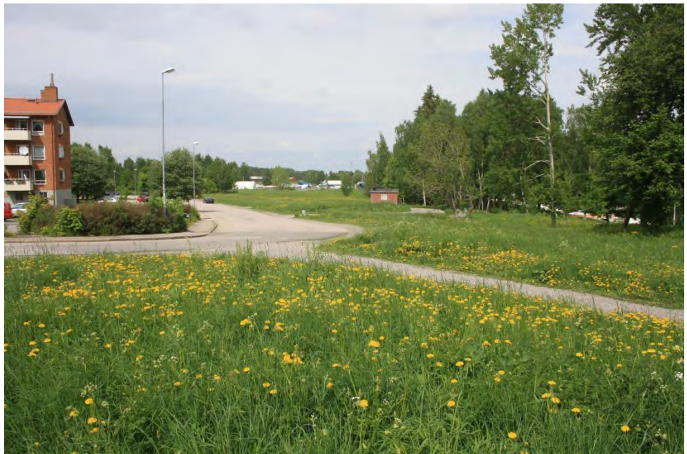
Figur 6. Utredningsområdets södra del sett från söder.