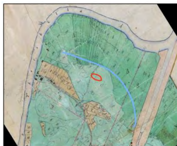
Laga skifte, 1865