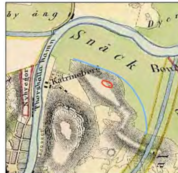
Ljunggrens atlas, 1857