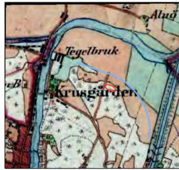
Häradsekonomska kartan, ca 1900