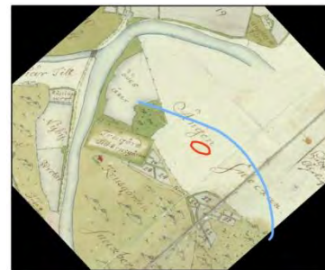
Geometrisk karta, 1742