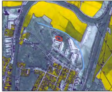
Ekonomiska kartan 10G 7h, 1956