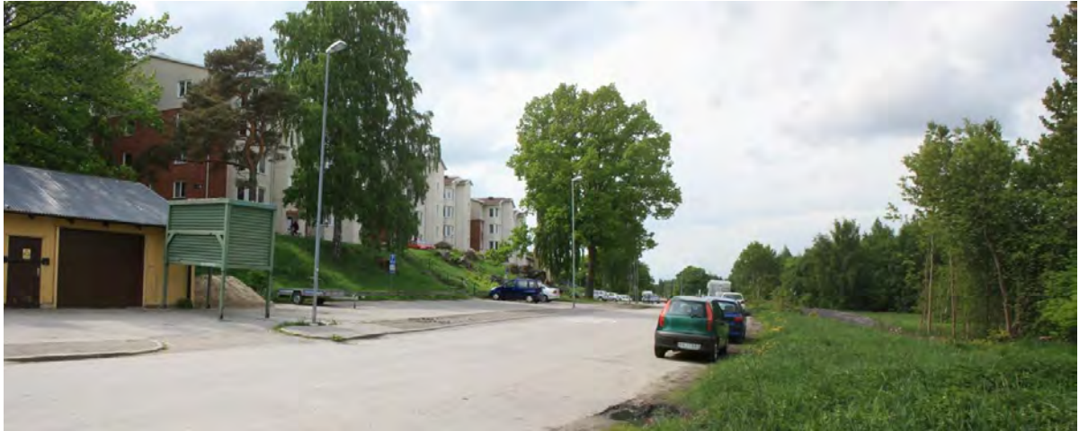
Figur 5. Utredningsområdets mellersta del. Granfältet Torshälla 19:1 ligger bakom buskroppen till vänster i bild och gång- och cykelvägen är tänkt att ligga norr om Ringvägen, här till höger i bild. Foto från öster, Jenny Holm.