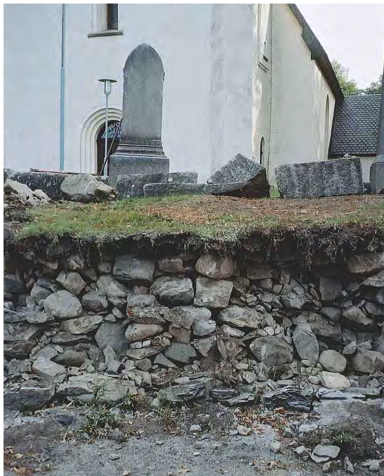
Figur 3. Kyrkogårdsfyllningen bakom de kallmurade tuktade stenarna i den västra kyrkogårdsmuren bestod av sten i olika dimensioner.