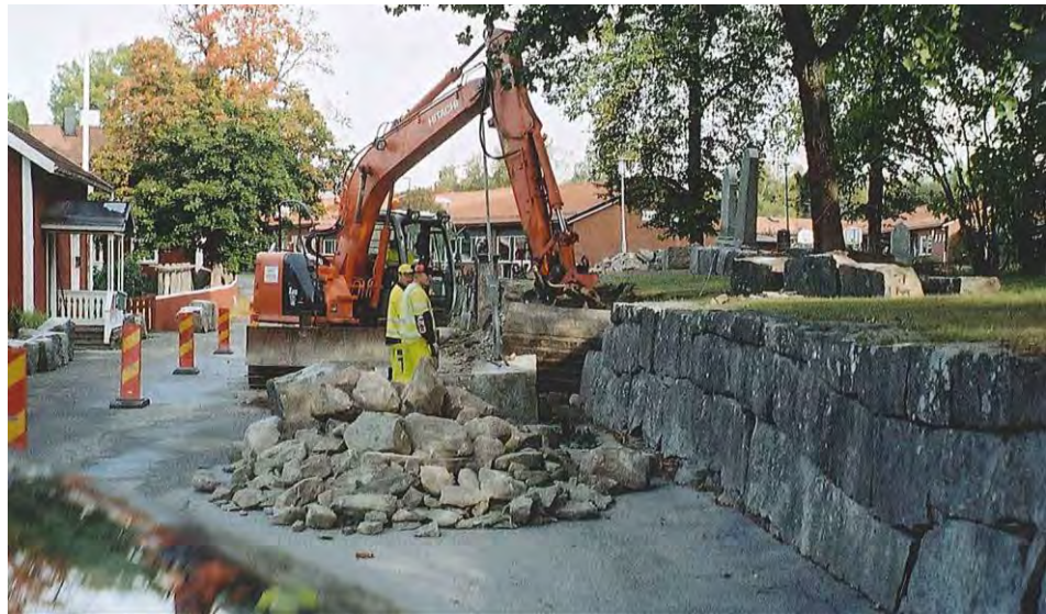
Figur 2. Den västra muren under demonteringen. (Foto från syd U. Alström.)