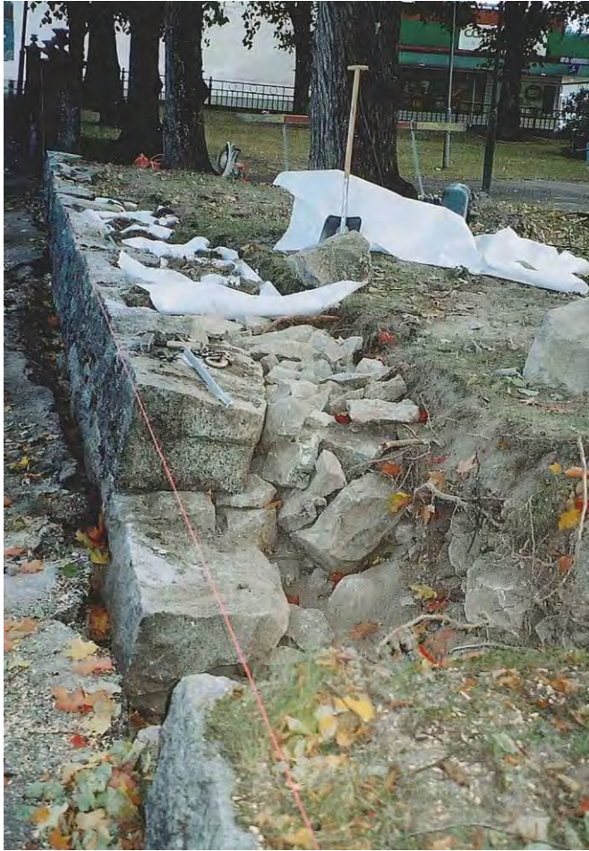
Figur 4. Det norra murpartiet under återställande.