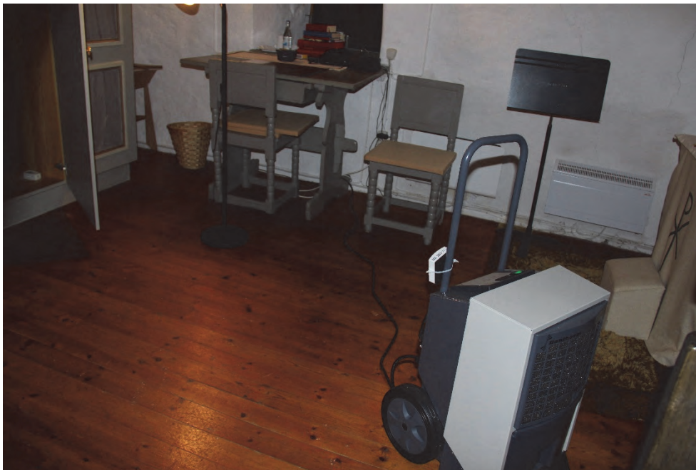
Figur 11. Anfuktare inställd i sakristian.