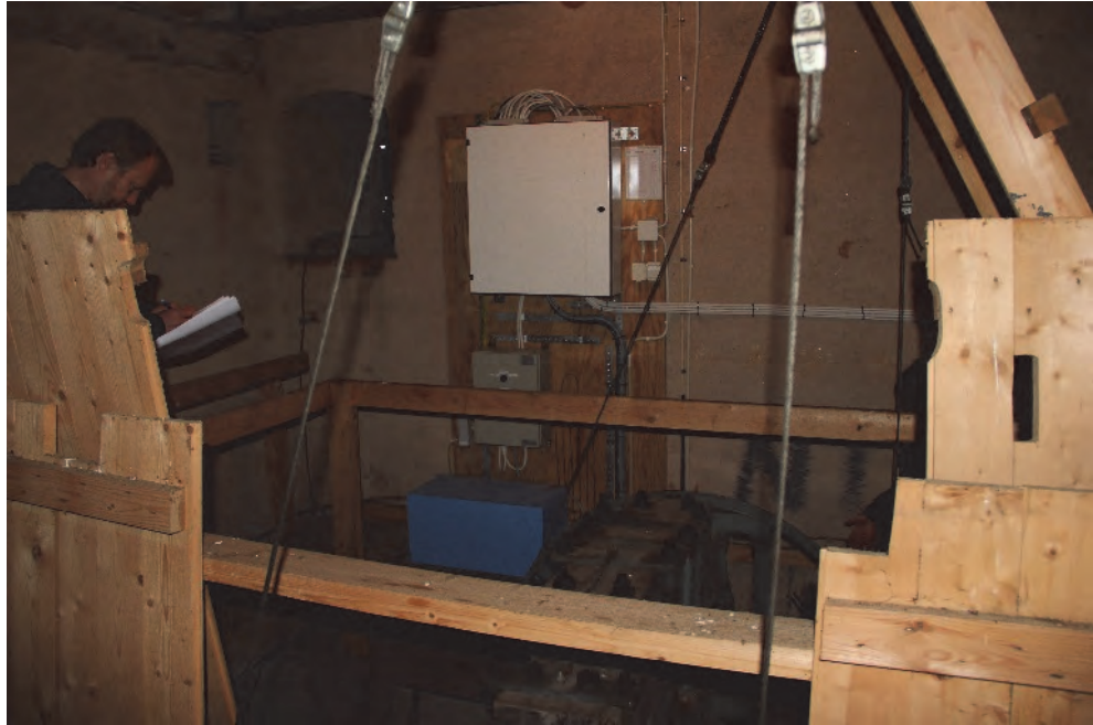
Figur 12. Ny elcentral på vinden.