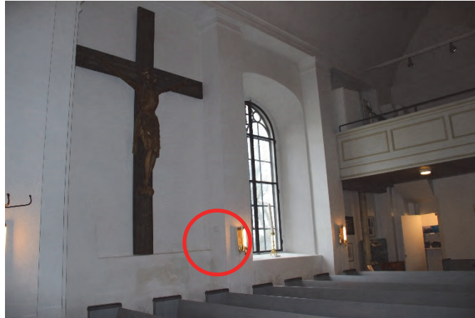
Figur 8. Givare placerad på södra långhusväggen.