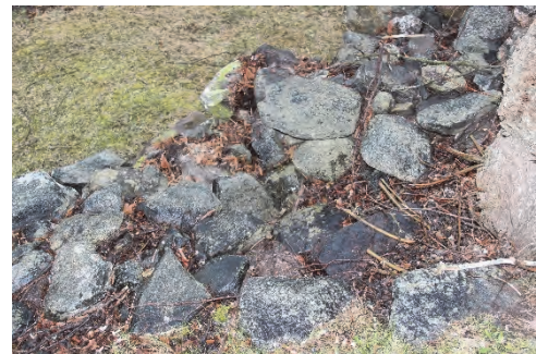
Figur 14. Den gamla transformatorbyggnaden, där nya utombusgivaren har placerats, har grävts in i kyrkogårdens terrassering mot väster och ligger delvis dold under den kallmurade bogårdsmuren. Vid besiktningen rasade delar av muren och den lilla trappa som lagts vid sidan om transformatorbyggnaden döljs nu delvis av nedrasade stenar.