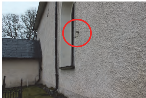
Figur 13. Gammal givare på kyrkans norra vägg som skall demonteras.