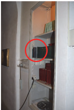
Figur 9. Manöverpanel till klockor etc. placerad i nischen i den norra läktarunderbyggnaden.