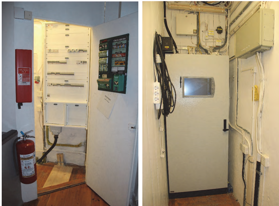
Figur 5 och 6. Elcentralrummet efter åtgärder med nya el- och styrskåp. På vänstra bilden syns det tidigare upptagna golvet samt de två håltagningar som gjorts mot väster sedan tidigare.