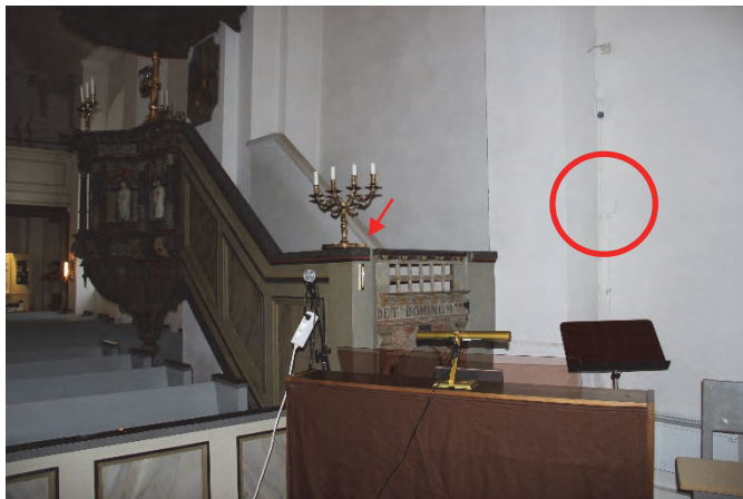
Figur 10. Givaren vid predikstolen har placerats i ett mindre gynnsamt läge över en radiator (se ring) och skall flyttas till baksidan av predikstolens norra rücke (vid pilen).