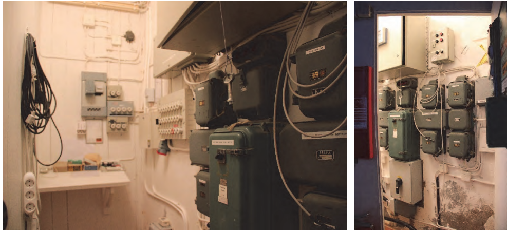
Figur 3 och 4. Elcentralrummet före åtgärder.