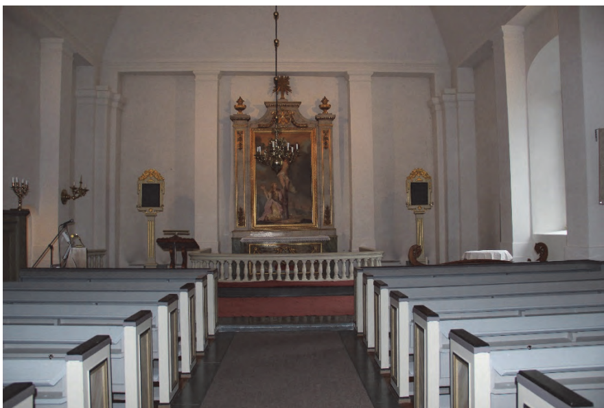
Figur 2. Kyrkans interiör mot öster.

En ny elcentral är placerad i tornet över klockorna i samma läge som en äldre central. Från denna går nya kablar till styrutrustningen och klockorna. Kablarna följer i princip tidigare kabelvägar.