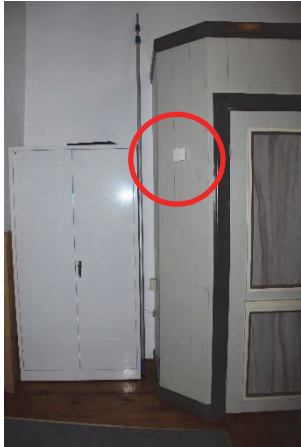
Figur 7. Givare placerad i vapenhuset.