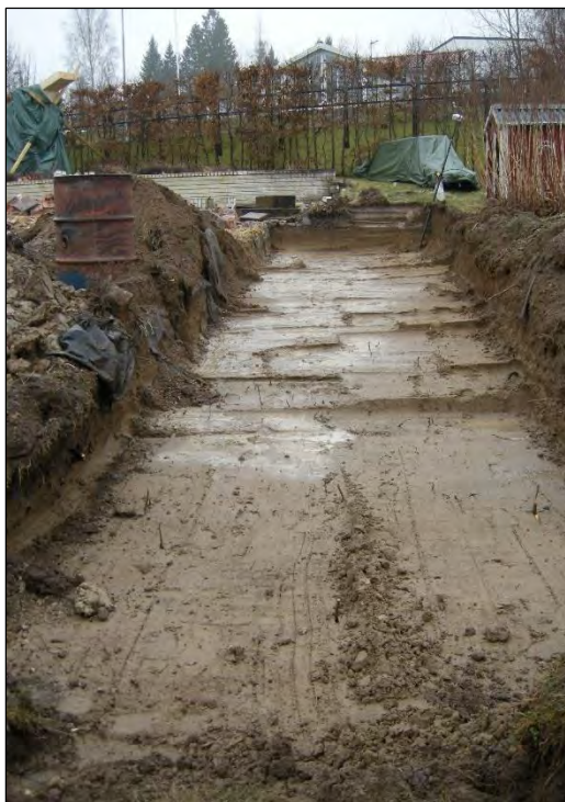
Figur 5. Schakt 2. Foto från norr av Karin Berggren.