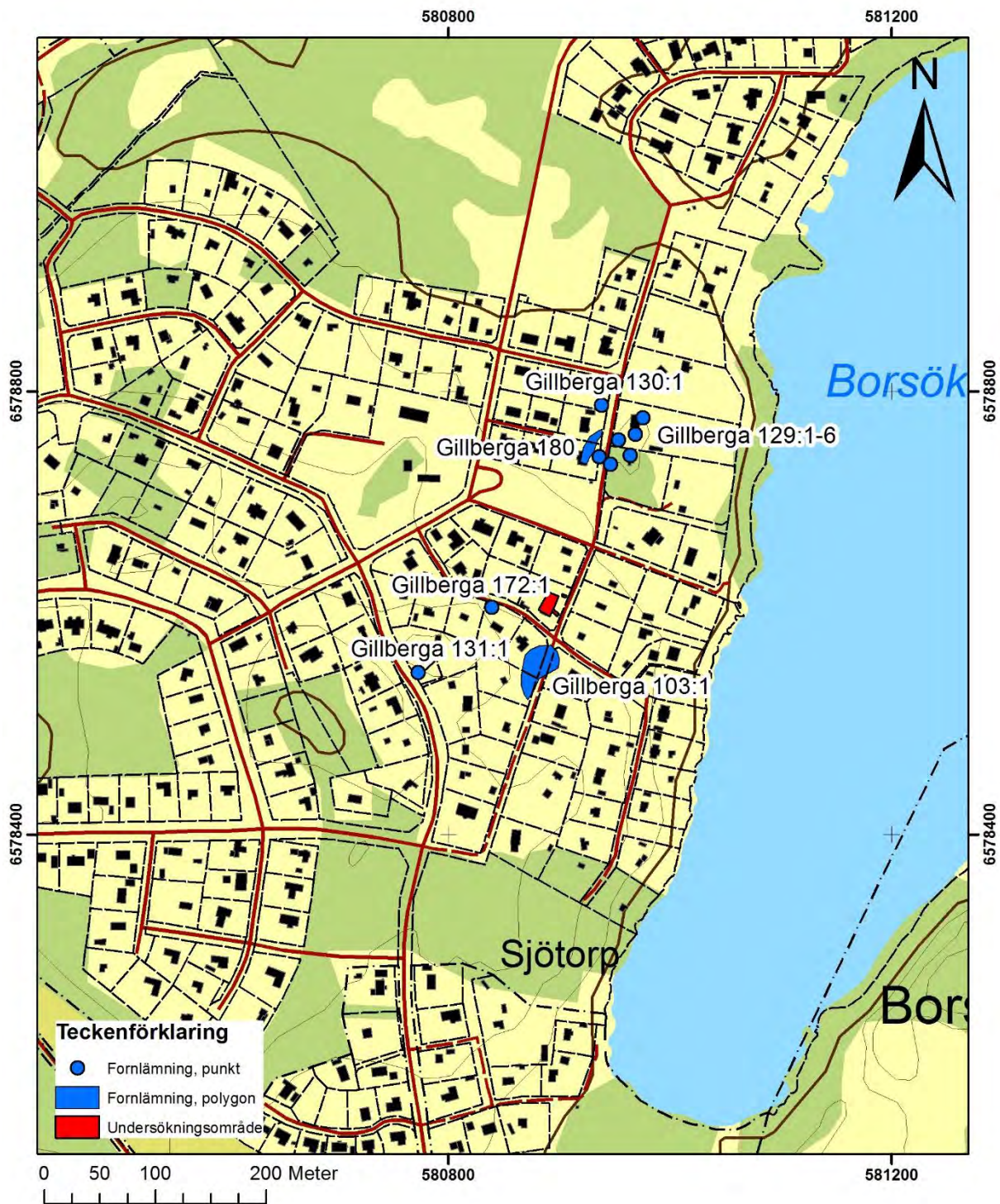
Figur 2. Utdrag ur digitala Fastighetskartan med registrerade fornlämningar enligt FMIS markerade med blått. Undersökningsområdet inom fastigheten Borsökerna 1:81 är markerat med rött. Skala 1: 5000.