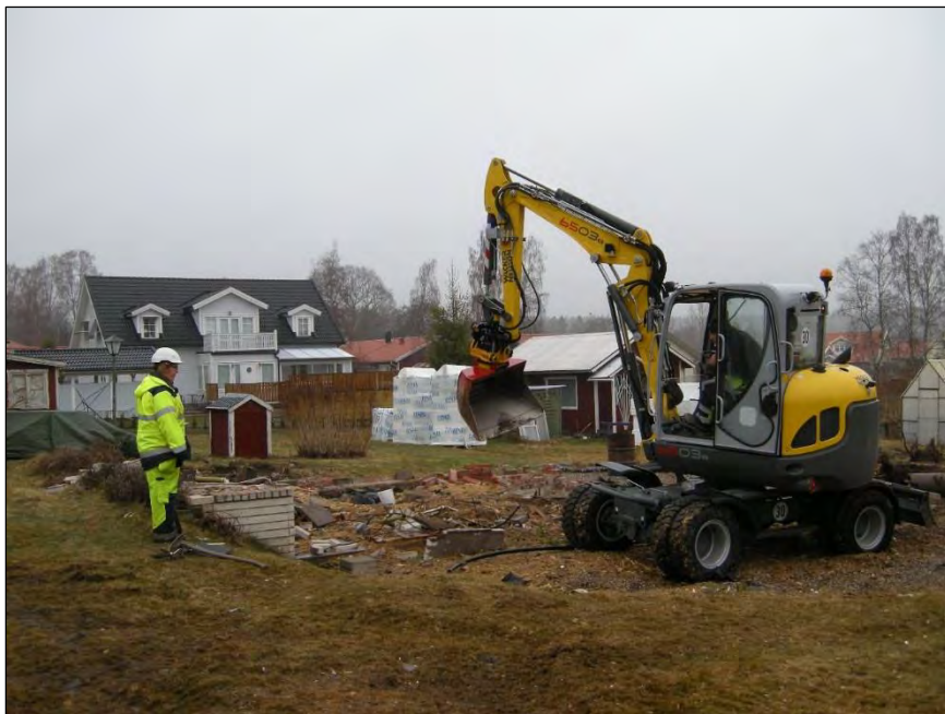
Figur 4. Vi påbörjar schaktningen inom fastigheten Borsökna 1:81 vid det sydöstra hörnet av husgrunden (Schakt 1). På bilden kan man se hur grunden är nedgrävd i marken. Foto från öster av Karin Berggren.

I sökschakten framträdde en lagerföljd i form av ett tunt lager av antingen påfört grus eller grässvål, följt av ett 0,4 – 0,5 meter tjockt lager homogen siltig sand varav den övre decimetern var humuspåverkad. Under den siltiga sanden följde homogen, något sandig lera (se figur 5). Inga spår av kulturpåverkan påträffades, bortsett från husgrunden till det nyligen rivna fritidshuset samt ledningsschakt och dräneringsrör med anknötning till detta.