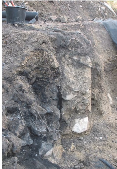
Figur 6. Till vänster ses sten och kol. Till höger ses betong som ingick i konstruktionen. Fotograferat från öster av Jonas Ros.