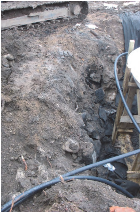
Figur 5. Nedtill till vänster ses betong som hörde samman med konstruktionen. Fotograferat från öster av Jonas Ros.