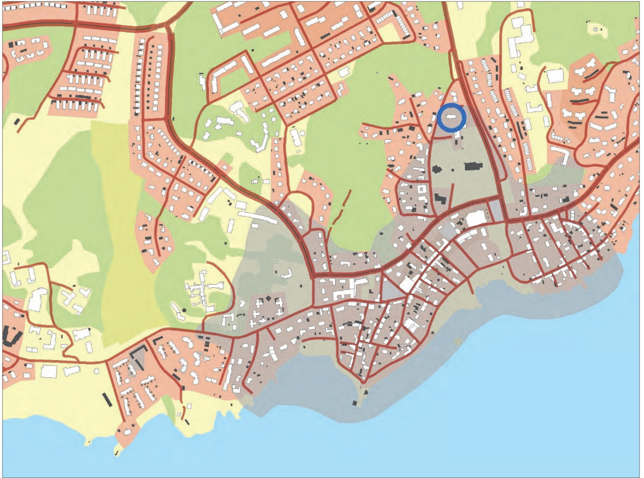
Figur 1. Undersökningsplatsens läge markerat med en ring. Utdrag ur Digitala fastighetskartan. Sigtuna stad fornlämning 195:1 är markerad med grå färg. Skala 1:10 000.