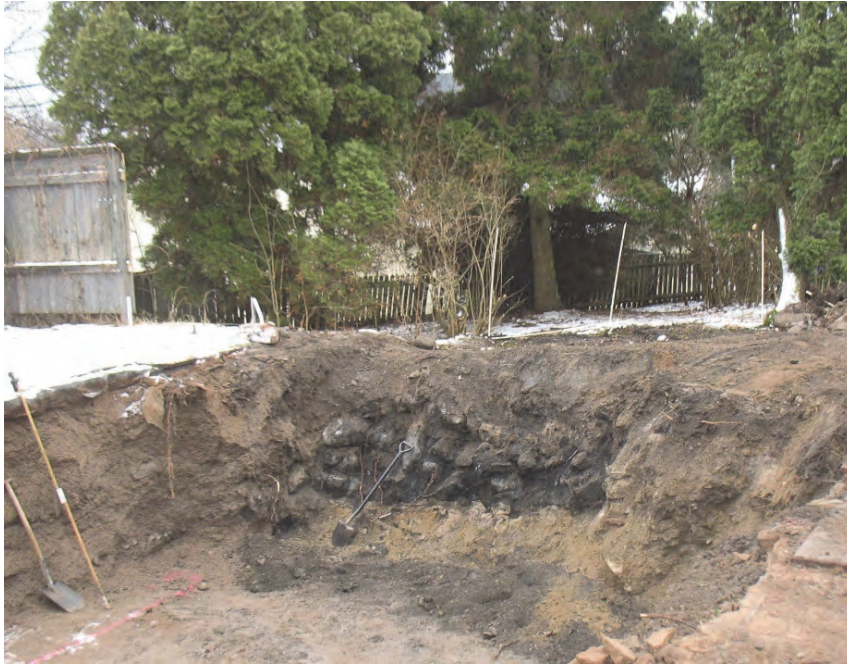
Figur 4. I den södra schaktväggen i schakt 3 framkom stenar och kol. Det visade sig att det ingick betong i konstruktionen. Fotograferat från nordväst av Jonas