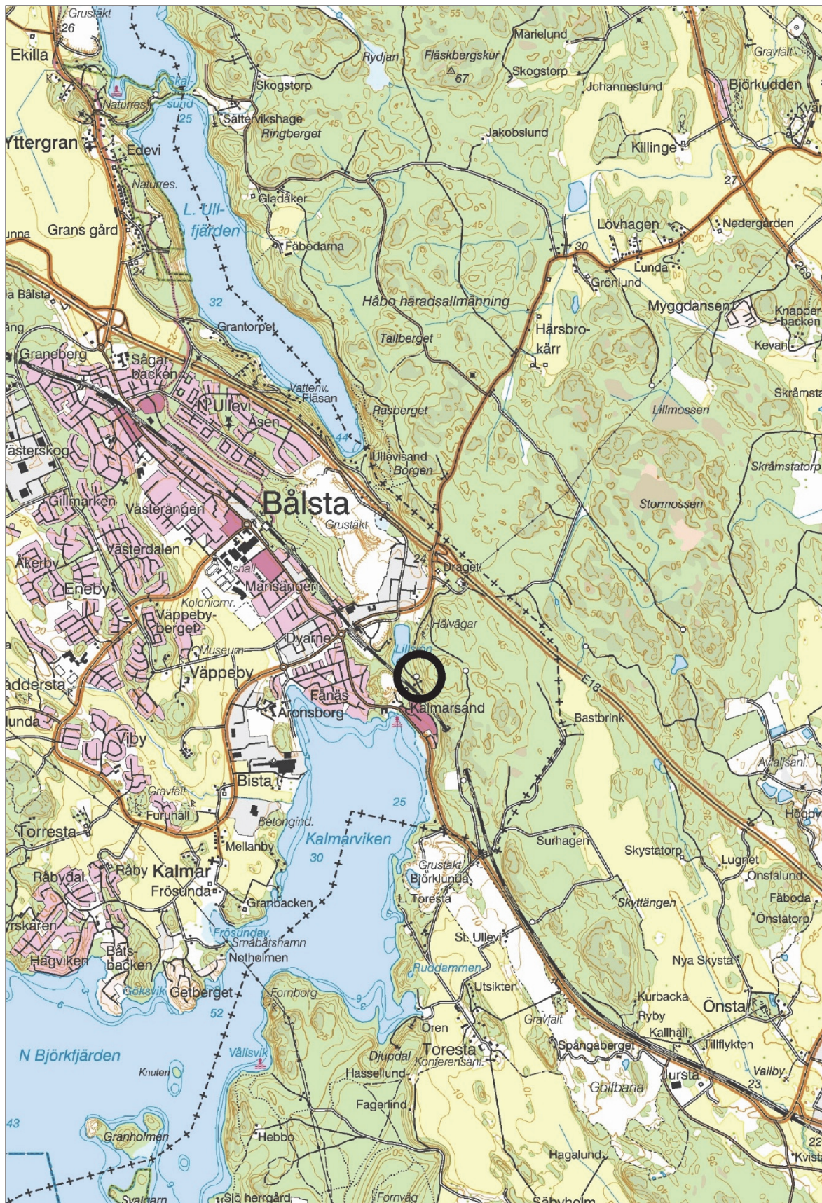
Figur 1. Utredningsområdets läge markerat med en svart ring. Utsnitt ur digitala terrängkartan. Skala 1:50 000.