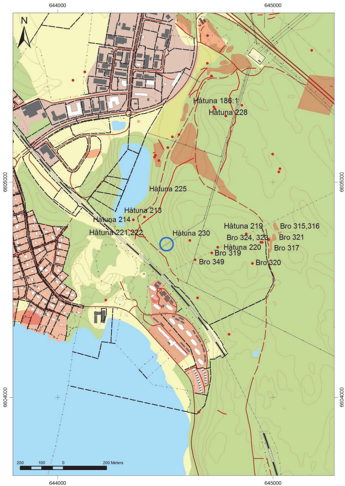
Figur 2. Utredningsområdet markerat med en blå ring och de i FMIS registrerade lämningarna markerade med röda polygoner, punkter och linjer. Ett urval är numrerade. Utsnitt ur digitala fastighetskartan. Skala 1:10 000.