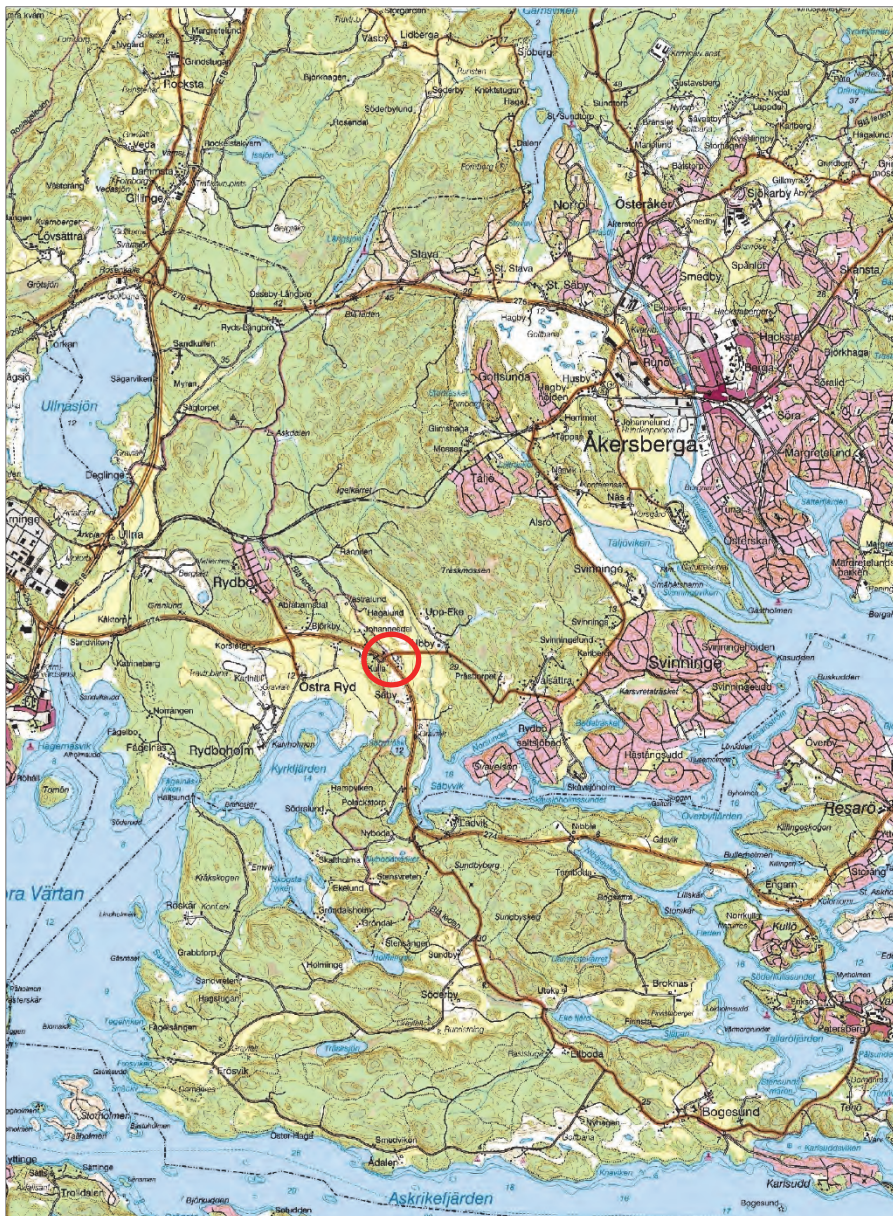
Figur 1. Undersökningsplatsens läge, markerat med en röd ring. Utdrag ur digitala terrängkartan. Skala 1:50 000.