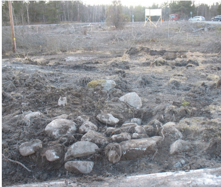
Figur 4. Inom undersökningsområdet påträffades en stensamling (A2) som dumpats på platsen. Bakom stenarna ses ett sumpigt område, och i bakgrunden Vaxholmsvägen. Fotograferat från öster av Jonas Ros.

På två punkter hade grävmaskinen vid körning inom området frilagt delar av ett lager med kol och sot inom en yta av ca 7×7 meter. Delar av detta lager frilades och undersöktes genom handgrävning. I lagret fanns varken skörbränd sten eller fynd. Lagret bedömdes därför vara ett brandlager som t.ex. uppkommit vid en skogsbrand.