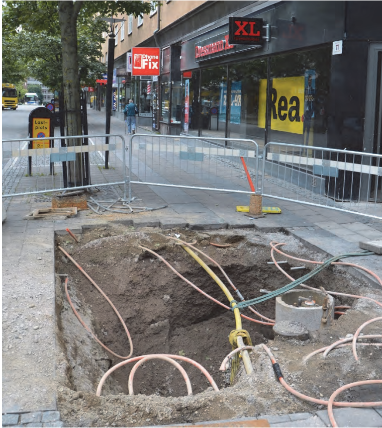
Figur 4. Det upptagna schaktet fotograferat från norr.