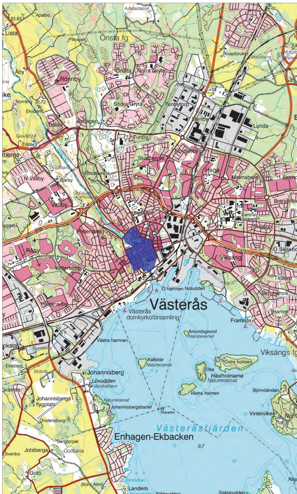
Figur 1. Utdrag ur digitala Gröna kartan för Västmanland. Västerås stad, fornlämning 232:1, markerad. Skala 1:50 000.