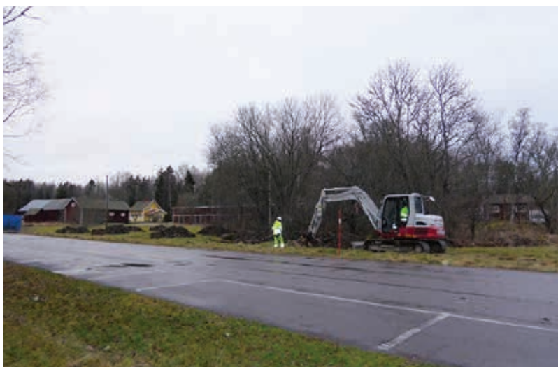
Figur 6. Arbetsbild. Schakt 14 grävs. Fotograferat från sydost av Maud Emanuelsson.