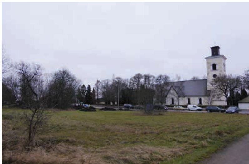
Figur 5. Översikt över undersökningsområdet och Simtuna kyrka. Schakt 7–9 närmast i bild. Fotograferat från nordväst av Maud Emanuelsson.