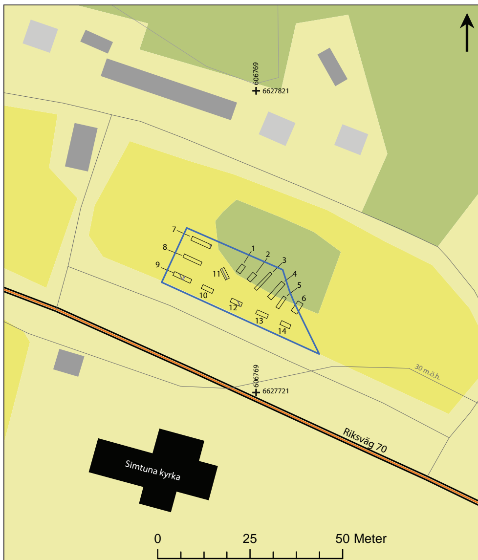
Figur 3. Schaktplan. I schakt 7, 9, 11 och 12 påträffades diken. För schaktbeskrivningar se bilaga 1. Skala 1:1000.

Ingen fornlämning påträffades vid utredningen. KM anser att ingen ny antikvarisk åtgärd fordras. Det är dock Länsstyrelsen i Uppsala län som är beslutsfattande i frågan.