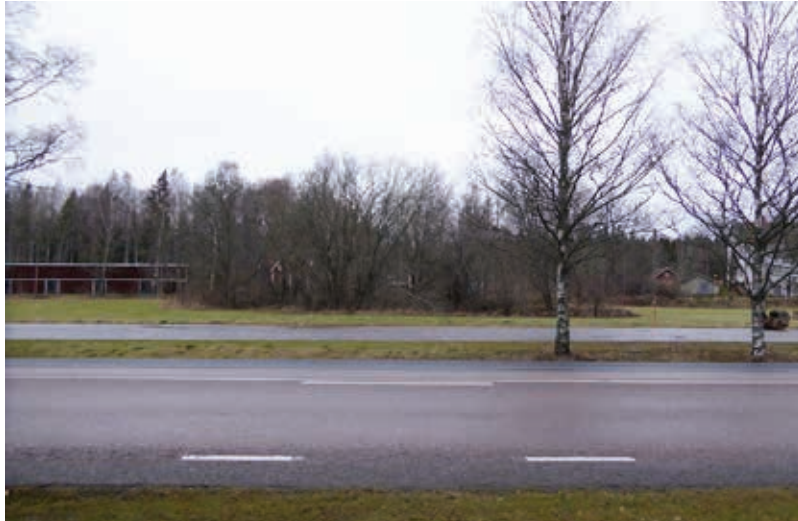
Figur 4. Undersökningsområdet ligger mellan åkerbakket och den smalare asfalterade vägen. Vy sett från Simtuna kyrka.