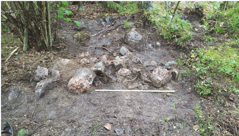
Figur 5. Stenpackningen öster om Österåker 499 i sektion. Tumstocken på marken markerar en meter.

Stenraderna Österåker 499 kan inte kopplas till någon företeelse i omgivningen (t.ex. en stensträng eller stenfri yta) som kan förklara dem som anlagda. De ansluter till ett naturligt stenigt område och det kan inte uteslutas att det rör sig om naturbildningar. Stenraderna kvarstår som övrig kulturhistorisk lämning. (se tabell 1)