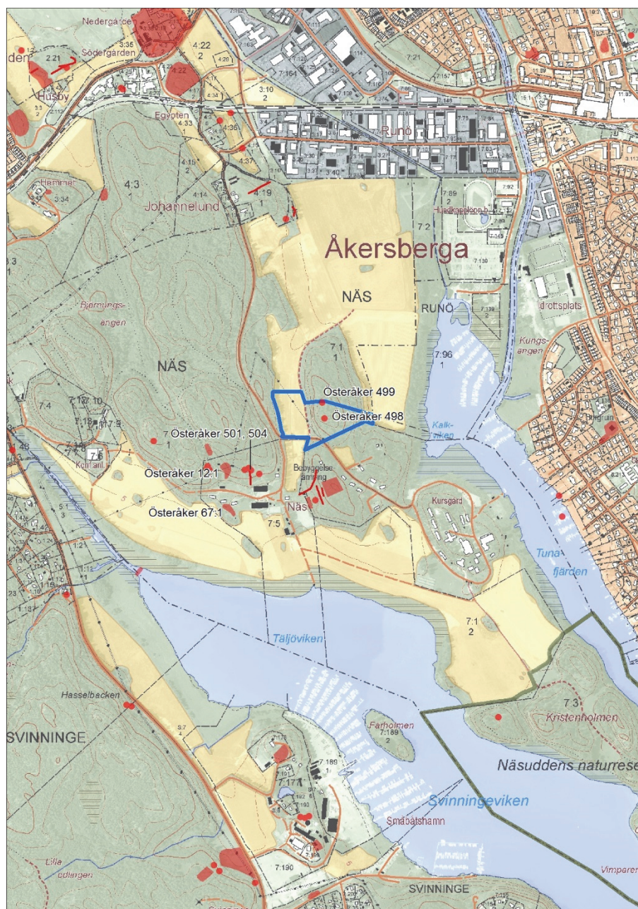
Figur 3. Utredningsområdet markerat med en blå linje. Fornlämningarna enligt FMIS är markerade som röda punkter, linjer och polygoner. Utsnitt ur digitala fastighetskartan. Skala 1:20 000.

Inom utredningsområdet redovisar FMIS två lämningar. Österåker 498 är registrerad som en stensättning med status som fornlämning och Österåker 499 är registrerad som två stenrader med status som övrig kulturhistorisk lämning.