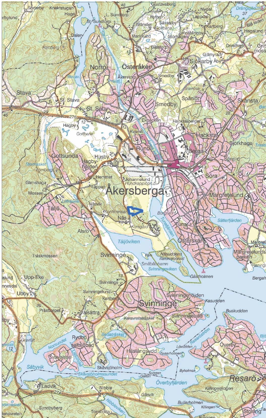
Figur 1. Utredningsområdets läge markerat med en blå linje. Utsnitt ur digitala terrängkartan. Skala 1:50 000.