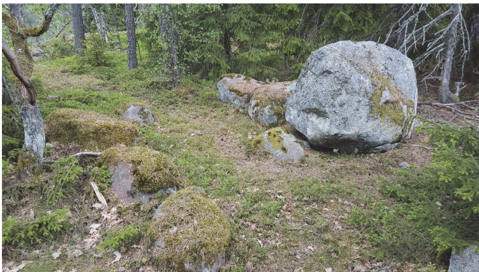
Figur 6. Stenraderna Österåker 499.

Stenraderna Österåker 499 kan inte kopplas till någon företeelse i omgivningen (t.ex. en stensträng eller stenfri yta) som kan förklara dem som anlagda. De ansluter till ett naturligt stenigt område och det kan inte uteslutas att det rör sig om naturbildningar. Stenraderna kvarstår som övrig kulturhistorisk lämning. (se tabell 1)