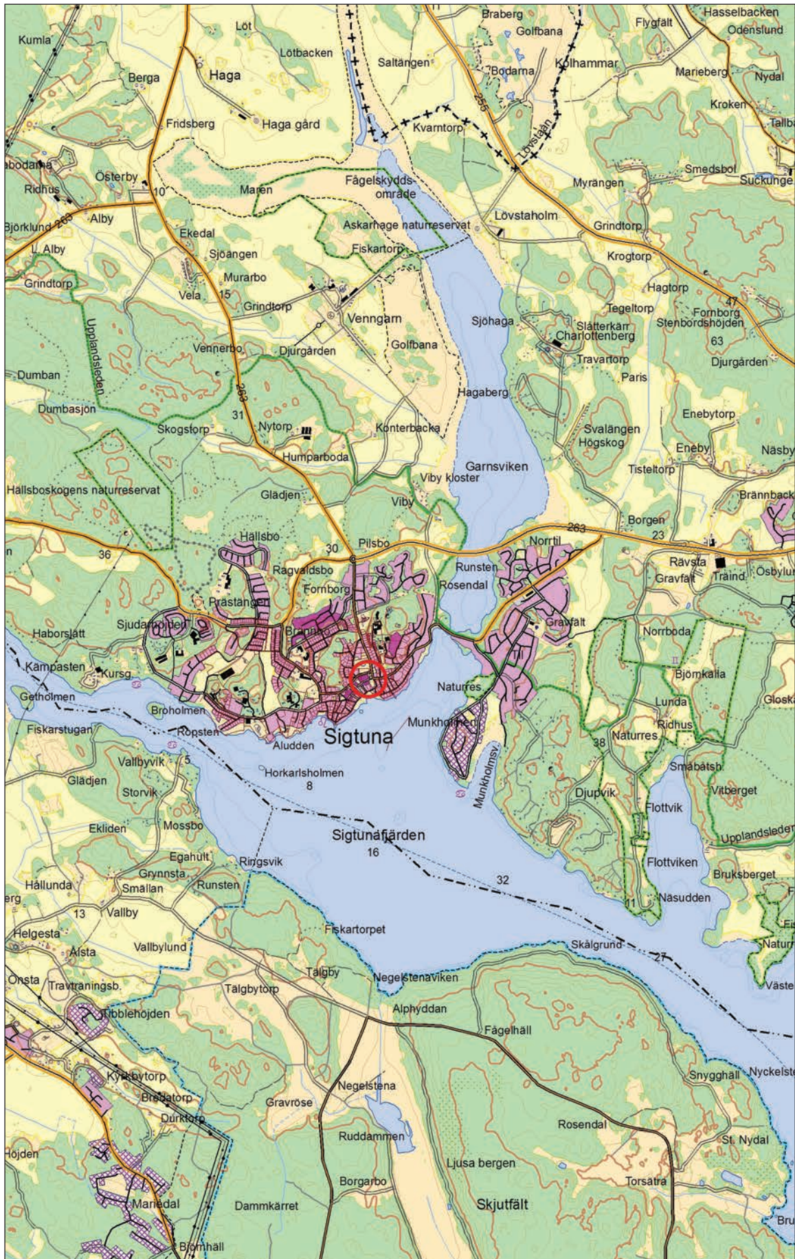
Figur 1. Utdrag ur digitala Terrängkartan. Platsen för undersökningen är markerad med en röd cirkel. Skala 1:50 000.