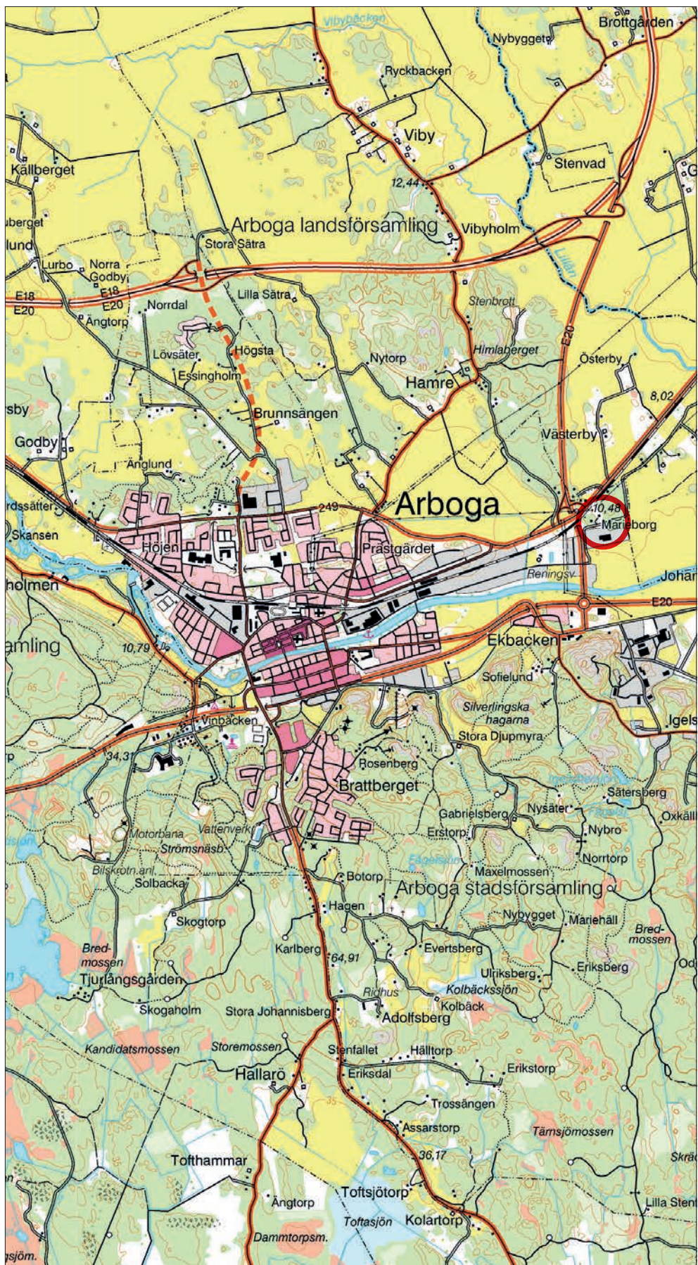
Figur 1. Undersökningsplatsens läge, markerat med en röd cirkel. Observera att av de byggnader som finns markerade inom Marieborgs tomt återstår det idag endast husgrunder. Utdrag ur Gröna kartan. Skala 1:50 000.