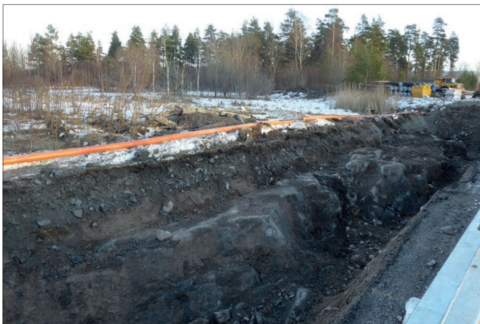
Figur 4. Det östra partiet av schaktet. Notera hur berggrunden har sprängts ner till en lägre, plan yta i samband med byggandet av vägen. Foto mot ONO av Kristina Jonsson.

Inget av antikvariskt intresse framkom vid schaktningen eftersom marken var störd av tidigare markingrepp. I samband med anläggandet av Styrmansgatan har man schaktat ner marknivån – och även sprängt bort berg – i delen där bebyggelse legat på tidigare och mer jämnt sluttande impedimentmark. I övrigt så löpte en relativt nyligen nedlagd optokabel längs hela sträckan, på en meters djup mitt i schaktet, och nedgrävningen för denna föreföll ha varit lika omfattande som för det schakt som denna övervakning berörde.