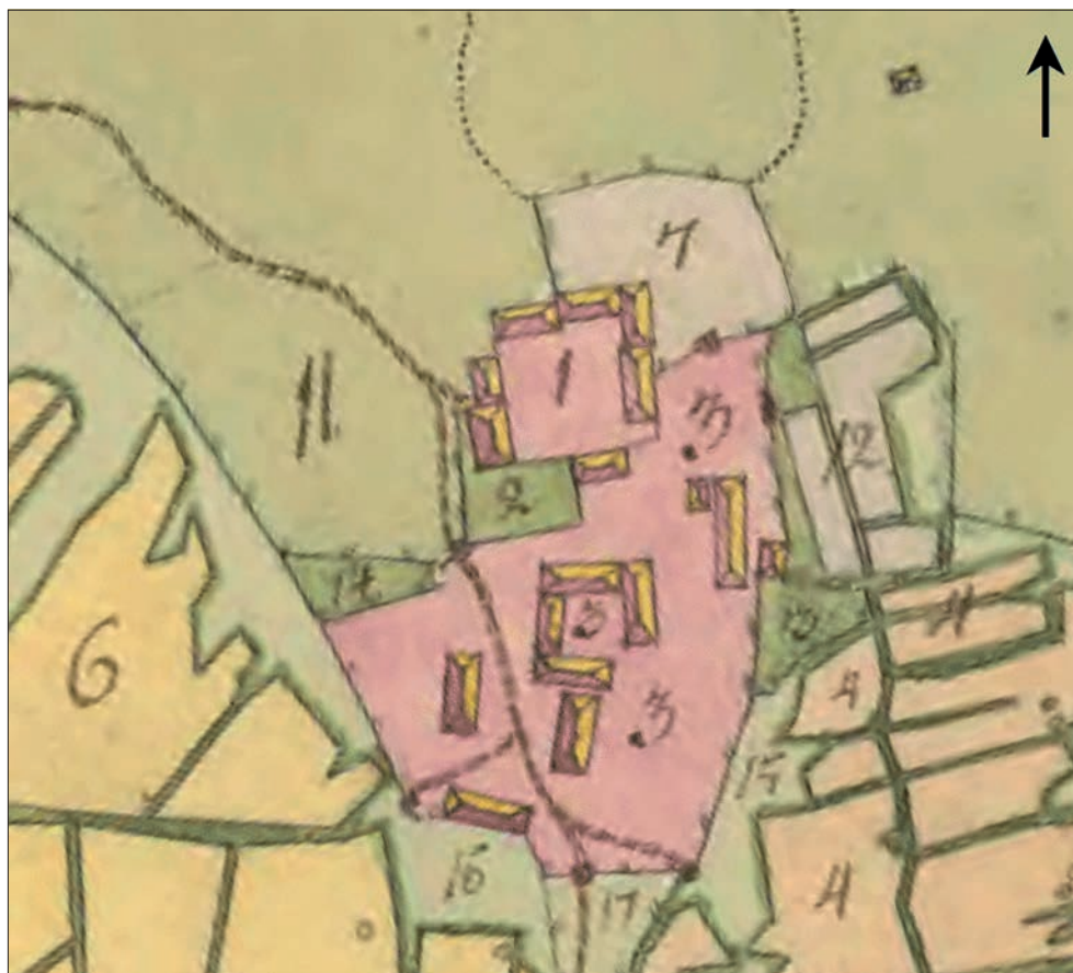
Figur 2. Utdrag ur kartan från 1780 som visar Arboga hospitals jord. Lantmäterialet T2-21:1. Skala 1:2 000.

Vid 1500-talets mitt hade Helgeandskyrkan i Arboga stad byggts om till en kungsgård för Gustav Vasa. Kungen besvärades dock av närheten till de fattiga och sjuka på helgeandshuset, och 1558 förordnade han att de skulle flyttas till en plats ”på gamle kyrkogården ovanför Arboga”, men den flytten blev troligen inte av. År 1596 hade helgeandshuset blivit bostad åt fogden. Åtminstone en del av stadens fattiga, gamla och sjuka flyttades därför under tidigt 1590-tal till hospitalet vid Marieborg. Det är oklart om man återupptog verksamhet på den plats där det medeltida hospitalet hade legat, eller om det rörde sig om en nyupprättad anläggning. År 1595 fanns där 25 personer intagna och 10 personer var anställda för att sköta verksamhet och jordbruk. Kapellanen i Säterbo tjänstgjorde som präst på hospitalet, men någon kyrkobyggnad fanns ej. En beskrivning från denna tid anger att ”kyrka hava de i samma byggnad som de äro i själva, dock genom en vägg avdelad från deras rum”. Från 1773 övertog Serafimerorden kontrollen av sjukvårdsinrättningarna i landet. Arboga hospital lades ner några år senare och verksamheten flyttades till Västerås hospital (Bergquist 1966:33ff).