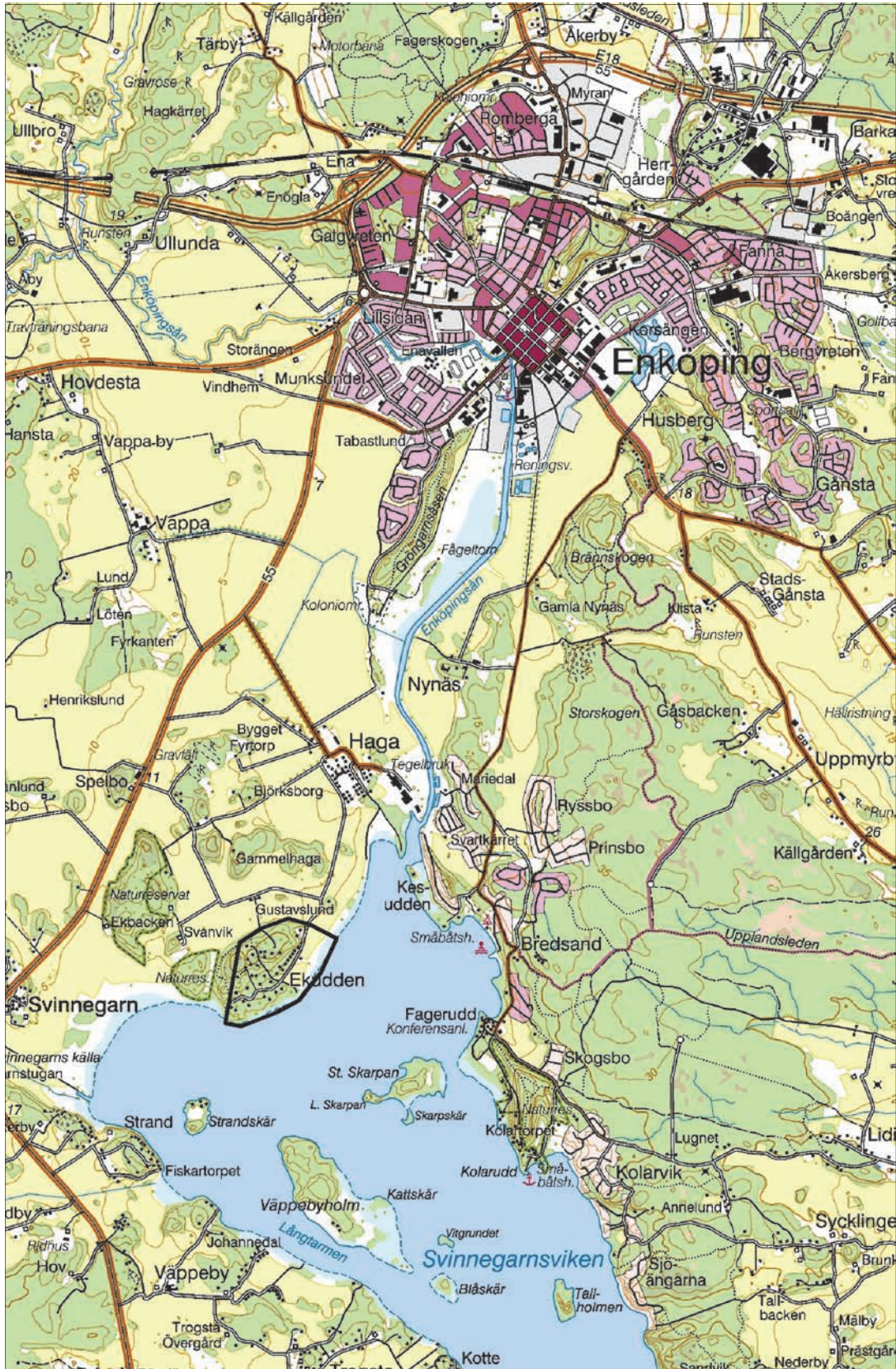
Figur 1. Utredningsområdet markerat med en svart linje. Utdrag ur Terrängkartan. Skala 1:50 000.